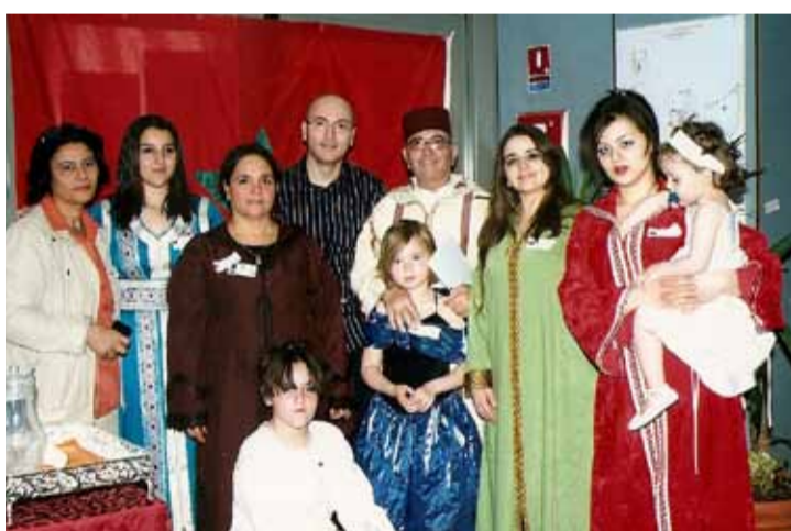
Pour la 3 e édition de la Journée Internationale le Maroc était mis à l'honneur.