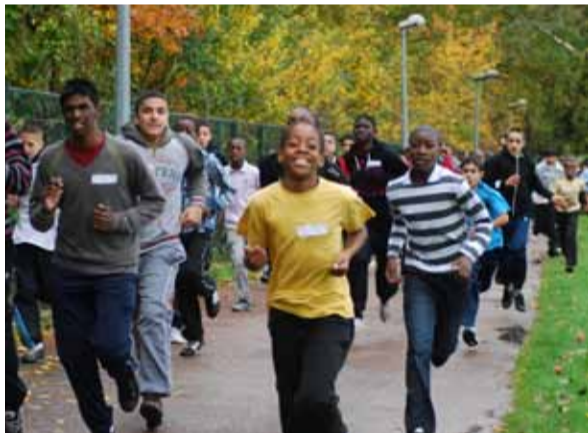
Judi 4 novembre, c'était le cross des collégiens de Grigny au stade Jean Miaud