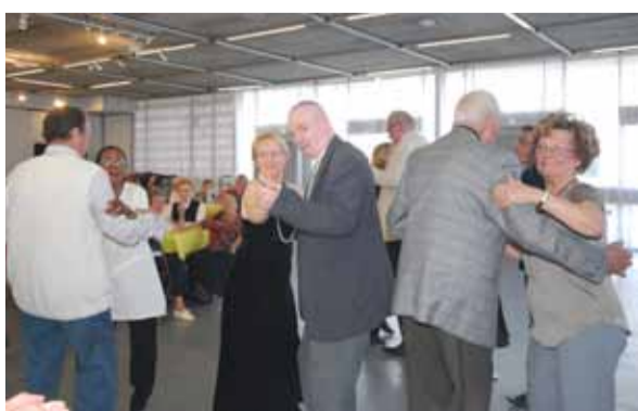
Les aînés swingaient le 20 octobre au Centre Culturel Sidney Bechet sur les rythmes de l'orchestre « Nelly Coustelière » dans le cadre de la semaine bleue.