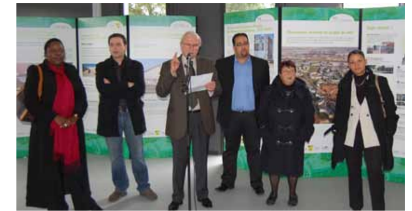
L'ouverture de ce superbe bâtiment correspond avec les 40 ans de la Grande Borne. Un moment fort et émouvant pour les habitants et les élus.

eaux » reconnaissent-elles. Tous étaient admiratifs face à cette réalisation. La veille encore les agents des services municipaux, les partenaires de la ville, le GIP et les associations travaillaient sans relâche. En un temps record, ils ont installé les expositions « la Grande Borne à 40 ans », « l'art dans la cité », « Regards sur mon quartier », sur le projet de rénovation urbaine, les luttes de la ville et agencé les différents espaces. Durant toute la journée le CVS ne désemplit pas.