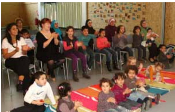
Une quinzaine d'enfants accompagnés de leur Maman étaient au spectacle de «Sophie la girafe», jeudi 7 octobre, réalisé par Elvi du lieu passerelle et Nathalie de la bibliothèque municipale. Toute l'équipe tient à remercier les collègues pour cette l'agréable moment passé.