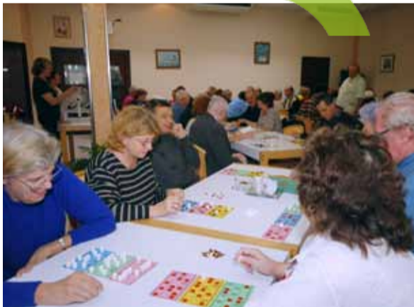
Le foyer A. Laudat était animé le 22 octobre dernier. Les participants étaient nombreux à la journée loto.