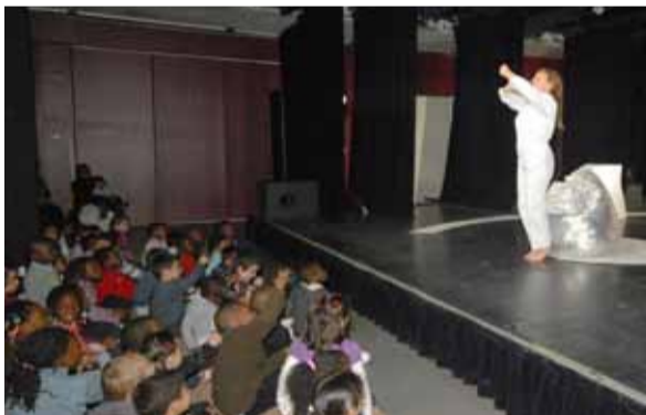
Il y avait plein de « petits » monde au Centre Culturel Sidney-Bechet vendredi 15 octobre pour le spectacle de la compagnie La Lune Rousse « Ma fusée, c'est une machine magique... ». Toutes les écoles maternelles de Grigny étaient là.