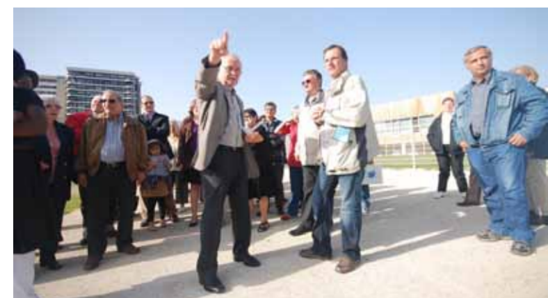
Les habitants de Grigny II ont pu découvrir le nouveau groupe scolaire Vlamincck et l'aménagement du coteau le samedi 9 octobre à l'invitation du maire.

Les sillons tracés dans son champ en donnent les perspectives. C'est le futur parc paysager du coteau Vlamincck. Toute une partie du quartier prend ainsi un autre visage, agrémentée d'allées, de pentes douces, d'arbres et de futurs