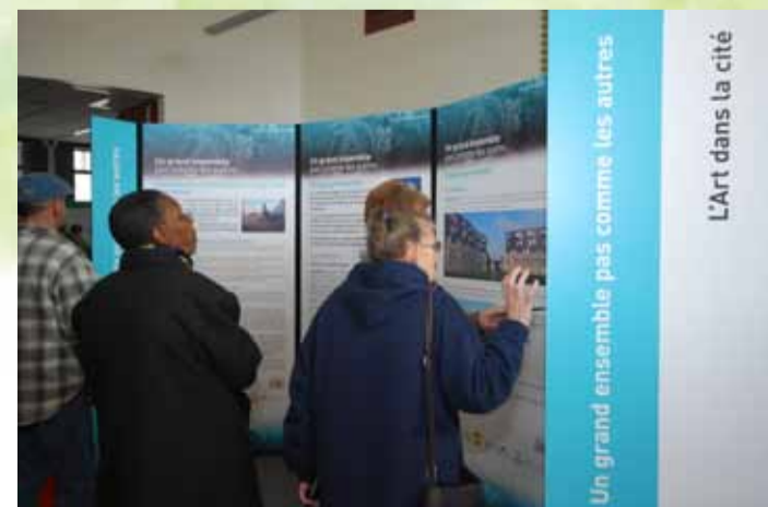
p.5 Journée portes ouvertes du nouveau Centre de la Vie Sociale