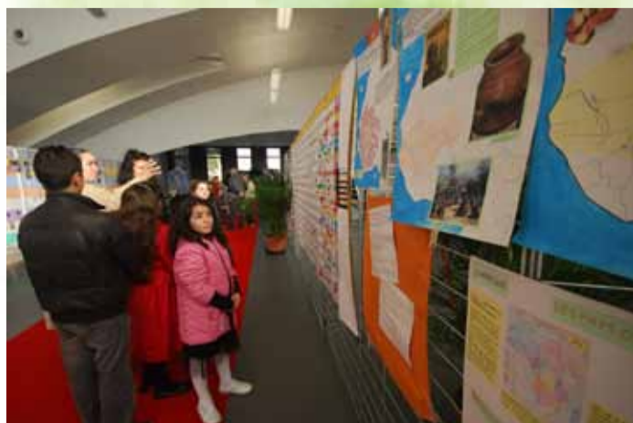
p.3 Apprendre à voyager dans le temps avec l'association « Décider »