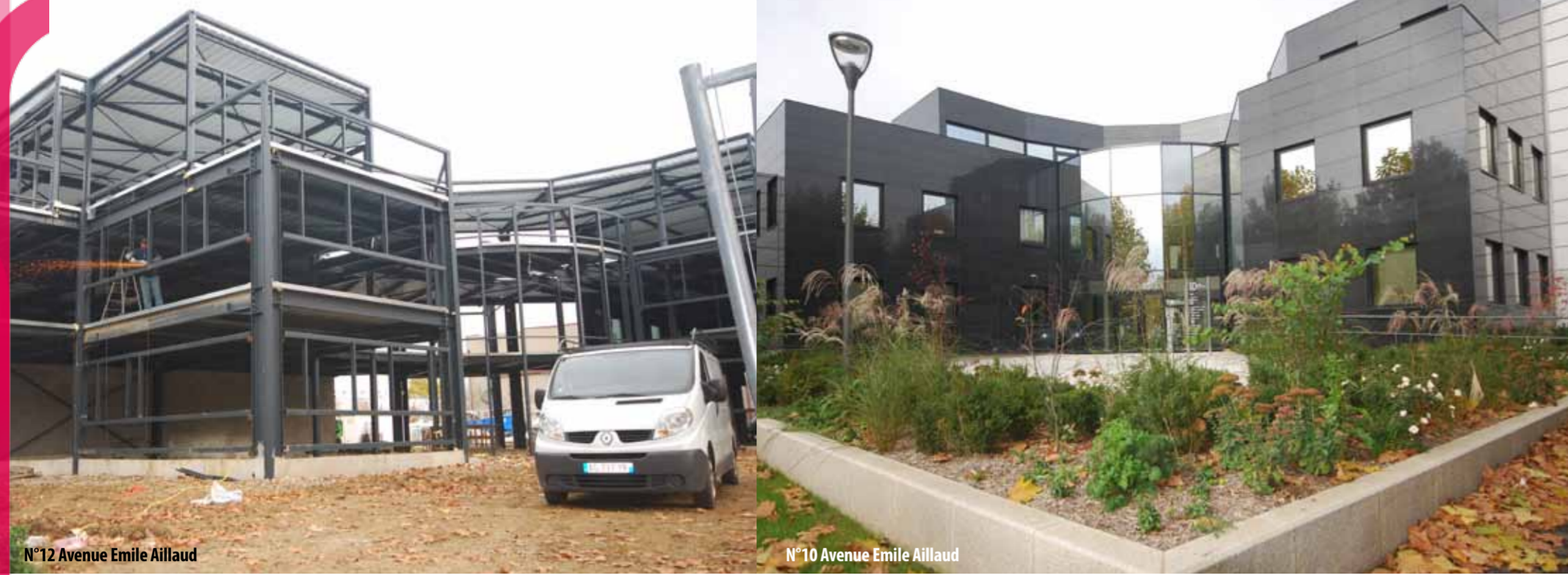
N°12 Avenue Emile Aillaud