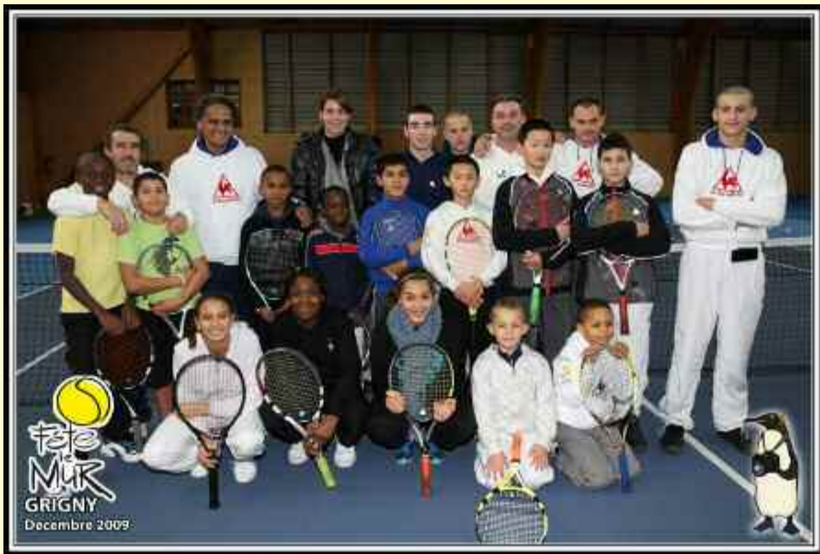
Au stade municipal des Chaulais la promotion espoir compétition de l'association «Fête le mur» était en stage 4 jours en décembre. Les participants de 7 à 14 ans se sont pris au jeu.

Toute l'année, une centaine de jeunes grignois, des quartiers de la ville, s'entraînent et jouent gratuitement au tennis, grâce à l'association «Fête le mur» qui œuvre pour la démocratisation de ce sport, et à la volonté conjointe de la Municipalité qui met à disposition des infrastructures adaptées, pour que toutes et tous puissent en profiter.