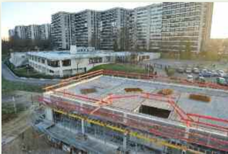
Le chantier de l'école Vlamincq à Grigny II.

Livraison de 35 habitations en location-accession rue de Schio ; 1 e tranche des travaux de l'église ; Extension du cimetière communal dans une conception paysagère ; Réfection de voiries (route de Corbeil et chemin vert) ; Construction d'un restaurant sur la RN7 ; Résorption des adductions d'eau potable en plomb ; Etude du patrimoine ancien (parc Saint Lazare, commons de l'Arbalète, propriété Baron...)