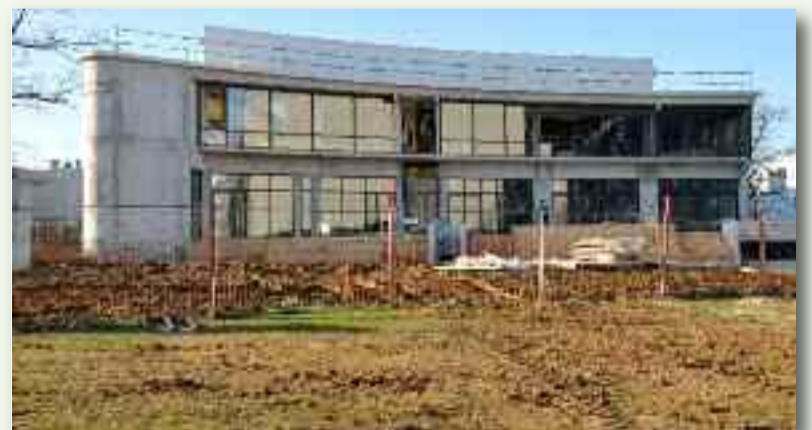
Le nouveau centre de vie dans le quartier de la Grande Borne.