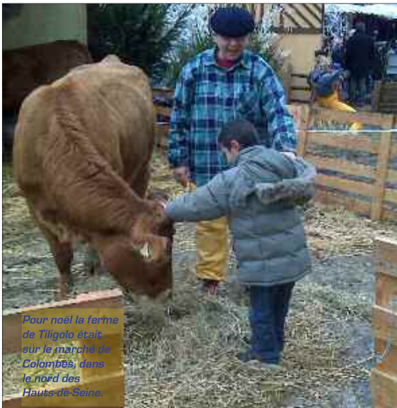
Pour Noël la ferme de Tiligolo était sur le marché de Colombes, dans le nord des Hauts-de-Seine.

C'EST une ferme pédagogique itinérante qui fait du spectacle. A la ville comme à la campagne, elle plante le décor dans les écoles, les crèches et les maisons de retraites, les galeries marchandes, dans les quartiers, partout en France. On n'avait pas vu de vraies stars du spectacle depuis Saturnin le canard de la chaîne de l'ORTF. Veau, vache, cochon, couvée donnent la