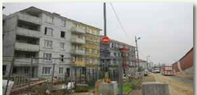
Le bâtiment qui accueillera des logements locatifs, des commerces et une maison médicale pluridisciplinaire en centre ville.