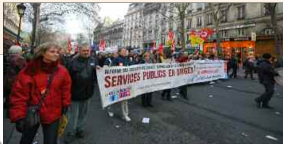
Manifestation le 21 janvier à Paris, à l'appel de plusieurs syndicats (CGT, SUD, FSU...) pour la défense des services publics et contre la « réforme des collectivités territoriales ».