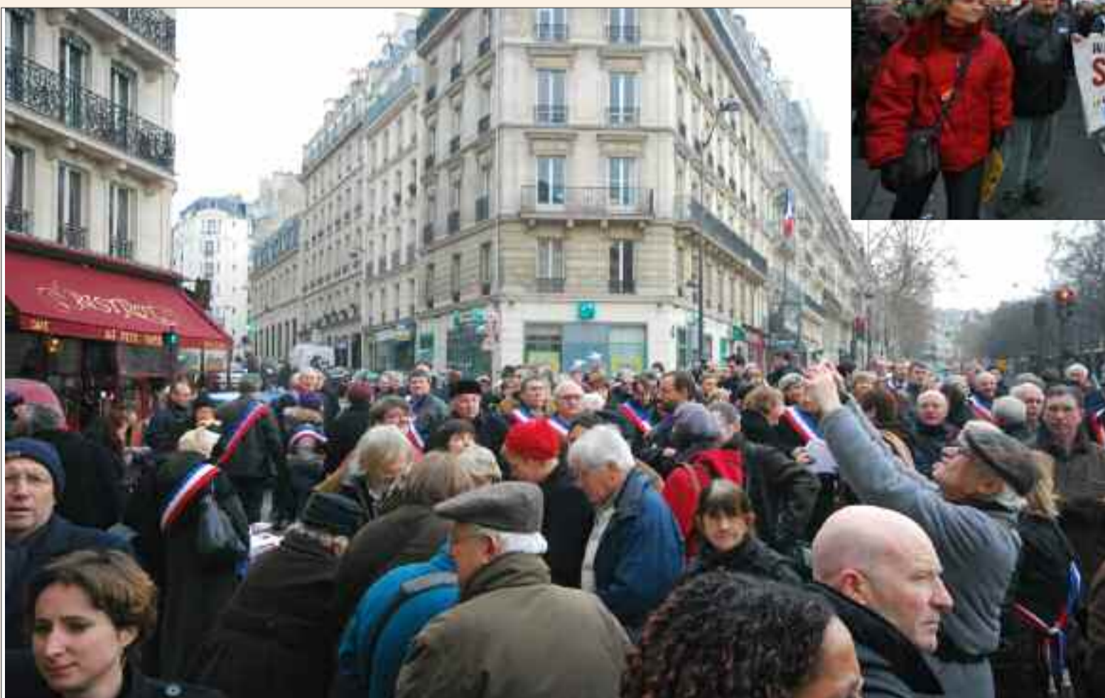
De nombreux élus étaient venus manifester leur opposition à la « réforme des collectivités territoriales » devant le Sénat à Paris le 19 janvier, jour de l'ouverture du débat parlementaire sur ce projet.