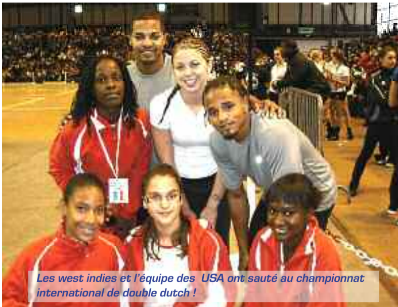
Les west indies et l'équipe des USA ont sauté au championnat international de double dutch !

Les supporters de Grigny ont pu assister à la qualification des west indies, au 2 e championnat international de double dutch les 30 et 31 octobre, à la halle Carpentier à Paris. Au programme une première journée de qualifications et pour finir des finales d'épreuves de vitesse et de free style.... Sur plus de 200 compétiteurs de 12 pays, Afrique du sud, Allemagne, Belgique entre autres, une trentaine de sportifs représentaient la France. 10 équipes pour la région Ile-de-France, de Vitry-sur-Seine, Saint-Ouen, Ourie, Grigny, Créteil et Paris étaient sélectionnées.