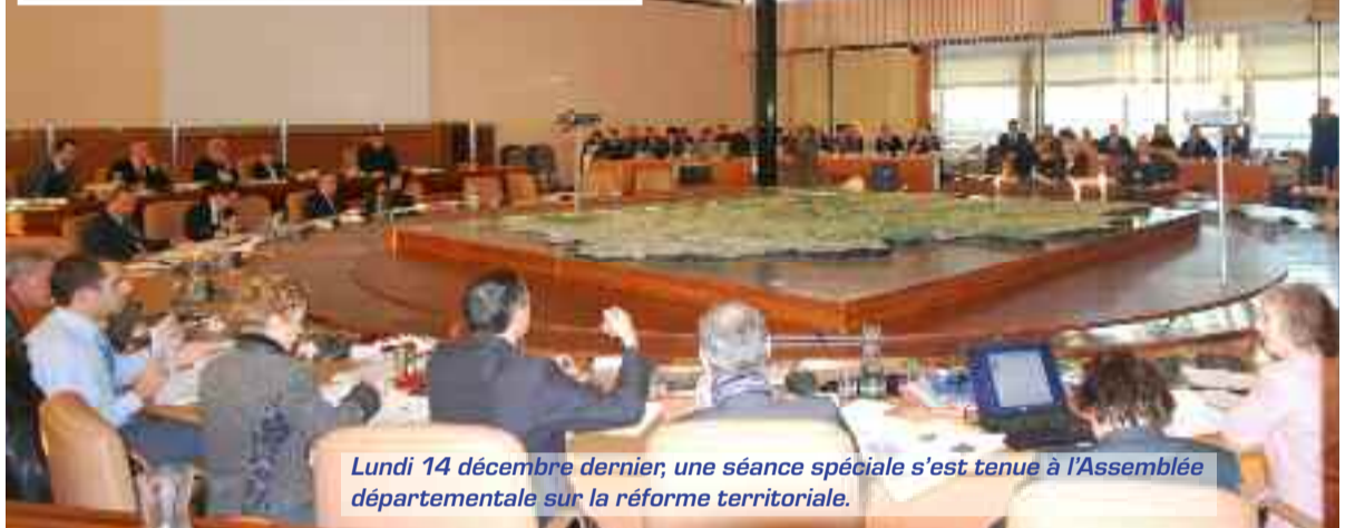
Lundi 14 décembre dernier, une séance spéciale s'est tenue à l'Assemblée départementale sur la réforme territoriale.

Parmi les propositions du Conseil Général de l'Essonne on trouve la solidarité entre les territoires. Cela concerne directement notre ville. Le Conseil Général demande que soit engagée une véritable réflexion pour mettre en œuvre une péréquation (redistribution) plus efficace fondée sur des ressources nouvelles, notamment tirées des activités financières. Autre proposition avancée : réformer la fiscalité locale notamment par la prise en compte de la valeur ajoutée dans la contribution financière des entreprises. Mais aussi que la Taxe d'Habitation tienne compte des revenus des ménages pour devenir enfin progressive.