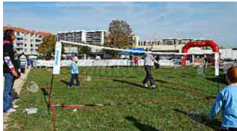
Les volleys des raquettes ont tourné dans le ciel toute la journée.

C'était mercredi 28 octobre sur l'esplanade des droits de l'homme, juste en face du Point Information Jeunesse à l'occasion de l'évènement Prox Aventure. Dans une joyeuse ambiance, tous les enfants des centres de loisirs et de la Maison des Enfants et de la Nature, s'étaient rendus à l'assaut du parc mobile géant. Les animateurs du Raid Aventure et du Service municipal Jeunesse les guidaient à la conquête des différentes disciplines sportives : Initiation à l'escalade sur une tour de 9 mètres de haut, tournois de foot et de rugby, VTT, combats de lutte et de boxe. «Découvrir de nouvelles activités avec des professeurs et des jeunes des services de la ville, c'est très éducatif pour les 9/15 ans, et les