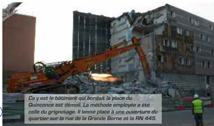
Ca y est le bâtiment qui bordait la place du Quinconce est démolie. La méthode employée a été celle du grignotage. Il laisse place à une ouverture du quartier sur la rue de la Grande Borne et la RN 445.

domaine d'activités est varié, fenêtres, huisseries, électricité, informatique, création textile, et surveillance. « L'intérêt est qu'elles se connaissent entre elles et que cela crée une dynamique ». Le nouvel hôtel a été conçu afin de minimiser les dépenses de fonctionnement. « Des solutions ont été recherchées en particulier dans sa conception avec des structures en bois, des coursives, le chauffage au bois, une réduction du coût de l'eau et de l'électricité, et d'une façon générale dans la simplicité d'utilisation et d'exploitation des différents éléments du bâtiment ». L'équipement, géré par la communauté d'agglomération, s'inscrit entièrement dans le Projet Urbain de la Grande Borne. Il a été financé par le Conseil Régional et le Conseil Général, l'ANRU, l'Europe (FEDER), le programme d'initiative communautaire Urban 2 et par le fond d'aide à l'investissement au titre de la politique de la ville.