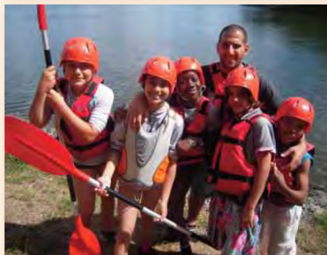
Les enfants de l'accueil de proximité Autruche ont fait du canoë cet été sur les lacs de Grigny.