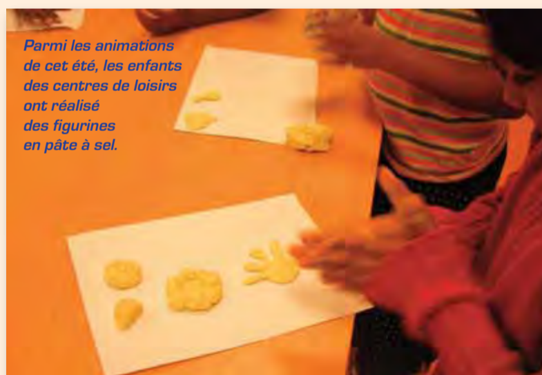
Parmi les animations de cet été, les enfants des centres de loisirs ont réalisé des figurines en pâte à sel.

177 enfants ont été accueillis dans les centres de loisirs pour les vacances de février et 197 enfants pour les vacances de printemps.