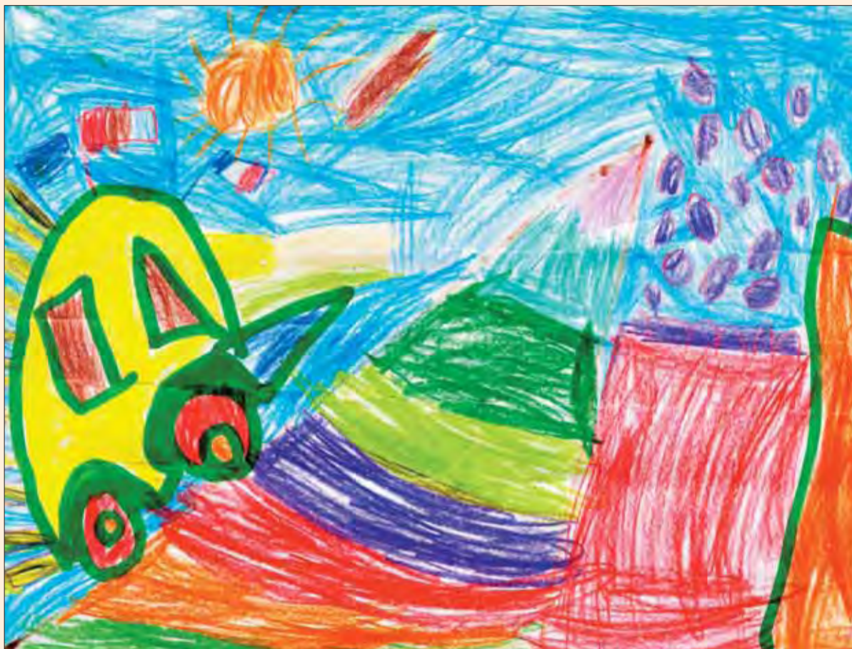
69 enfants étaient inscrits au centre de la Ribambelle cet été.