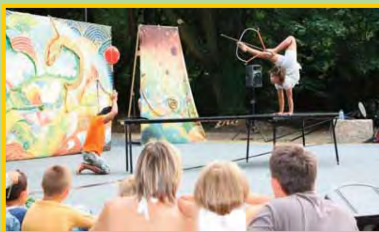
La compagnie «Phare Ponleu Selpak» a fait son spectacle (page 5)

FORUM DE RENTRÉE Avec les associations Grignoises.