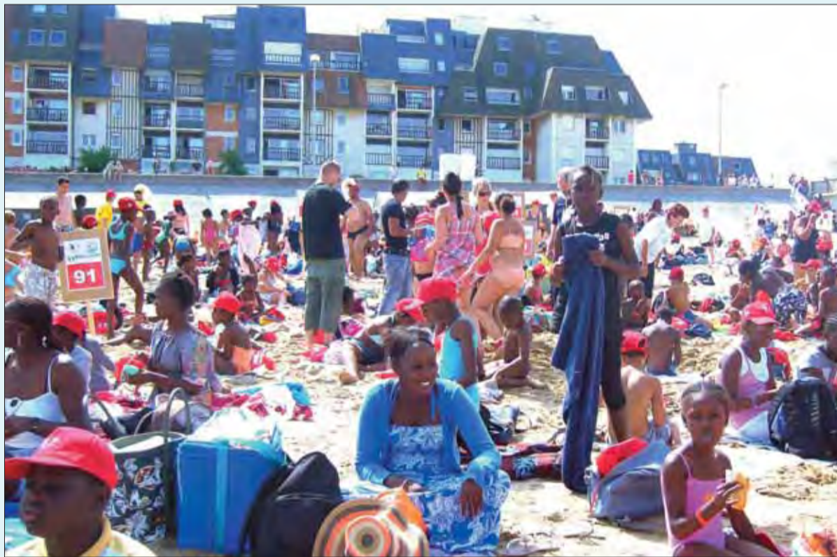
Il y avait du monde pour la sortie à la mer organisée par le Secours Populaire au mois d'août.