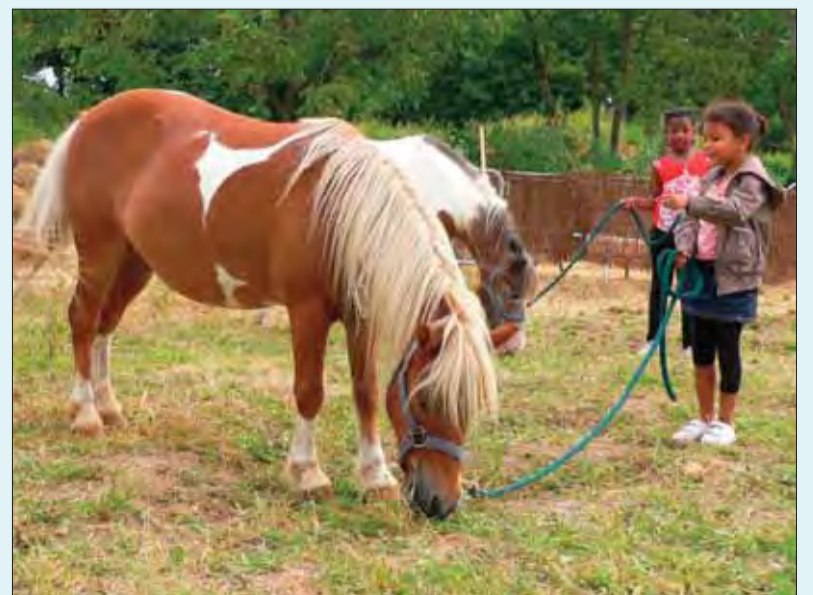
Comme prévu, les enfants ont pu s'exercer aux joies de l'équitation durant le mois d'août, avec au menu des tours de manège, promenade autour des lacs et spectacle ! Cette manifestation était organisée dans le cadre du plan «espoir banlieue» avec le concours de l'UCPA.