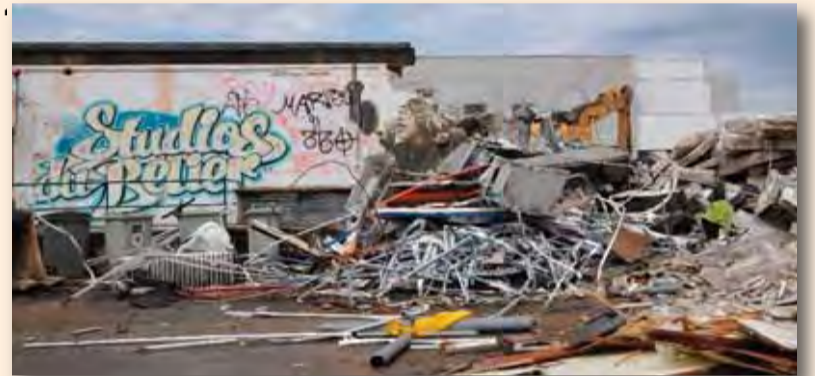
Les anciens studios du Bélier et le réfectoire ont été démolis fin juillet. Le studio d'enregistrement a réintégré les anciens locaux du Centaure.