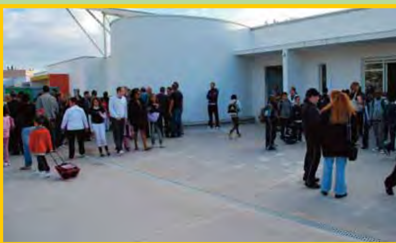
Les chiffres de la rentrée scolaire (page 3)

Les élections des parents d'élèves se dérouleront les 16 et 17 octobre