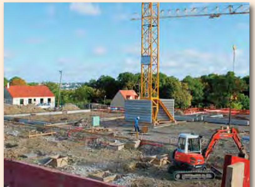
Le chantier du nouveau groupe scolaire Vlamincq a commencé.