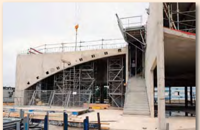
Le centre de vie sociale sort de terre. Le chantier avance.