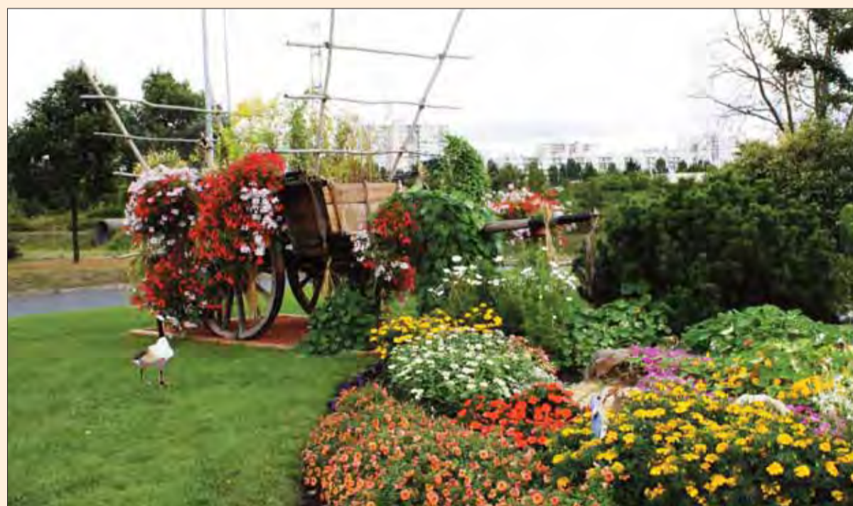
Les quatre coins de la ville ont été fleuris cet été dans les massifs des parcs, sur les lampadaires, aux ronds-points, sur les façades des bâtiments et dans les entrées des services publics.