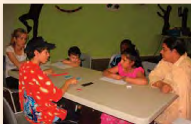
Les animations du mois d'août ont réuni les familles à la Maison de quartier Pablo Picasso.