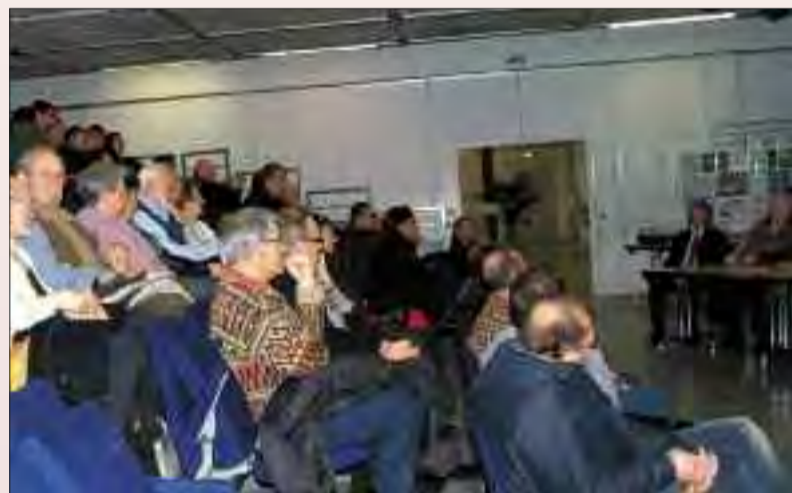
Des Grignois attentifs aux transformations.

Le programme commercial est accompagné d'un parc de stationnement de 1 500 places. Un cœur de ville battant au bon rythme, lieu d'échanges et de rencontres, attendu par les habitants des différents quartiers.