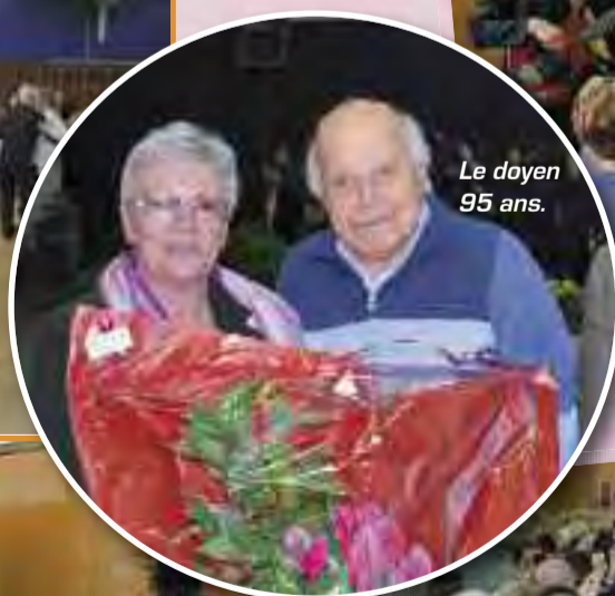
Le doyen 95 ans.