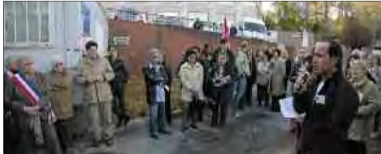
Un rassemblement contre les fermetures à l'hôpital de Juvisy.

Nous sommes confrontés aux problèmes rencontrés dans de nombreuses régions, liés aux diminutions de quotas universitaires des professionnels de santé.