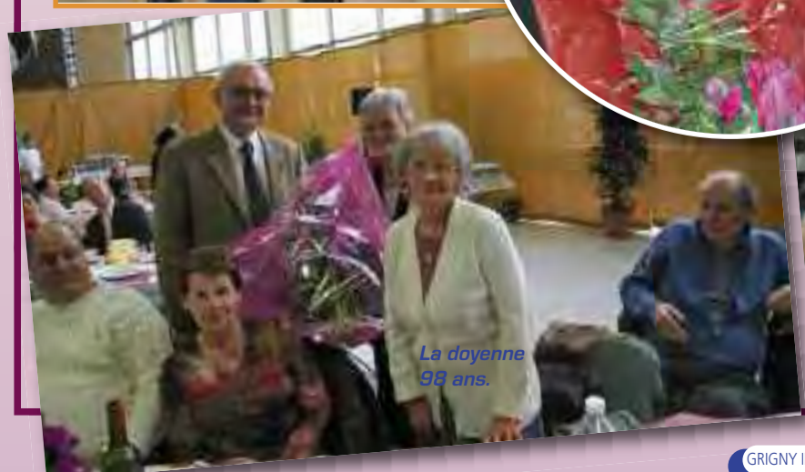
La doyenne 98 ans.