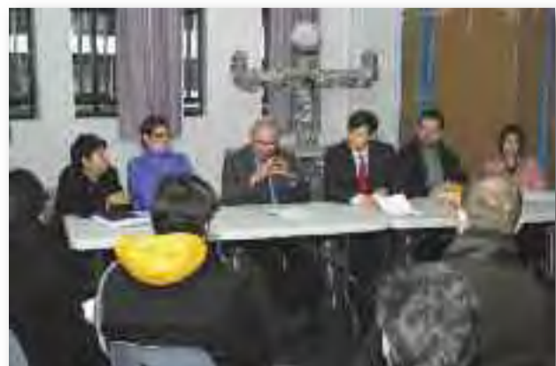
La mobilisation de tous les acteurs a accéléré le démarrage des travaux sur les ascenseurs.

En accompagnement de ces travaux, la mise à disposition par la FTRP, d'un logement en rez-de-chaussée qui permettra à la commune de soutenir les actions de proximité menées par les habitants et les associations du quartier. A cet effet, le Maire a souligné le rôle très important mené par les habitants qui se mobilisent sur leur quartier. Enfin, un dispositif particulier sur l'entretien sera mis en place avec le soutien financier de la Direction Interministérielle à la Ville (DIV). La réunion s'est poursuivie par une visite sur les lieux concernés par les travaux.