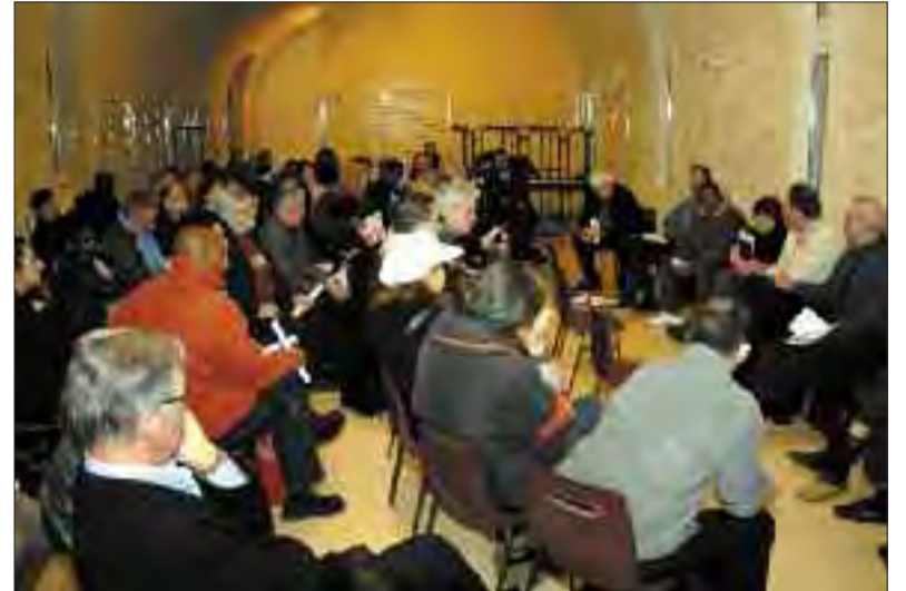
Réunion des acteurs locaux à la Ferme Neuve.

La délégation a également signalé aux pouvoirs publics les spécificités