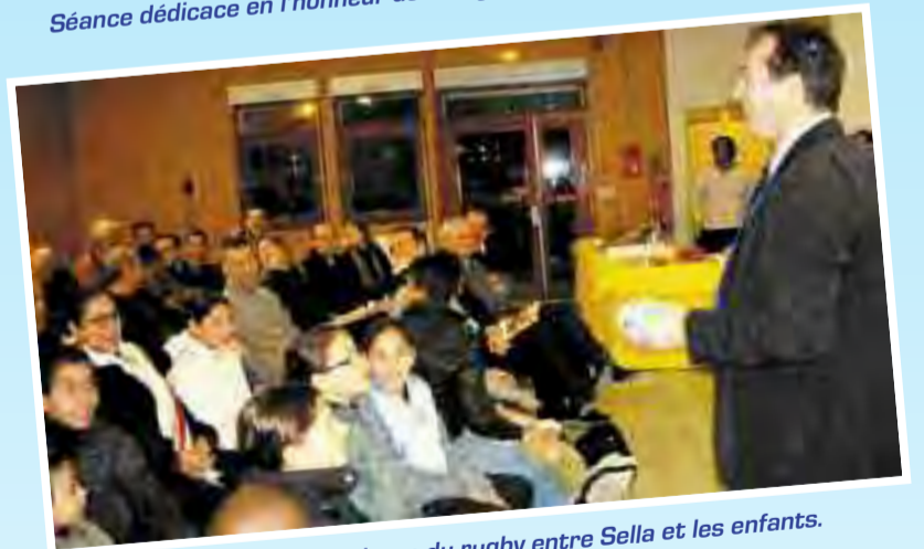
Moment de partage des valeurs du rugby entre Sella et les enfants.