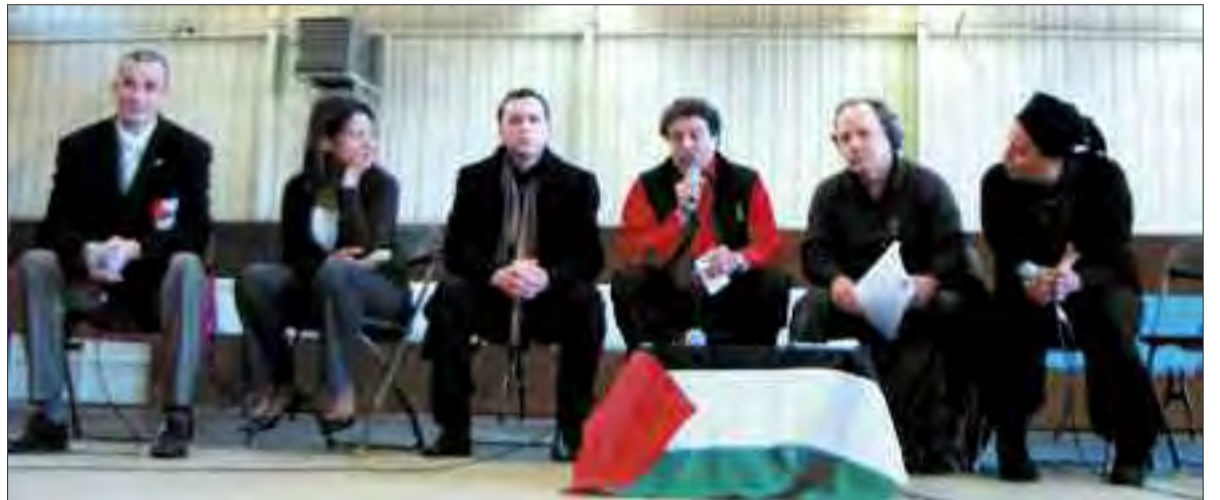
Débat en présence du président du MRAP et du représentant de l'UJFP. (2 e et 3 e à droite)

Les représentants du MRAP et de l'UJFP ont insisté pour leur part sur le fait que « ce conflit n'est ni religieux, ni communautaire, et qu'il doit au contraire nous unir, quelles que soient nos convictions ou nos origines, pour faire prévaloir le droit des Palestiniens à disposer d'un Etat viable. »