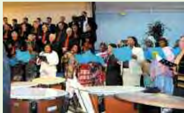
Le groupe vocal de la Grande Borne propose un premier CD pour le 18 février 2009.

Achetez-le en masse, car le produit de sa vente servira pour une œuvre sociale.