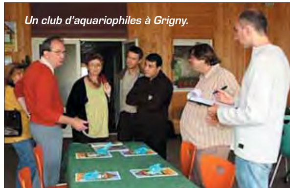
Un club d'aquariophiles à Grigny.