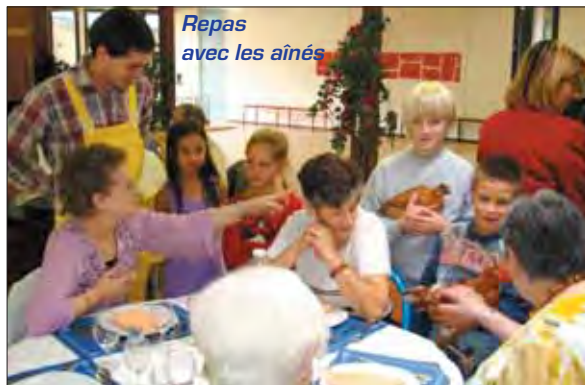
Repas avec les aînés

sions des lobbies phytosanitaires en abaissant les seuils européens de résidus chimiques dans les aliments, la MEN et l'association SoliCités, dans le cadre des ateliers du développement durable initiés par cette dernière, organiseront une conférence gratuite jeudi 2 octobre de 20h à 22h au Clotay sur le thème : « Savons-nous vraiment ce que nous mangeons ? ». L'occasion d'apprendre à décrypter les éti-