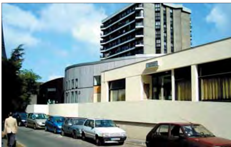
La maison de quartier Pablo Picasso agrandie et rénovée.