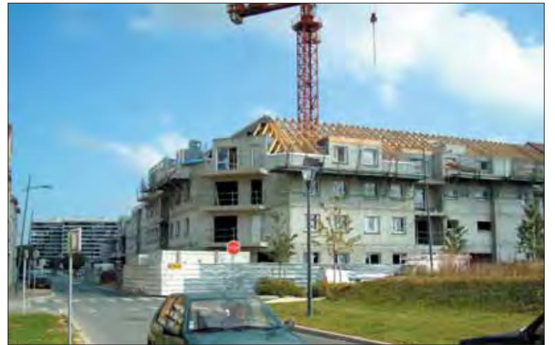
Le nouveau centre-ville ; ici, le programme de logements en accession à la propriété.