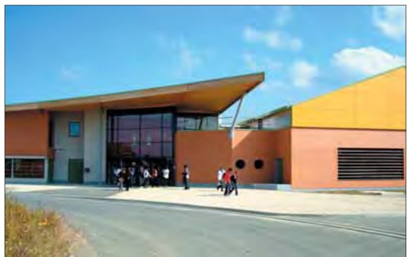
Le gymnase du centre-ville indispensable aux clubs et aux établissements scolaires.