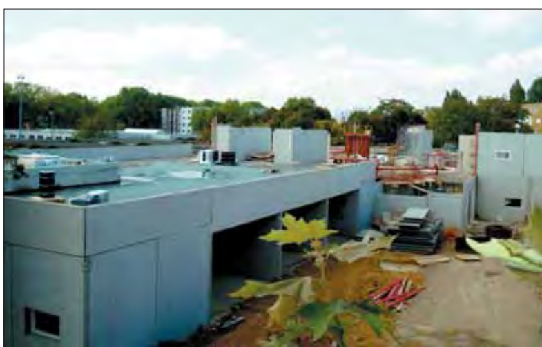
Le chantier du groupe scolaire Dédalos à la Grande Borne.