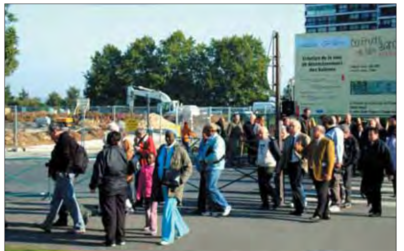
Devant le chantier de la voie de désenclavement des Sablons, aujourd'hui en cours de réalisation.