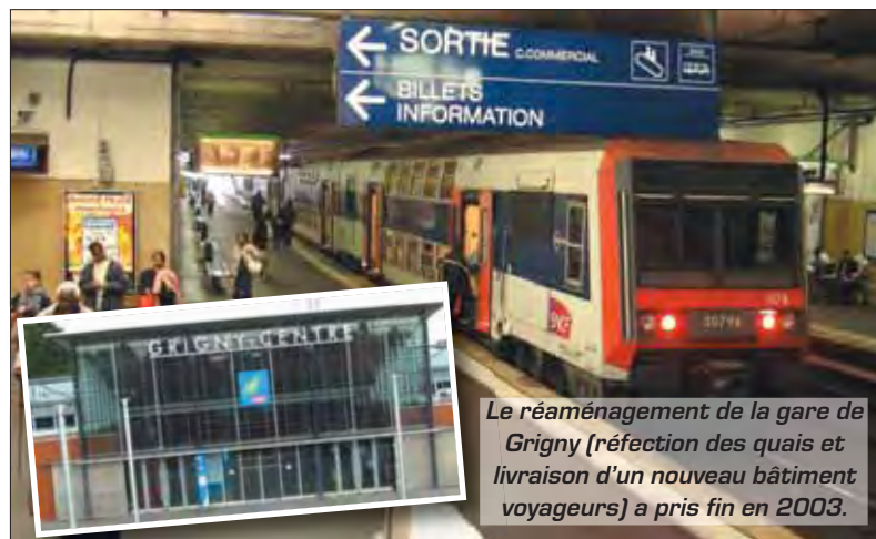
Le réaménagement de la gare de Grigny [réfection des quais et livraison d'un nouveau bâtiment voyageurs] a pris fin en 2003.

A Grigny, celui-ci inclut le réaménagement des quais de la gare SNCF afin notamment d'empêcher les traversées sauvages des voies. La ville, quant à elle, veut favoriser les interconnexions, profitant de l'avenant à la convention ANRU sur le secteur de Grigny 2 pour deman-