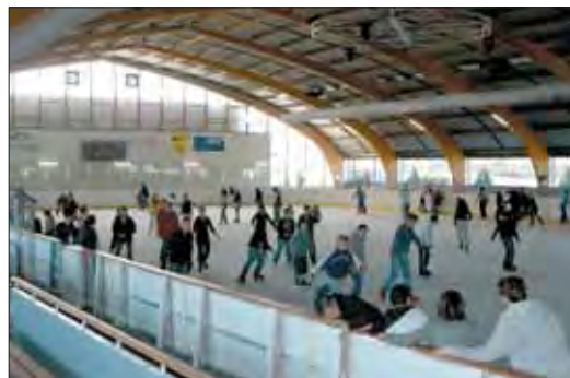
La patinoire propose des nocturnes jusqu'à 23h les vendredi et samedi ainsi que des soirées à thème.

3.60 euros pour le même public hors agglomération). Ou encore : 1 euro pour les jeunes et les titulaires du « Pass'Jeunes Patinoire » (contre 3.60 euros pour le même public hors agglomération) et 2 euros pour le forfait famille comprenant 1 adulte et un enfant (1 euro par personne supplémentaire de la même famille). Enfin, la patinoire propose également des abonnements intéressants et des tarifs groupes ainsi que des prestations inhérentes à l'activité (location de patins, affûtage) qui sont là aussi proposées à des tarifs réduits pour les habitants de Grigny ou Viry-Chatillon.