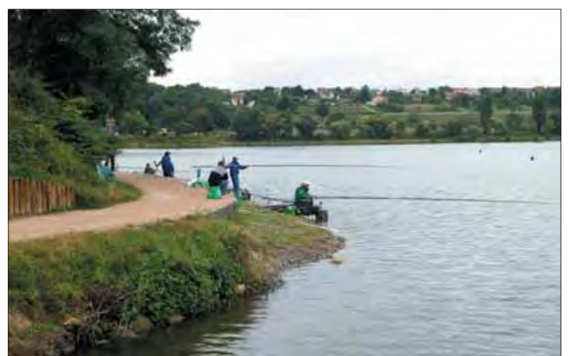
Les berges des lacs réaménagés, un "plus" pour notre cadre de vie.