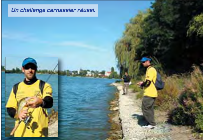
Un challenge carnassier réussi.