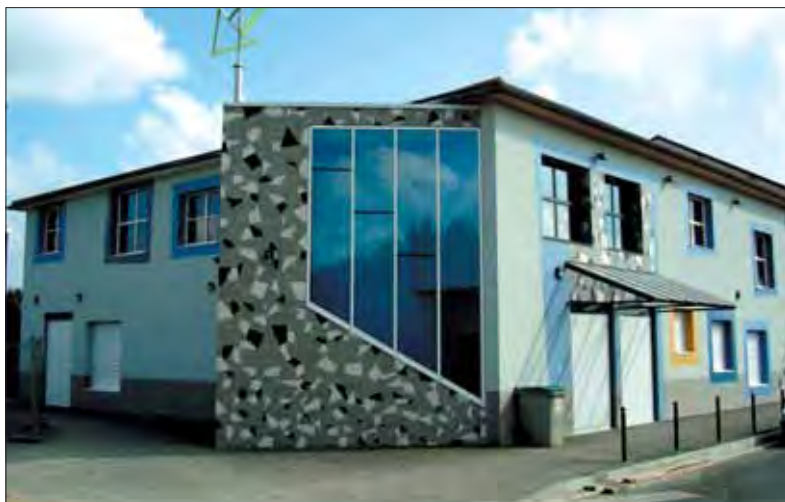
Le nouvel espace jeunes en centre-ville.