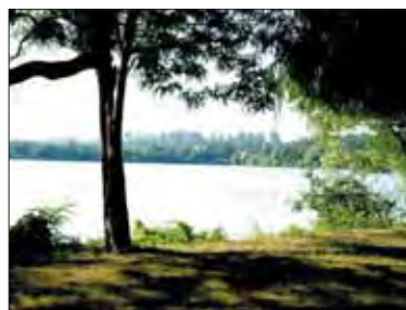
Des espaces naturels exceptionnels en zone urbaine.