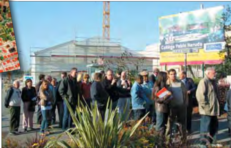
Visite du chantier de l'extension du collège Pablo Neruda.

La visite a pris fin à la maison de quartier des Tuileries ; des échanges avec les élus et les techniciens se sont poursuivis autour du verre de l'amitié.