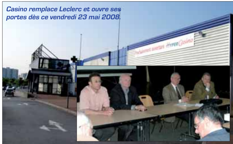
Casino remplace Leclerc et ouvre ses portes dès ce vendredi 23 mai 2008.

Le magasin va rouvrir ce vendredi 23 mai sous l'enseigne Casino qui garantit la continuité de l'offre commerciale et le maintien du personnel en place.