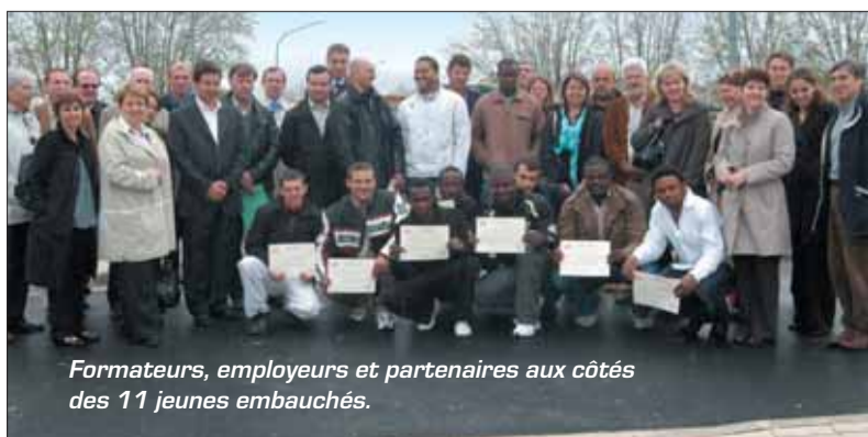
Formateurs, employeurs et partenaires aux côtés des 11 jeunes embauchés.

Ce chantier-école, le 3 e proposé par le STP et le CPO, pourrait, espèrent les responsables des deux organismes de formation, être renouvelé.