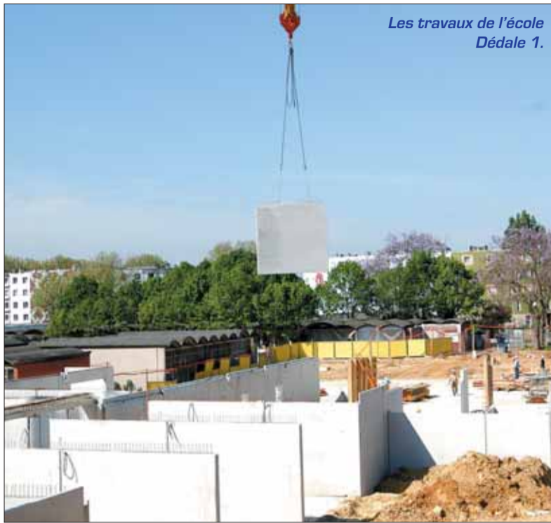
Les travaux de l'école Dédale 1.

Le nouveau groupe scolaire du Labyrinthe connaît lui aussi une avancée remarquable de son chantier. Ses 15 classes réparties entre une école maternelle et une école élémentaire seront prêtes pour la rentrée 2008.