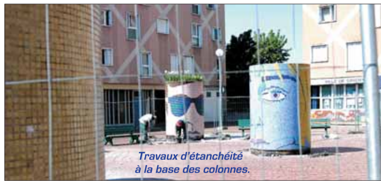
Travaux d'étanchéité à la base des colonnes.

Le chantier de restauration des dix colonnes en mosaïque, appelées par certains «boîtes à tabac», qui ornent la Place aux Herbes, a été récemment lancé. L'oeuvre artistique, désormais entourée d'une barrière de protection, subie actuellement des travaux d'étanchéité au niveau des socles des colonnes.