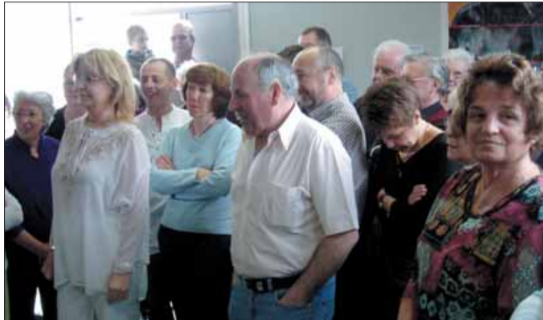
Les bénévoles des Restos de Grigny.

132900 repas ont ainsi été servis. Le Président a aussi remercié le Maire et la municipalité de Grigny pour leur présence, mais aussi pour l'aide technique et financière apportée chaque année (qui s'ajoute à celle de Viry-Chatillon et Ste Geneviève), permettant « d'assumer notre action dans les meilleures conditions possibles en perpétuant l'esprit Restos (...). Je souhaite continuer avec vous tous lors de la prochaine campagne ».