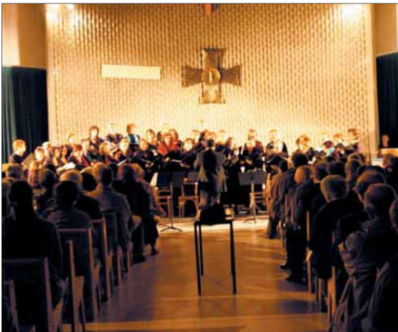
Un rendez-vous musical de grande qualité.

La musique classique attire toujours beaucoup de Grignois. Après le concert de l'orchestre de Massy à la Grande Borne initié par l'association Décider, cet engouement musical s'est confirmé à Grigny2, dimanche 6 avril, en l'église Notre Dame de Toute Joie à Grigny2.