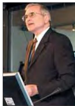
Michel Berson, président du Cg91.

Sur les 42 cantons du département, la gauche en administre désormais 25 (20 élus PS, 3 élus PC, 2 Divers Gauche) contre 17 pour l'opposition de droite (12 élus UMP et 5 élus Divers Droite).