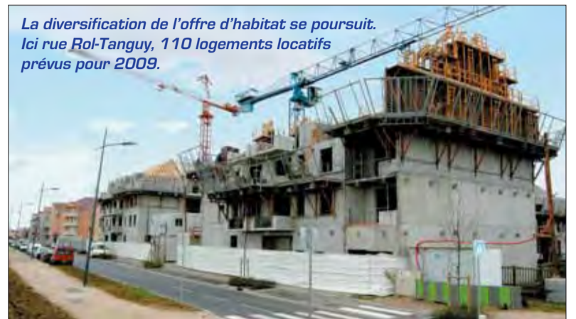
La diversification de l'offre d'habitat se poursuit. Ici rue Rol-Tanguy, 110 logements locatifs prévus pour 2009.

Au croisement de la rue Rol-Tanguy et de la rue des Jardins de la Ferme, ce sont 110 logements collectifs destinés à de la location qui vont sortir de terre d'ici janvier 2009, sous maîtrise d'ouvrage de l'AFTRP. Administrés par deux bailleurs, la Foncière Logement (76 logements) et l'Athégienne (34 logements), ces logements de type F2, F3 et F4 participeront à la diversification de l'offre locative sur la