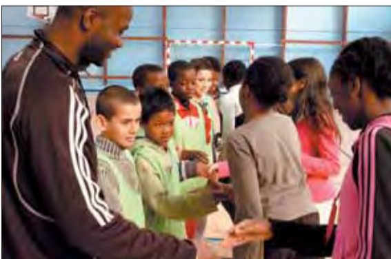
Epreuves de sélection du tournoi de football de la Fondation PSG au gymnase du Labyrinthe.

UNE centaine de jeunes nés entre 1995 et 1998 se sont mesurés le 5 mars dernier au gymnase du Labyrinthe, lors de la phase 1 du tournoi de football comptant pour la sélection de la Fondation du PSG. L'étape finale de sélection se déroulera durant les vacances de Pâques. Organisés en partenariat par le service municipal des sports, le service jeunesse et la Fondation du PSG, les différents matches permettront de