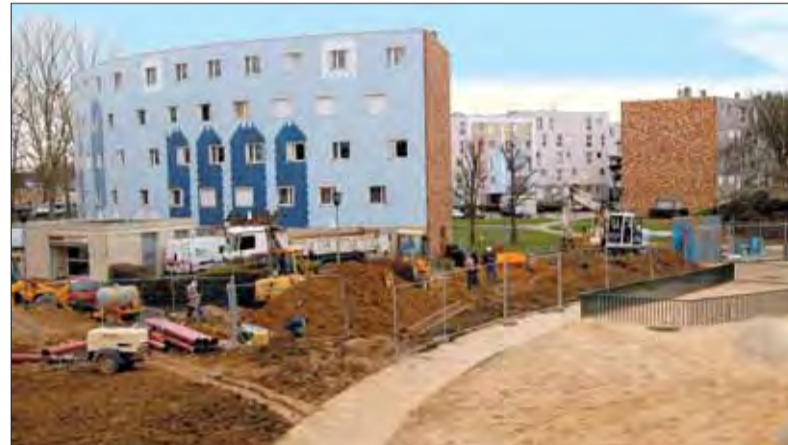
La Plaine des Radars sera remodelée après le chantier.

Le chantier de la rue du Ravin, d'une durée d'un mois, entraînera la fermeture momentanée de l'espace jeu mitoyen à l'immeuble N°10, pour raisons de sécurité. Il en va de même pour l'arrêt de bus