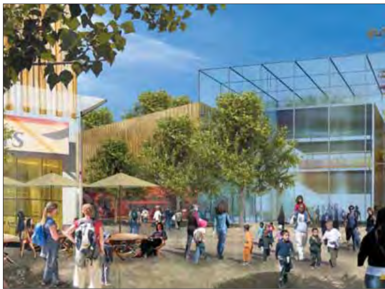
Le projet prévoit une place avec des commerces de proximité réalisée à côté de l'ancien centre commercial.

L'aménagement de la ZAC Centre ville est porté par la ville de Grigny avec le soutien de nombreux partenaires (ANRU, Conseil général, Conseil régional, AFTRP, Communauté d'Agglomération des Lacs de l'Essonne, CAF, bailleurs, aménageurs...).