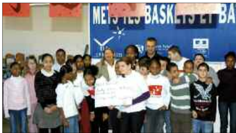
Photo des collégiens en compagnie du rugbyman Yan Delaigue et de Mme Blondeau, représentante d'ELA.

L'ex-international de rugby Yan Delaigue a pour sa part mis l'accent sur les valeurs qui « ani-