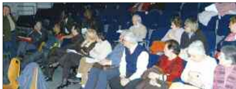
Un véritable projet urbain pour Grigny2 est réfléchi. Autant de sujets qui ont été présentés et débattus lors d'une réunion tenue jeudi 20 février au Centre Culturel Sidney-Bechet, à l'initiative du Maire et du Président du Conseil syndical principal de la copropriété.

immobilier en échange d'un conventionnement de leur loyer. Ceci permettra une meilleure maîtrise du peuplement et une connaissance affinée de la réalité du marché locatif sur la ville, tout en offrant aux propriétaires plus de sécurité, une valorisation de leur patrimoine et des réductions d'impôts.