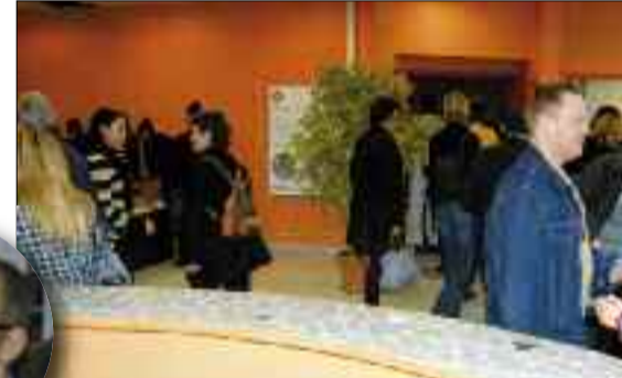
Un hall d'entrée accueillant et spacieux pour discuter, se rencontrer, se « poser » tout simplement...

tiques connectés à Internet, une cuisine professionnelle, un ascenseur handicapés, un bar...), des activités sportives (dances contemporaine, danses du monde, danses urbaines, babyfoot, billard), artistiques (espace cuisine, Musique Assistée par Ordinateur, théâtre, spectacles divers) et des ateliers pédagogiques (espace informatique, atelier d'écriture, permanences de la Mission Locale, du PIJ