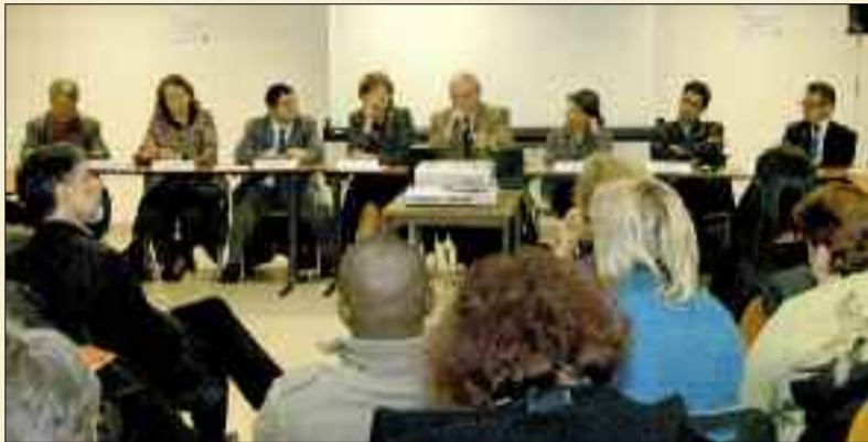
Signature de la charte d'insertion : avec les maires de Grigny et Viry-Chatillon, le Président de la communauté d'agglomération, le Président du PLIE nord-Essonne, des représentants de l'Opievoy et de l'AFTRP.

La signature par 17 partenaires* d'une Charte locale d'insertion, le 19 février 2008 au Centre de formation et de professionnalisation (CFP) de la Grande Borne, vient confirmer la priorité accordée à l'emploi par Grigny et Viry-Chatillon, qui s'illustre par un chiffre éloquent : les deux villes cumulent 23% des emplois créés en Essonne.