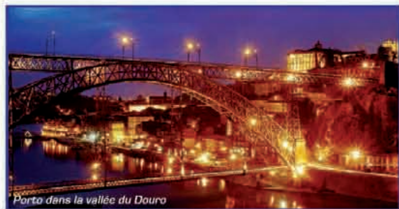
Porto dans la vallée du Douro

Matinée du 3 e jour, excursion à Vila Real et aux jardins de Solar de Mateus. Retour sur le bateau vers Pinhao et continuation de la croisière vers Barca d'Alva. Le lendemain départ en car pour la visite de Salamanque, Ville