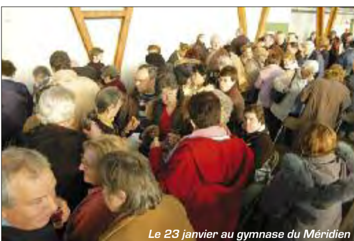
Le 23 janvier au gymnase du Méridien

Le 16 janvier au Centre culturel Sidney-Bechet, le 23 janvier au gymnase du Méridien et le 30 janvier au nouveau gymnase du Centre ville, le service municipal des retraités et le CCAS avaient convié les personnes âgées des différents quartiers de la ville à une rencontre amicale en présence notamment du Maire et de Mme Eté, première adjointe chargée des personnes âgées. Le Maire a présenté ses vœux « de bonheur et de santé pour 2008 » avant de laisser Madame Eté détailler le calendrier des nombreux séjours et activités qui seront proposés en 2008 aux personnes âgées. L'après-midi s'est achevé, autour d'un pot de l'amitié et d'un cadeau offert par la Municipalité.