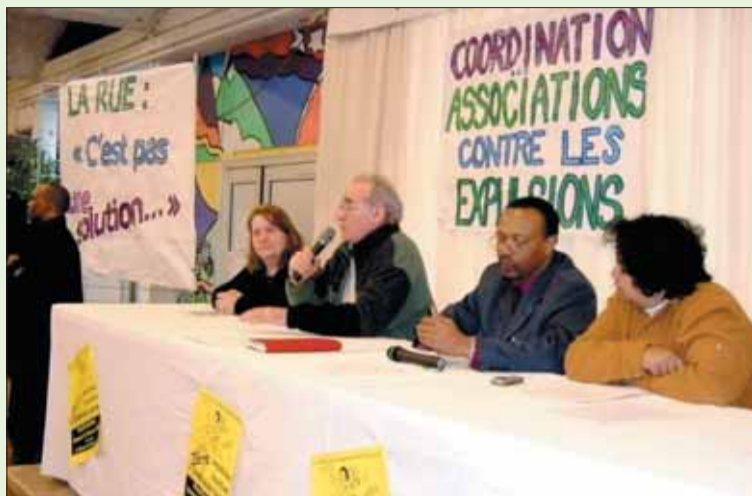
Image du précédent rassemblement anti-expulsions tenu à l'école du Renne le 24 février 2007.

Samedi 27 octobre à 16h au Centre de formation et de professionnalisation, rue du Minotaure à la Grande Borne.