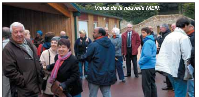
Visite de la nouvelle MEN.

CHANTIER bientôt achevé de l'Espace jeunes en centre ville, réhabilitation de l'école de la Licorne, chantier des groupes scolaires Dédale1 et 2, renouveau du gymnase du Labyrinthe avec sa nouvelle salle de sports, nouvelle Maison des enfants et de la nature (MEN), aménagement du parc de la Maison de la Dame, etc : les participants ont été fortement impressionnés par les avancées du projet de Ville.