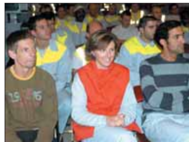
Les trois salariés de Coca-Cola membres du jury.