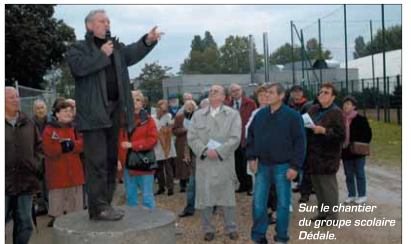
Sur le chantier du groupe scolaire Dédale.

Chaque année à la fin septembre, le Maire et le conseil municipal invitent les acteurs locaux de Grigny à prendre connaissance des réalisations et des chantiers en cours à travers la ville. Le 29 septembre, ils ont pu ainsi découvrir les chantiers en cours et les avancées du projet de ville.