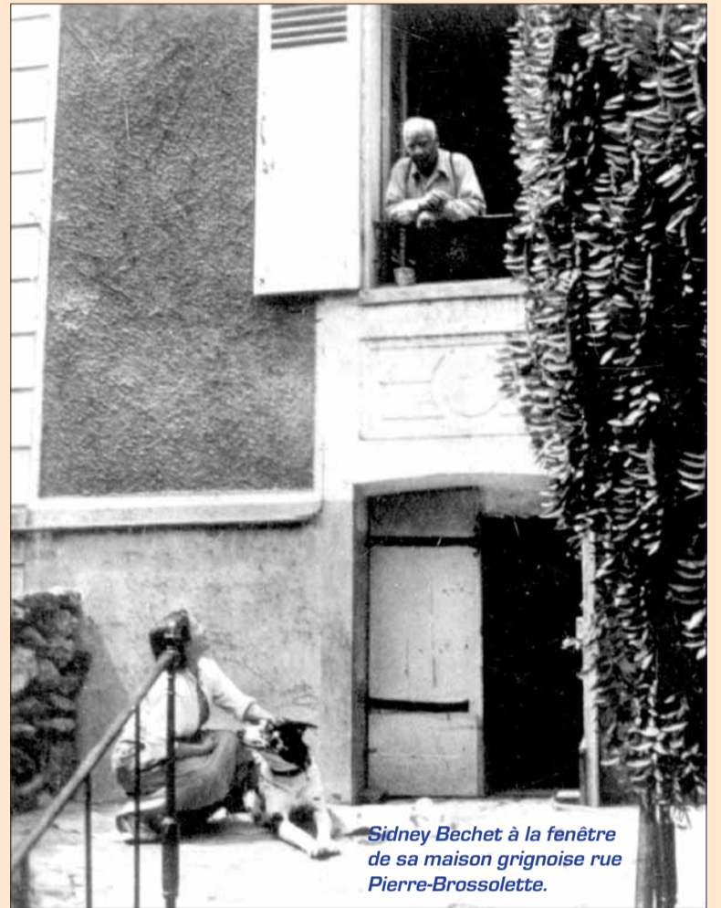
Sidney Bechet à la fenêtre de sa maison grignoise rue Pierre-Brossolette.

Sidney Bechet s'éteindra le 14 mai 1959, jour de son 62 e anniversaire. En hommage à l'illustre musicien, Grigny a donné son nom au Centre culturel municipal.