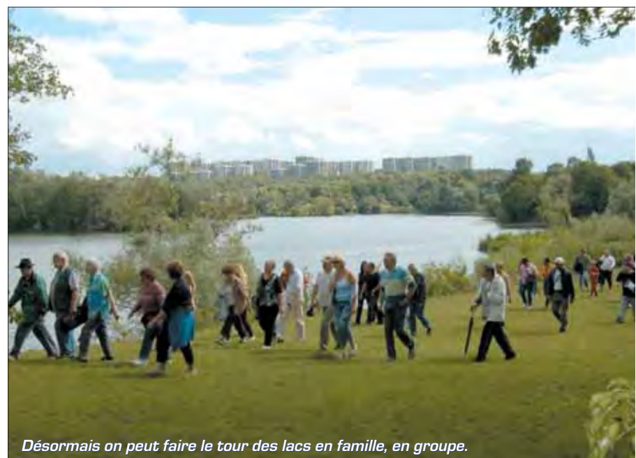
Désormais on peut faire le tour des lacs en famille, en groupe.

Samedi 30 : Licorne (9h-12h), Buffle (14h-15h), Gabriel-Péri (11h30-15h30), Tilleuls (11h30-15h30), Angela-Davis (10h-13h30).