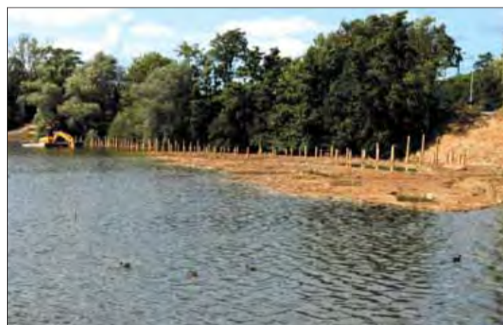
Au fond, l'emplacement d'une passerelle en bois bientôt en service.

Renseignements : LPO : 06 81 41 59 07 - rodolphe.lelasseux@wanadoo.fr