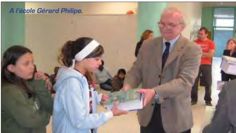
A l'école Gérard-Philippe.