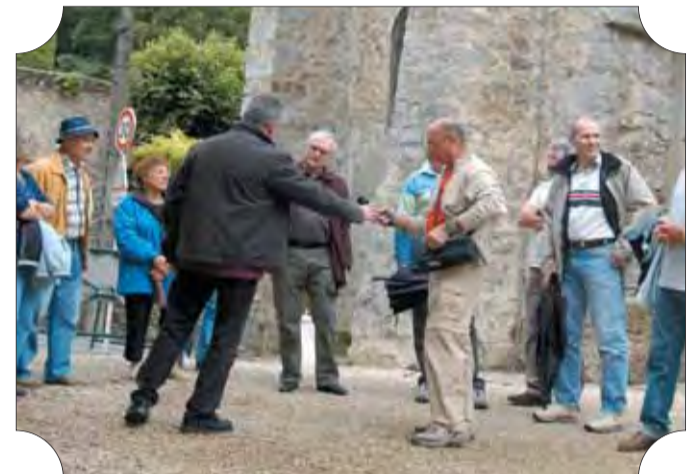
► Devant l'église du Village, qui sera réhabilitée.