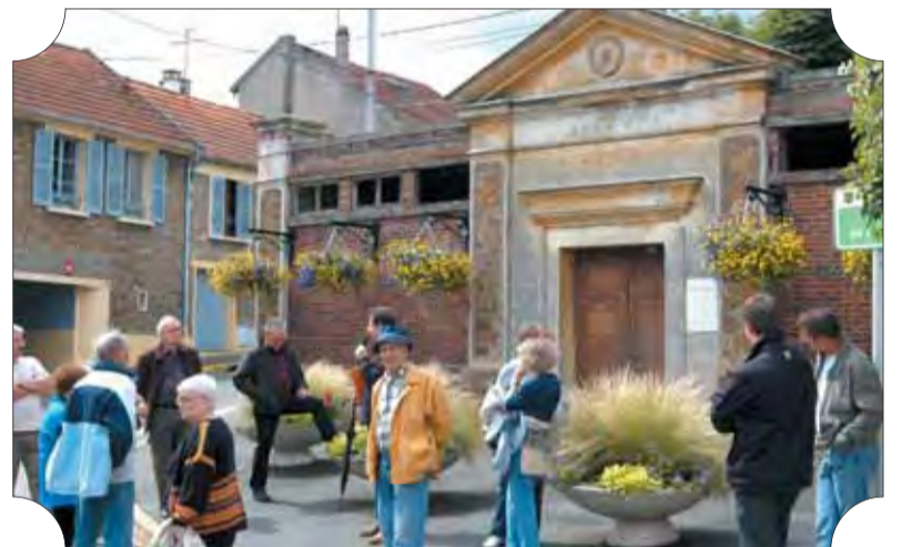
► Devant le lavoir qui sera restauré.