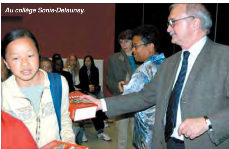
Au collège Sonia-Delaunay.