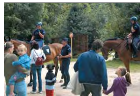
Environnement oblige, la police est... équestre.