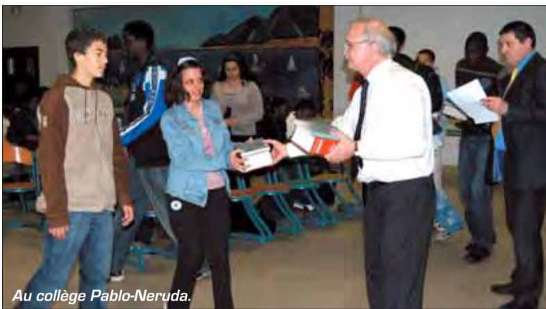
Au collège Pablo-Neruda.