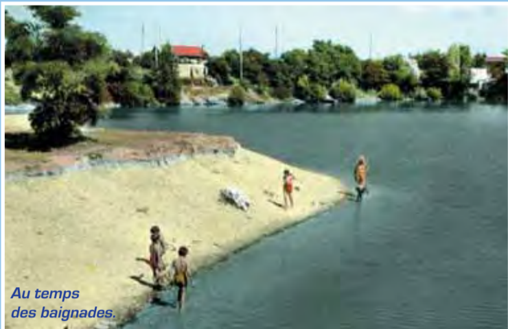
Au temps des baignades.