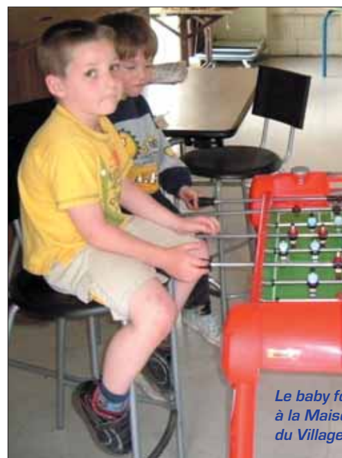
Le baby foot à la Maison du Village

L'art gastronomique a également fait partie du programme. Les participants se sont ainsi transformés en apprentis «chefs cuisiniers» pour titiller les bases culinaires. Ce jour-là, ils se sont attaqués aux secrets de la fabrication du pain. Une dégustation a bien sûr été proposée à la fin de l'atelier... Un moment de partage entre parents et enfants.