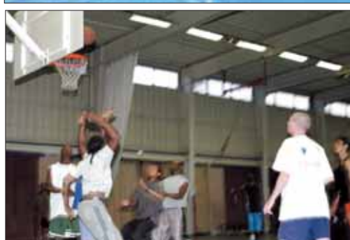
Le basket-ball est une discipline sportive qui a attiré une flopée de jeunes dans la salle Jean-Louis-Henry. Des animateurs du service des sports les accompagnaient, y compris en prenant part aux matches.