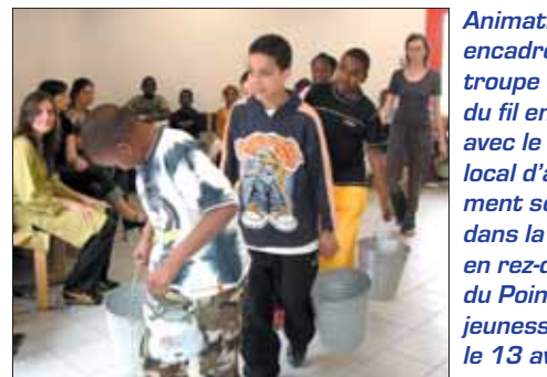
Animat... encadre... troupe... du fil en... avec le... local d'... ment se... dans la... en rez-c... du Poin... jeunesse... le 13 av