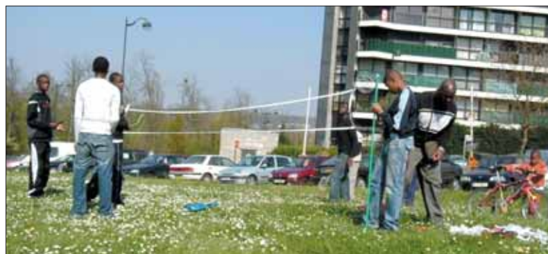
Badminton à la demande pour les jeunes de l'espace Vlaminc à Grigny 2.

Tous ces travaux ont été livrés avant le début des vacances de Pâques, «permettant ainsi aux jeunes, nous dit Abbas, animateur, d'utiliser la grande salle polyvalente et s'adonner aux différentes activités proposées dans de meilleures conditions d'accueil. Les jeunes de la structure remercient d'ailleurs les agents techniques de la ville pour la qualité du travail réalisé. Chapeau !»