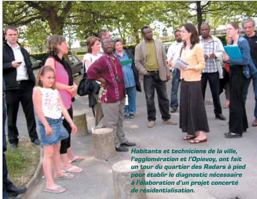
Habitants et techniciens de la ville, l'agglomération et l'Opievoy, ont fait un tour du quartier des Radars à pied pour établir le diagnostic nécessaire à l'élaboration d'un projet concerté de résidentialisation.

dés lors de sa précédente rencontre et la visite du quartier du 5 mars. Le lendemain 24 avril, lors d'une visite à pied des Radars le groupe de travail a établi un diagnostic et réfléchi aux premières propositions qui devront conduire à un projet.