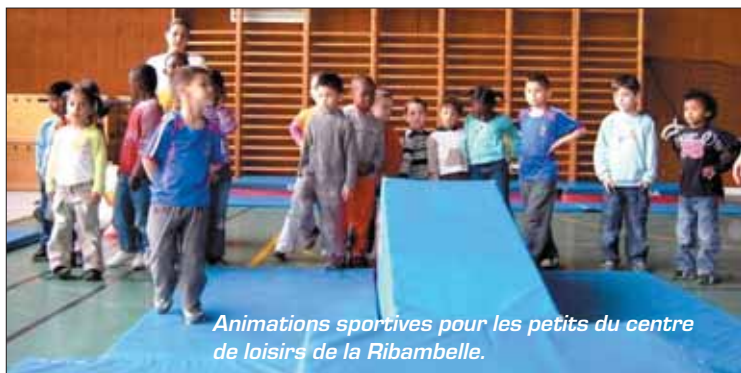
Animations sportives pour les petits du centre de loisirs de la Ribambelle.