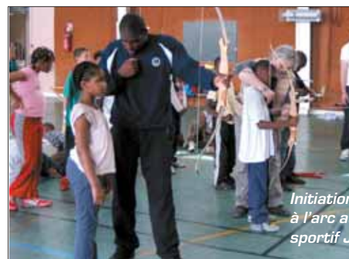
Initiation à l'arc à sportif