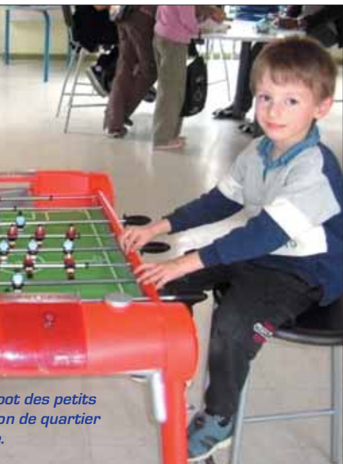
...ot des petits ...on de quartier