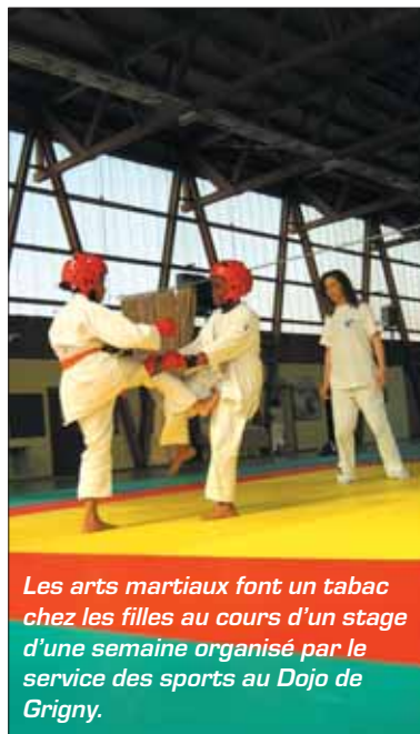
Les arts martiaux font un tabac chez les filles au cours d'un stage d'une semaine organisé par le service des sports au Dojo de Grigny.