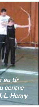
... au tir ...u centre ...L.-Henry