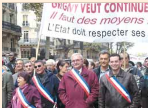
... En novembre 2006, ils participaient à une manifestation nationale d'élus et de citoyens dans les rues de Paris..