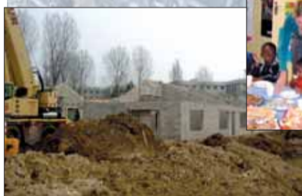
Maison de quartier des Tuileries en construction.

La CRC estime « qu'il est impossible de résorber le déficit sur le seul exercice 2006 ; que le plan de redressement est donc prolongé » (...) « Pour le reste, les dépenses contenues dans le projet de budget élaboré par le maire bénéficiant de subventionnements, il convient par conséquent de les maintenir ».