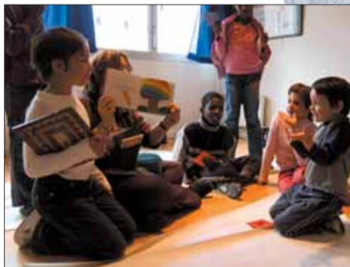
Lecture à la bibliothèque.

(...) Dans ces conditions, il apparaît que, sur la période considérée, la commune a effectué un effort grâce aux économies de gestion réalisées, conformément