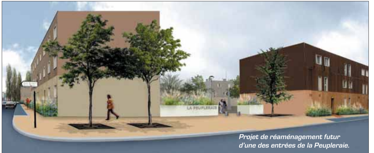
Projet de réaménagement futur d'une des entrées de la Peupleraie.

Le grand ensemble de la Grande Borne n'est pas homogène et monotone comme beaucoup d'autres ; il est composé de nombreux quartiers qui ont chacun leur forme urbaine et leur personnalité. S'appuyer sur ces particularités pour améliorer l'environnement de chaque quartier, tel est l'objet de la démarche de résidentialisation.