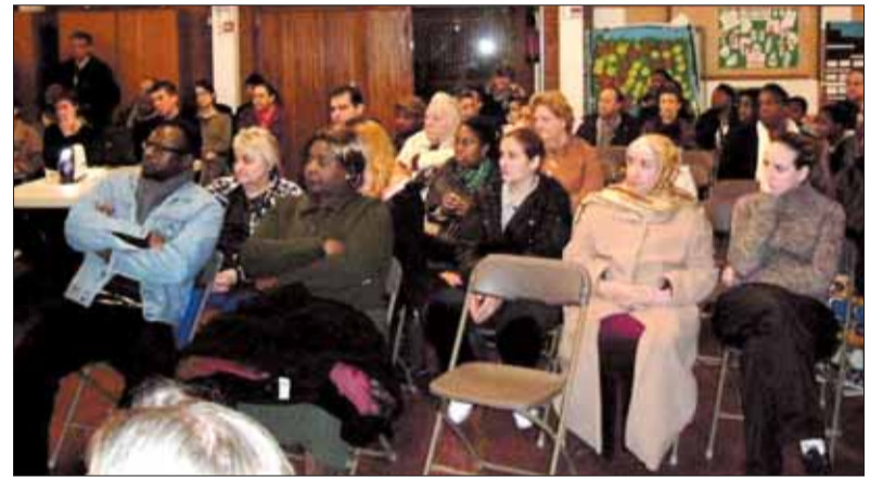
La concertation se poursuit. Ici aux Radars le 22 février.

Au final, selon les responsables de l'Opievoy, «1500 logements bénéficieront de la résidentialisation dont les travaux s'étaleront sur 5 à 6 ans.» Cette démarche a pour ambition affichée de personnaliser