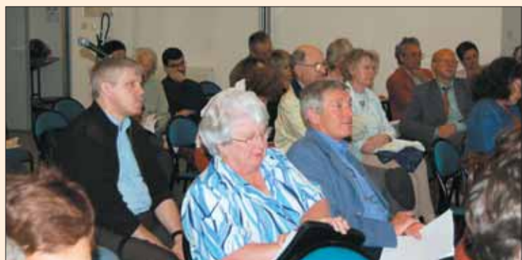
A Fleury-Mérogis en mai 2006, des élus et habitants de Grigny participent, avec d'autres élus de l'Essonne, à un débat sur la nécessité d'une loi pour réformer en profondeur les finances locales...

La situation que connaît Grigny n'est donc pas un cas isolé. Quand le conseil municipal unanime demande au Préfet qu'un travail soit effectué pour parvenir à un équilibre durable du budget communal, cette revendication renvoie directement au débat national.