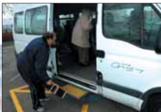
Transport des retraités et personnes à mobilité réduite