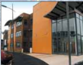
Centre de formation et de professionnalisation.