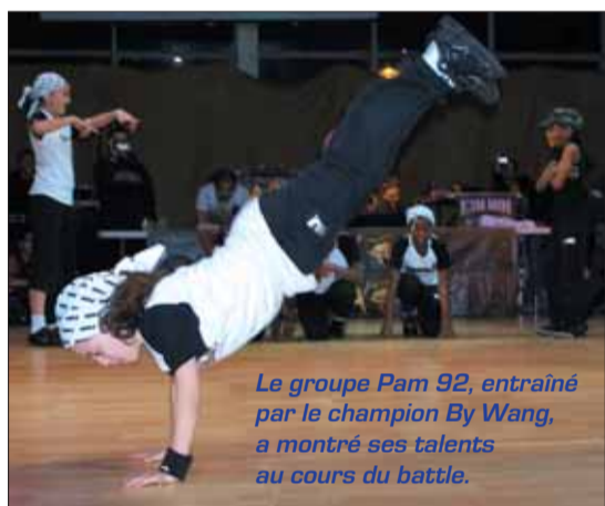
Le groupe Pam 92, entraîné par le champion By Wang, a montré ses talents au cours du battle.