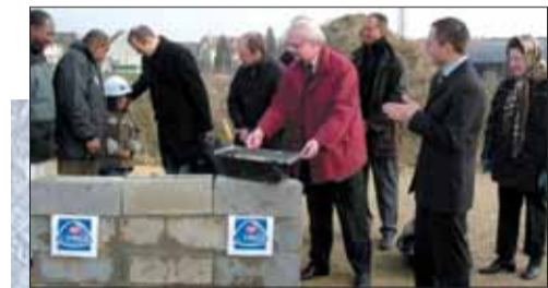
Pose de la première pierre du gymnase au centre ville.