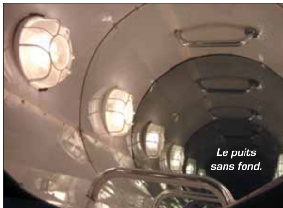
Le puits sans fond.