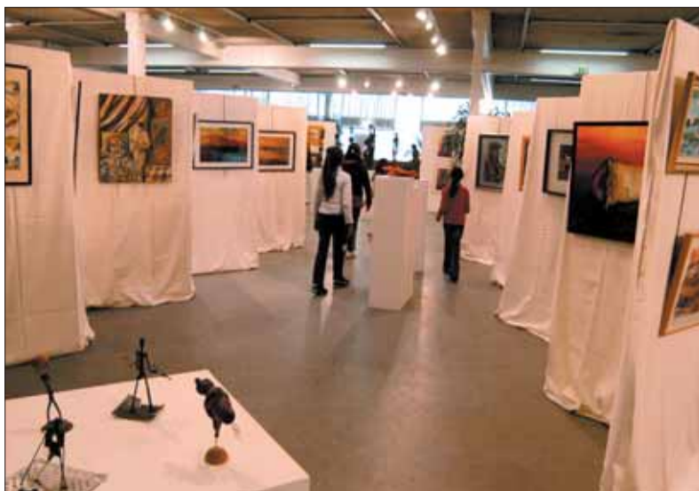
Le salon des Arts plastiques, une manifestation riche de talents.