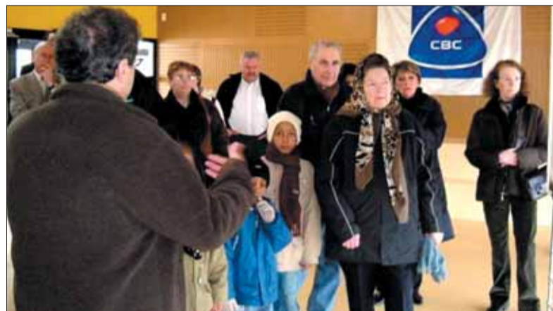
L'architecte expose aux riverains les aménagements du chantier.