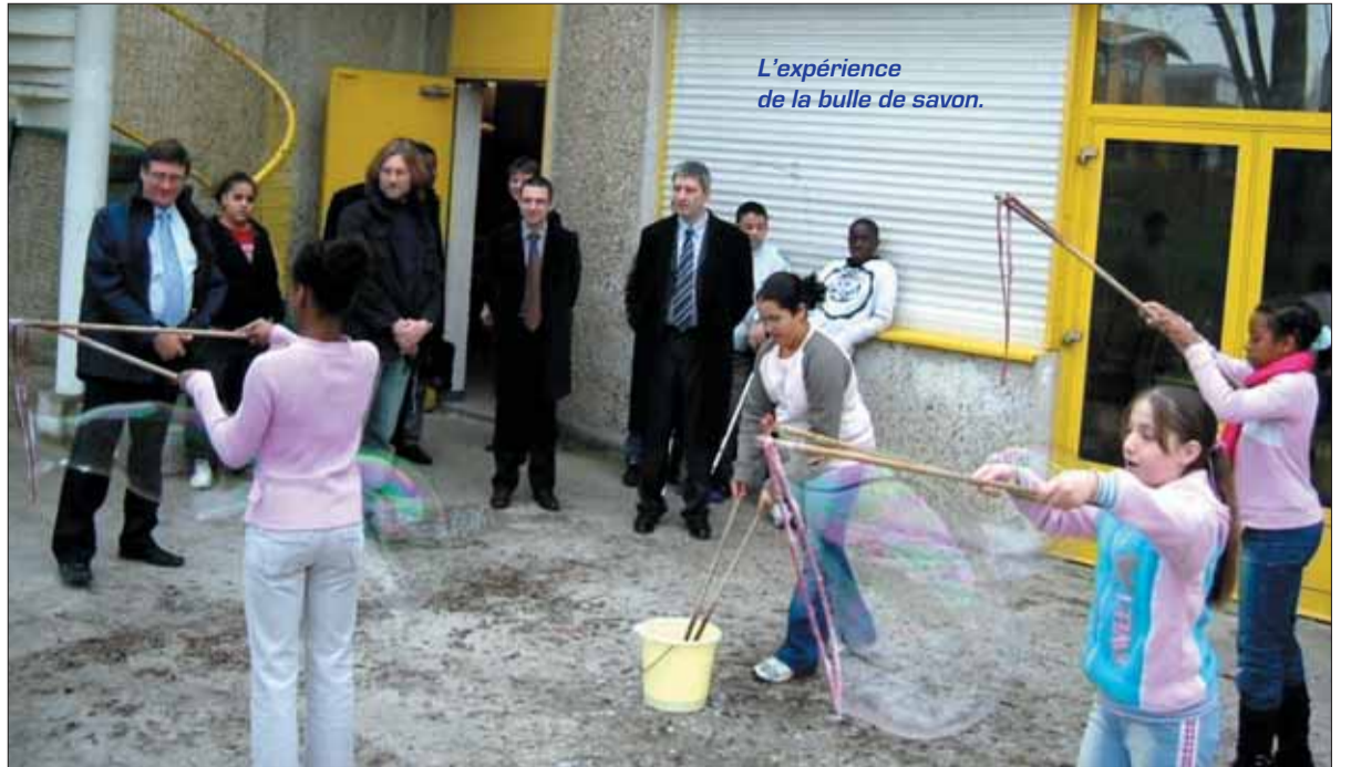
L'expérience de la bulle de savon.