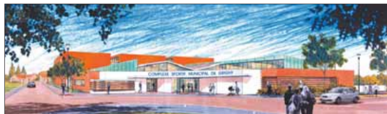
La maquette architecturale du futur gymnase.

Ce nouvel équipement sportif grignois, destiné aux clubs et aux élèves des collèges, est conçu en modules autonomes qui facilitent une utilisation indépendante du dojo, des salles de sports, etc. Par ailleurs, la bâtisse sera conforme