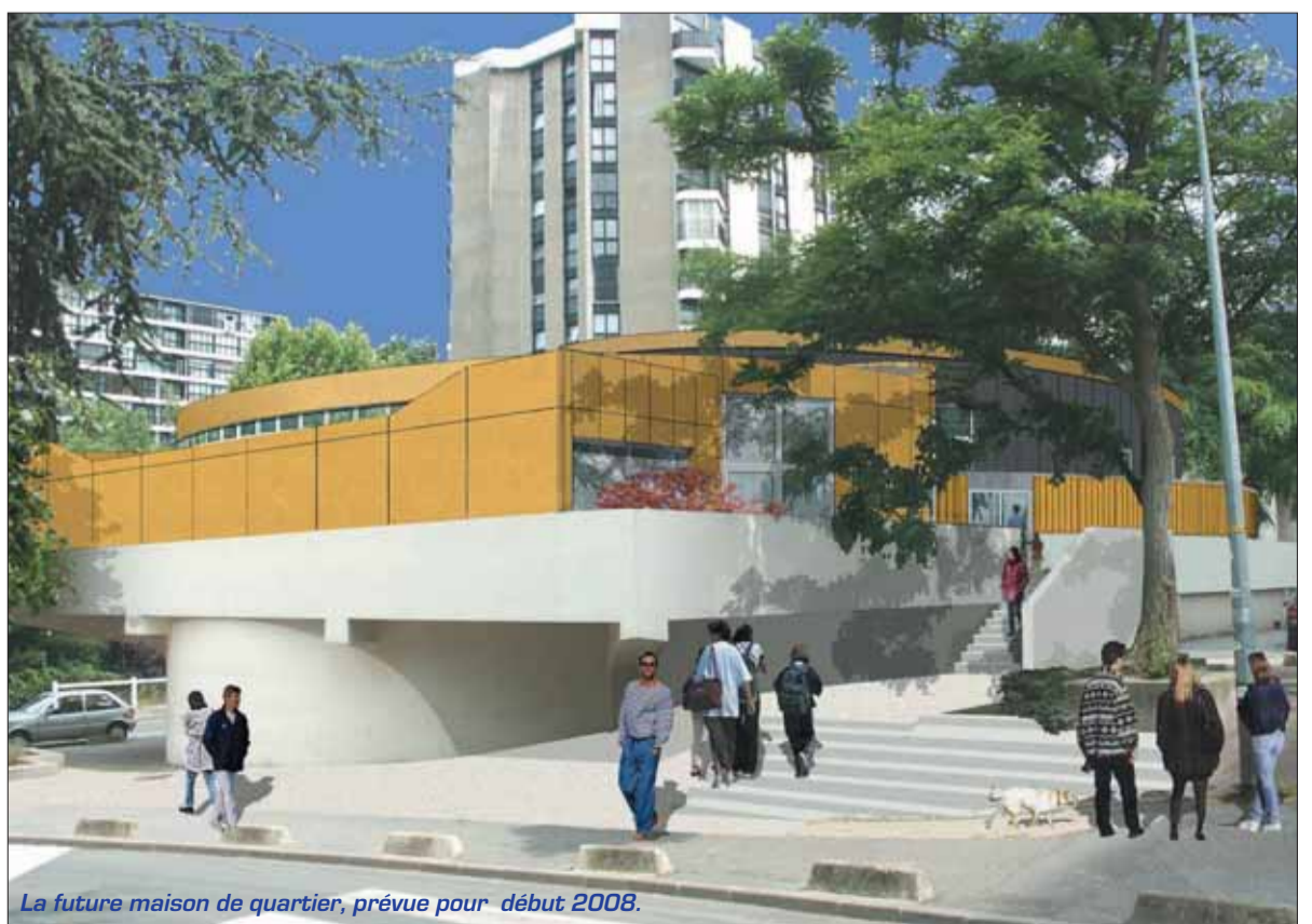
La future maison de quartier, prévue pour début 2008.

L es travaux de rénovation et d'agrandissement de la Maison de quartier Pablo-Picasso débutent en ce mois de février. Les désagréments naturels à tout chantier, ont été réduits au minimum pour ne pas trop incommoder les riverains : la circulation ne sera fermée, de février à décembre 2007, que dans le segment du rond-point de l'église, mitoyen à l'esplanade Picasso sur laquelle sera édifiée la nouvelle bibliothèque du quartier. De nouveaux locaux plus spacieux, plus fonctionnels et plus adaptés à vos besoins seront à votre disposition pour début 2008.