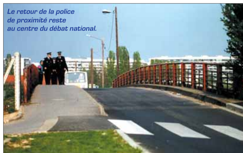
Le retour de la police de proximité reste au centre du débat national.