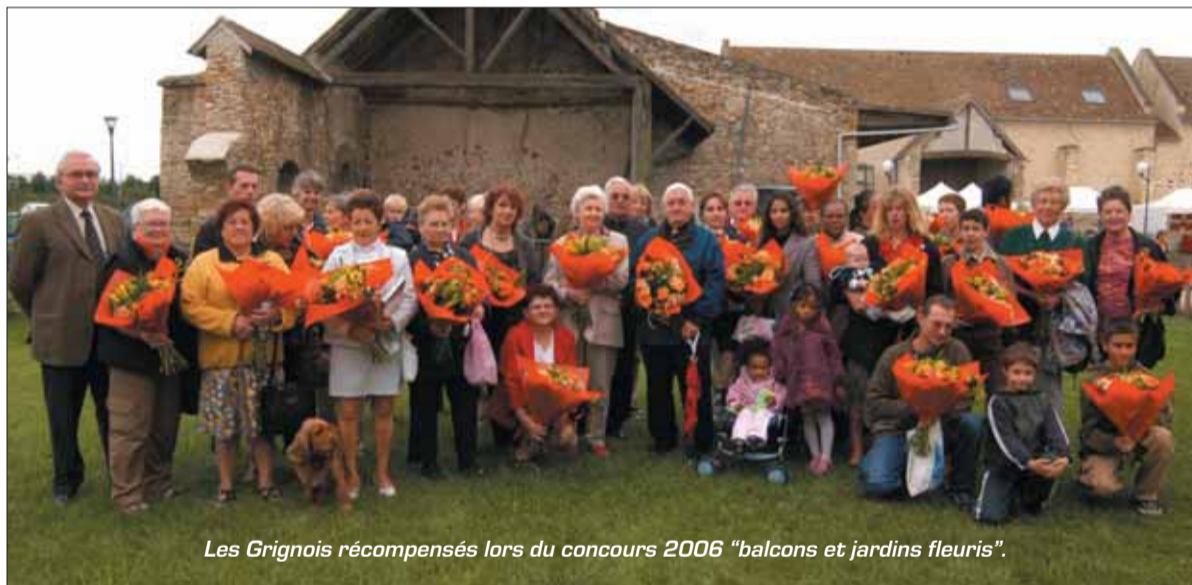
Les Grignois récompensés lors du concours 2006 "balcons et jardins fleuris".

«Ma ville en fleurs» est une opération initiée par la municipalité, qui incite les habitants à procéder