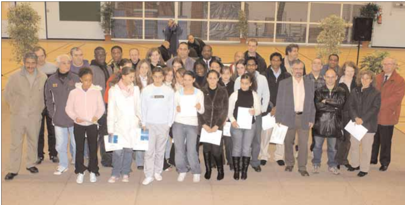
Sportifs et dirigeants de clubs pour une belle photo souvenir.

Vendredi 8 décembre, dans le gymnase du Labyrinthe totalement rénové, le maire, la municipalité et les responsables des associations sportives de Grigny ont présenté au public le programme d'équipements sportifs réalisés, en cours ou à venir, avant de mettre à l'honneur des équipes, un dirigeant et des sportifs qui se sont distingués au cours de la saison 2005-2006.