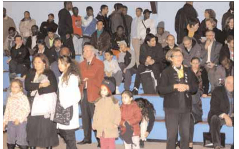
Une salle attentive lors de la présentation du programme d'équipements sportifs.

dont certains commenceront dès 2007. (Lire Grigny Infos précédent n°274).