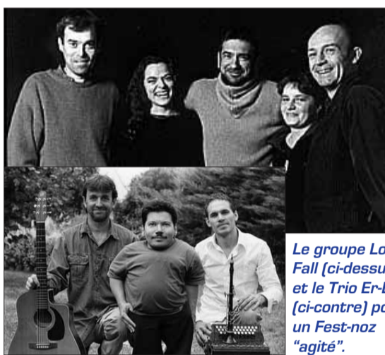
Le groupe Loened Fall (ci-dessus) et le Trio Er-Bag (ci-contre) pour un Fest-noz "agité".

Tarifs : tout public : 9 euros ; étudiants, chômeurs, - de 16 ans : 6 euros