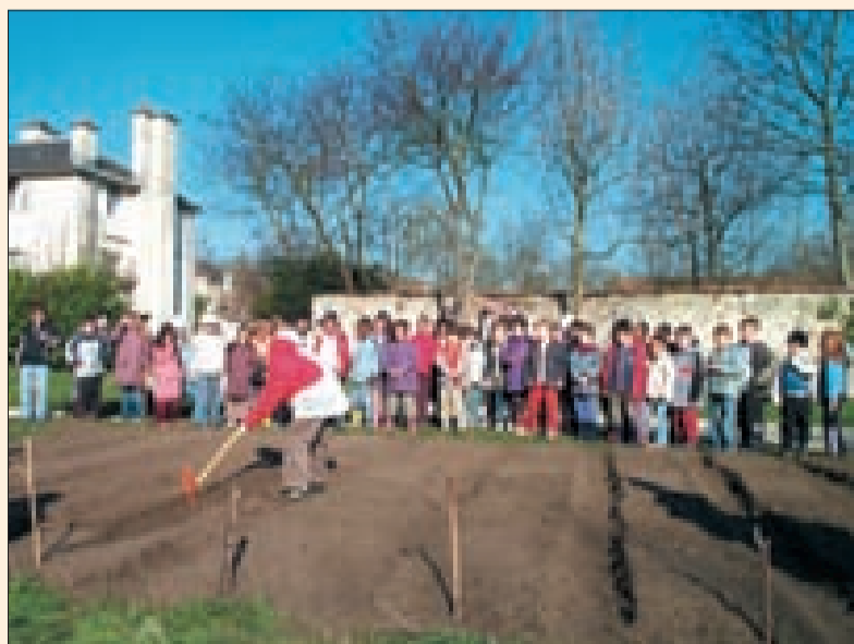
Travaux pratiques pour les élèves de Gabriel Péri.

tage du projet Eco-école. M. Atig, directeur de l'école, s'est félicité de cette distinction qui récompense « une action éducative entamée depuis des années avec nos élèves de C.P., autour des plantes et du jardinage. Un travail dans lequel s'étaient engagés les enseignants et les élèves, avec l'appui du Maire. »