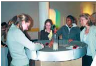
L'atelier des gyroscopes.

Un évènement pré sélectionné pour le concours national Faites de la science, réalisé avec le soutien du Conseil général de l'Essonne et le Réseau d'Education Prioritaire de Grigny, en partenariat avec la Cité des sciences de La Villette, et la participation de l'association grignoise Décider.