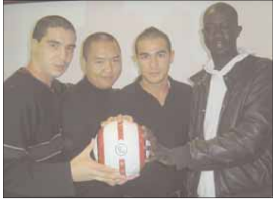
Les sélectionnés grignois pour la coupe du monde dans les Maisons de quartiers.

On les savait fous de foot, mais là, ils dépassent les bornes, puisqu'ils sont engagés dans la coupe du monde ! Comment ? Simplement en diffusant les matchs dans les Maisons municipales de quartiers, sur écran de rétroprojecteur et de postes télé.