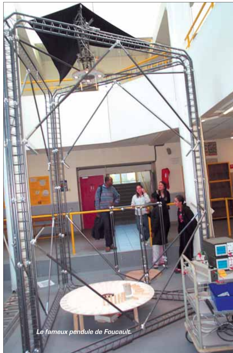
Le fameux pendule de Foucault.

ments de l'électricité, trouver les mots justes : «Il y a chez elles une soif d'apprendre, une curiosité, une volonté de communiquer. Elles trouvent l'école qu'elles n'ont pu avoir», concluait-elle.