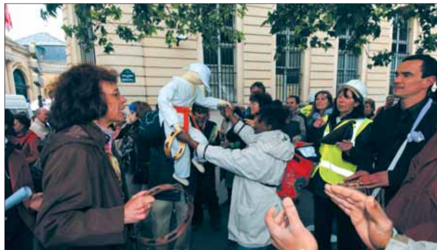
Tandis que la délégation de Grigny est reçue durant plus de deux heures par des hauts fonctionnaires du Ministère de la Ville, dans la rue, les manifestants grignois attendent, déterminés mais dans la bonne humeur.