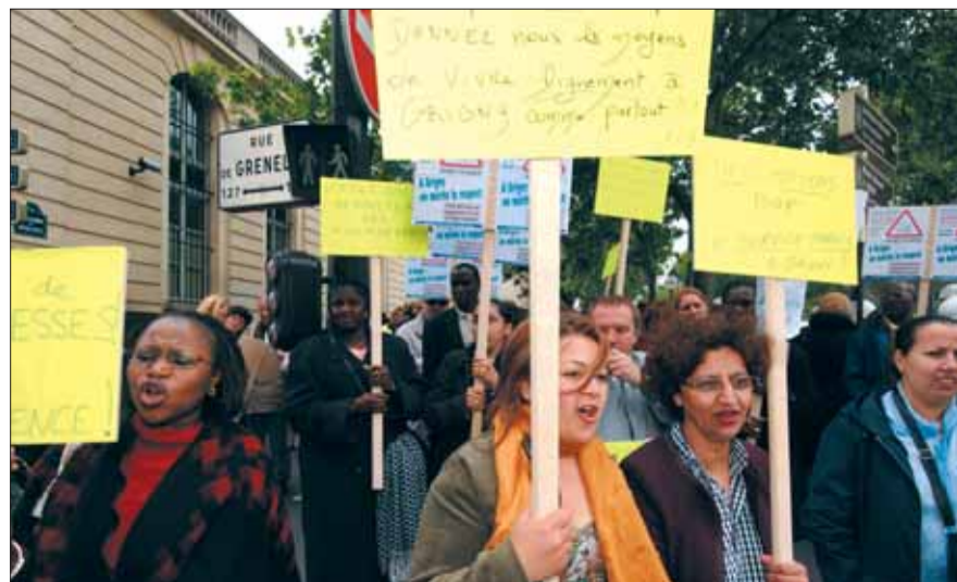
Parents d'élèves, dirigeants associatifs, personnels communaux, ils et elles étaient dans la rue mercredi 31 mai devant le Ministère de la Ville pour exiger des moyens pour Grigny.