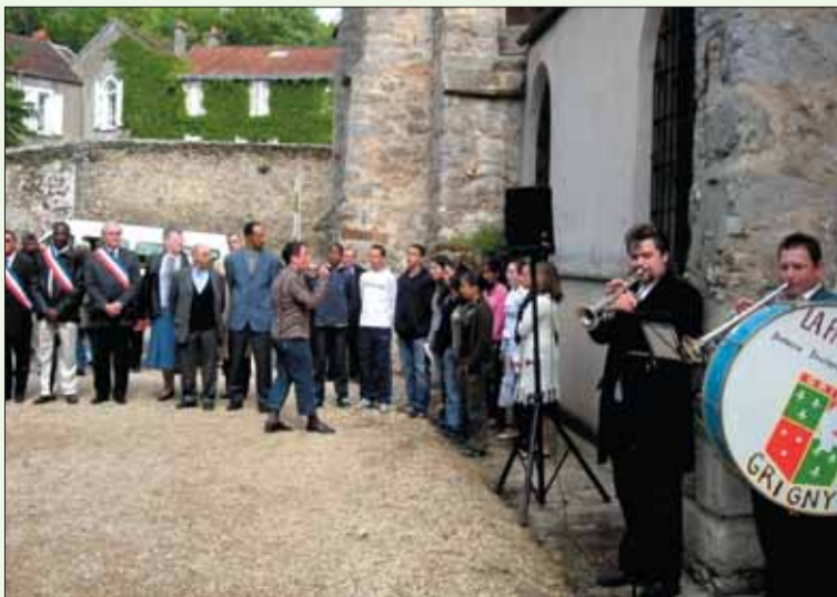
La Marseillaise et le Chant des Partisans par les collégiens accompagnés par les musiciens de «La Fauvette».

La fanfare de la «Fauvette» a, comme d'habitude, assuré avec brio l'accompagnement musical de la commémoration. L'interprétation de la Marseillaise et du Chant des partisans par les élèves de la 4 e 2 du collège Sonia-Delaunay a été très appréciée par les participants.