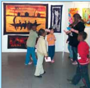
Une visite d'enfants de maternelle avant le vote.

Sculpture et tableaux sont décrochés, on attend la 4 e édition de ce salon original, que l'Association pour le développement des arts plastiques à Grigny prépare, afin de nous concocter en 2007 un