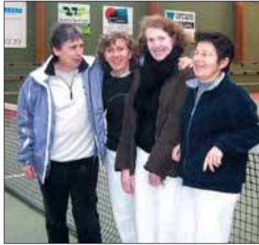
Les championnes grignois.

Les femmes de l'équipe de l'USG tennis de plus de 45 ans, vont de succès en succès. On connaît leur parcours remarquable de championnes de l'Essonne pour la 6 e année consécutive. On apprendait en mars qu'elles étaient allées jusqu'en quart de finale du championnat de France, un niveau jamais atteint auparavant par une équipe de tennis de Grigny. Leur ascension a été stoppée le 19 mars, par les joueuses du Tennis