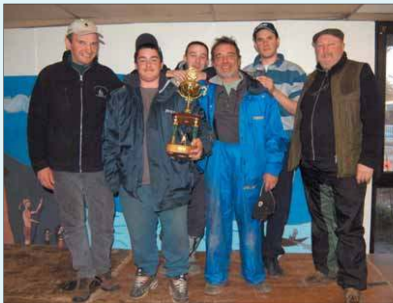
Les lauréats du concours de pêche organisé sur le lac de Grigny, les 18 et 19 mars, par le Team Dreveil Sensas91.

Enlèvement des véhicules destinés à la destruction