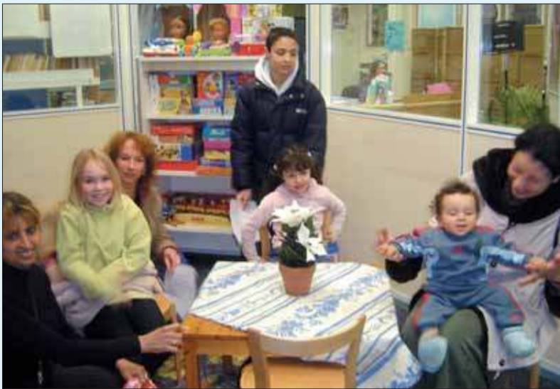
La Maison de quartier Pablo-Picasso a ouvert sa ludothèque en mars dernier. Parents et enfants pourront emprunter des jeux dès le mois d'avril. Renseignements à la Maison de quartier rue des sablons. Tél. 01 69 06 42 57