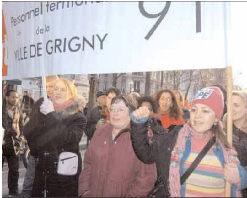
Des Grignois dans les manifestations contre l'extension de la précarité, pour le retrait du CPE.

DES habitants, des employés municipaux en grève et des élus de Grigny étaient présents à la manifestation du 18 mars (notre photo). Le précédent Grigny informations publiait une déclaration de la majorité municipale, qui soulignait notamment : «l'actualité d'aujourd'hui, c'est le refus des jeunes et l'avis négatif exprimé par une majorité de l'opinion publique. Et considérant que le Code du travail et vise en fait à court et à moyen terme l'ensemble des salariés, le maire et le conseil municipal exigeaient que le gouvernement retire le CPE». Dans les rues des villes de France, des centaines de milliers d'hommes et de femmes de toutes générations ont crié leur colère face à cet assaut de précarité. La municipalité de Grigny est aux côtés des jeunes qui défendent leur droit à un réel avenir.