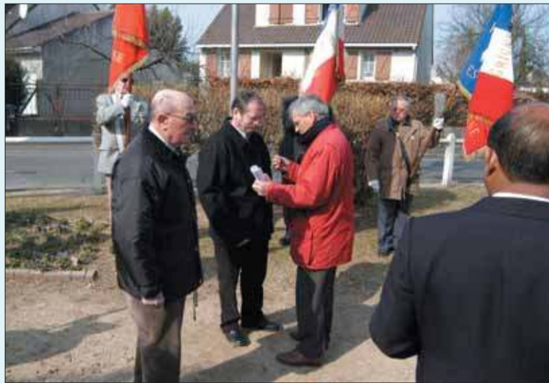
Le 19 mars, les anciens combattants, ont commémoré avec la municipalité le 44 e anniversaire de la fin de la guerre d'Algérie. Sur notre photo, le président de l'ULAC remet une médaille à un ancien combattant.