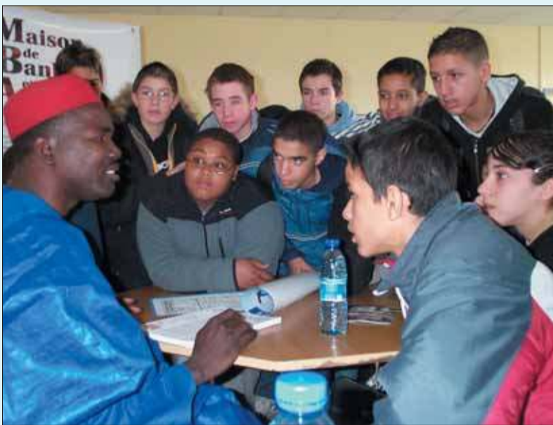
La Mipop organisait une matinée des métiers d'arts, en direction des lycéens et collégiens. Ici, les jeunes attentifs à la magie des mots du conteur nigérian Sani Bouda.