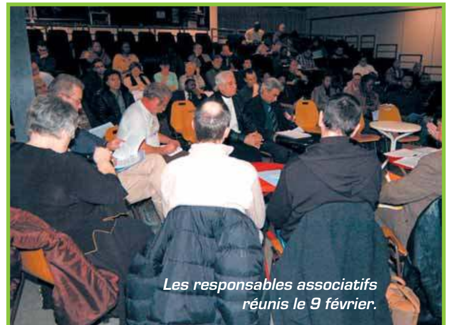
Les responsables associatifs réunis le 9 février.

cela ne semble pas suffire ! Nous voulons maintenant un budget pour faire vivre notre ville, pas pour survivre ! »