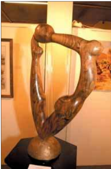
Le 1 er prix de l'Adapg.