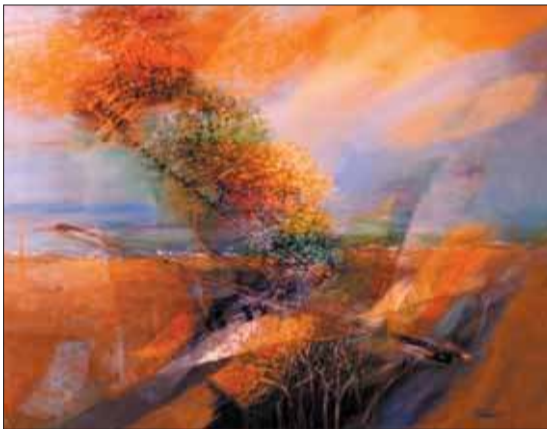
Le prix de la municipalité.