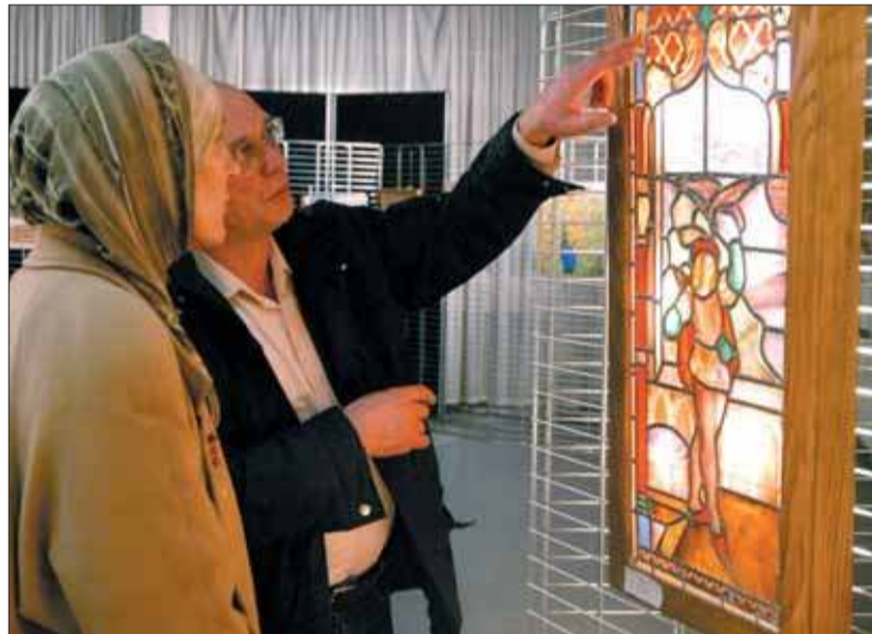
Le 2 e prix.