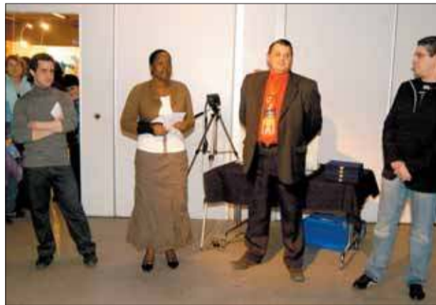
De gauche à droite, l'invité d'honneur, et le nouveau bureau de l'Adapg : la secrétaire, le trésorier et le président.