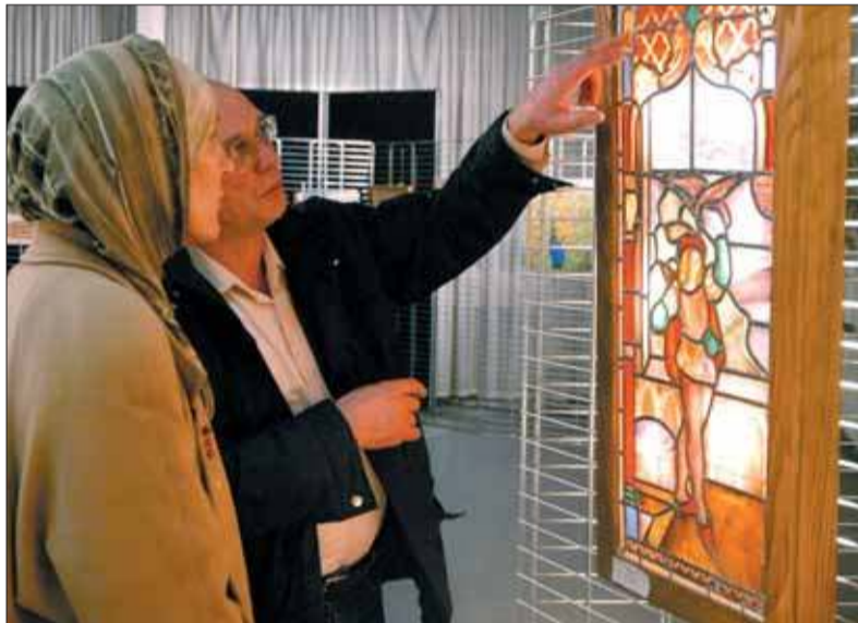
Le 2 e prix.