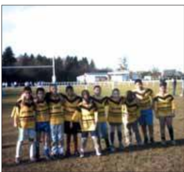
L'équipe 2006 des poussins.

BELLE VICTOIRE DES SENIORS de l'entente Grigny-Fleury par 38 à 4 face à la courageuse équipe de Montgeron, le dimanche 15 janvier dernier. Battus à l'aller, les joueurs grignois emmenés par leur entraîneur Agostino Leitao, n'ont laissé aucune chance à l'équipe pour-