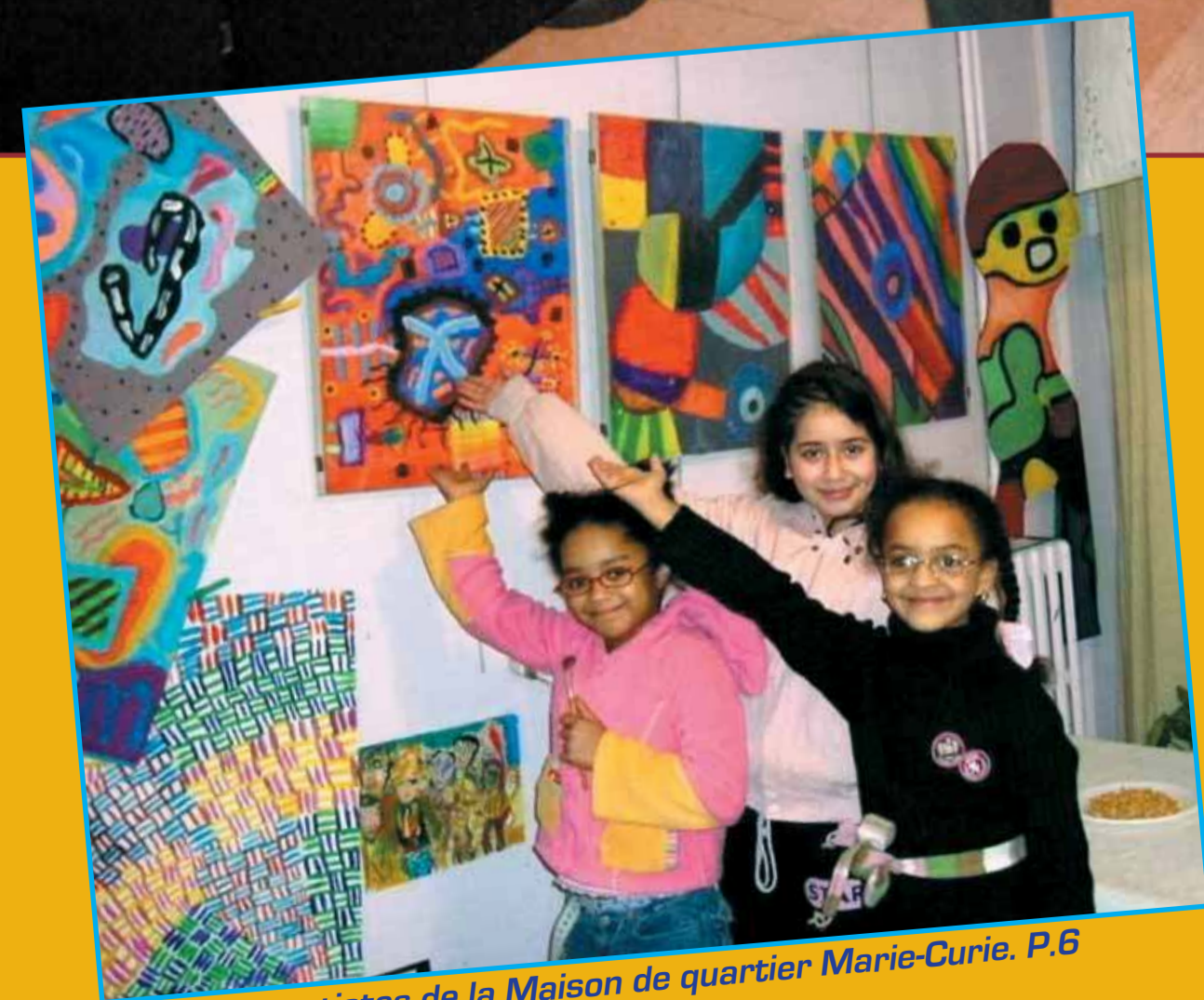
Les jeunes artistes de la Maison de quartier Marie-Curie. P.6

Des rendez-vous chaleureux pour les congés d'hiver. P.3