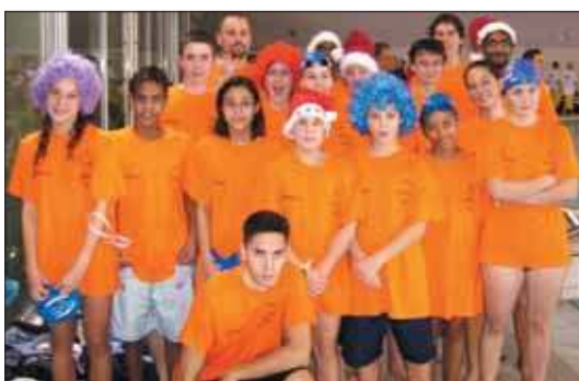
Les joyeux nageurs de l'Usg natation.