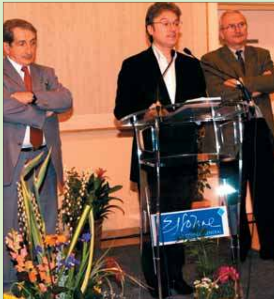
Les Conseillers généraux.

Les particuliers aussi étaient de la fête, pour les jardins, les balcons, les bâtiments publics, les écoles ou les commerces.