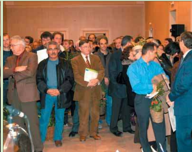
Les lauréats du concours.