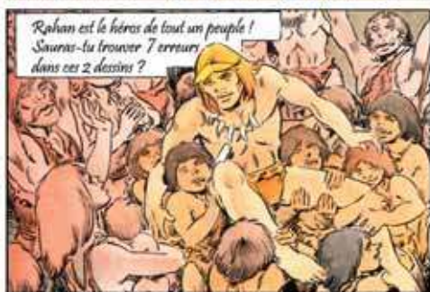
Solution en page 6.

tions créées avec les enseignants seront installées pendant la durée de la manifestation, en parallèle des expositions temporaires