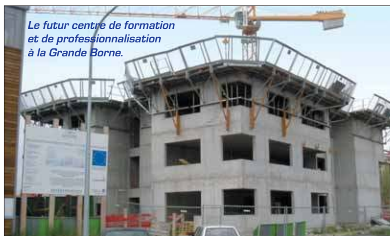
Le futur centre de formation et de professionnalisation à la Grande Borne.

Suivra la réalisation mitoyenne d'un gymnase. Tout comme le collège voisin, l'établissement bénéficie de normes de haute qualité environne- mentale (HQE) et disposera d'un parking en sous-sol. Un bâtiment qui correspond à l'arrivée d'habi- tants qui occupent progressivement le nouveau lotissement.