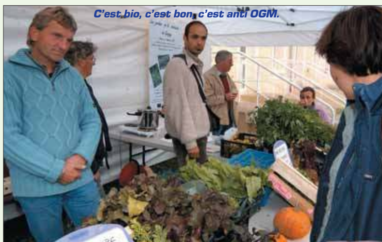
C'est bio, c'est bon, c'est anti OGM.