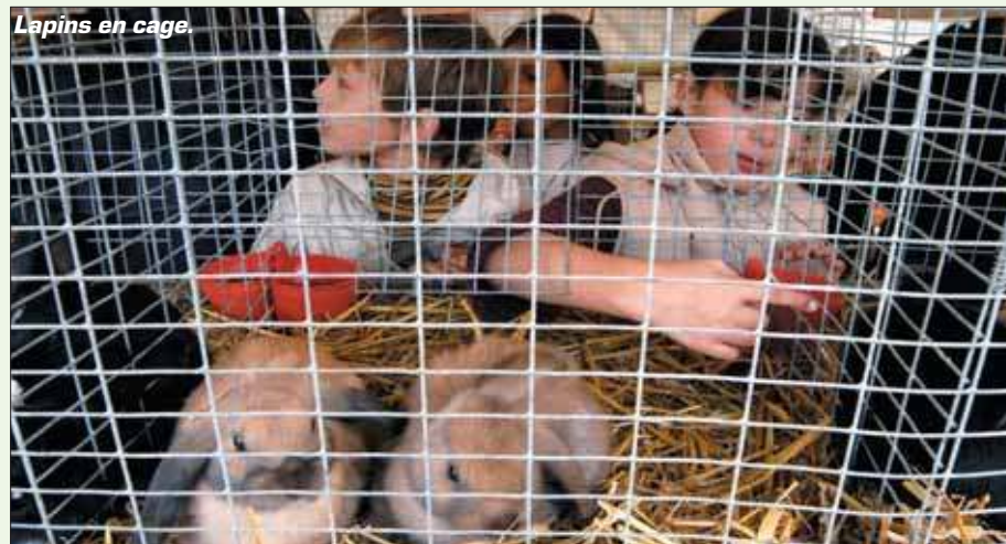
Lapins en cage.