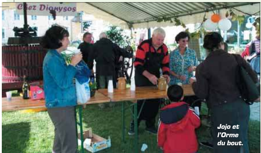
Jojo et l'Orme du bout.