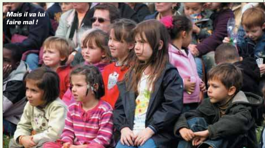
Mais il va lui faire mal !