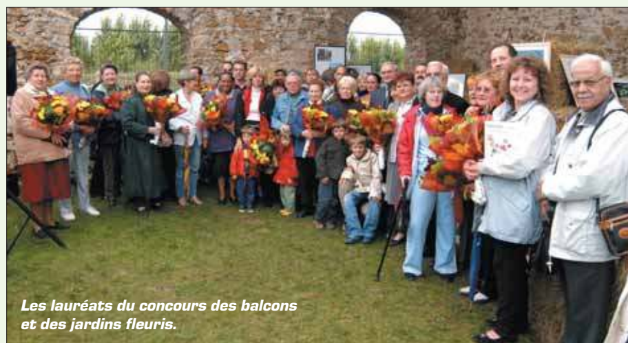
Les lauréats du concours des balcons et des jardins fleuris.