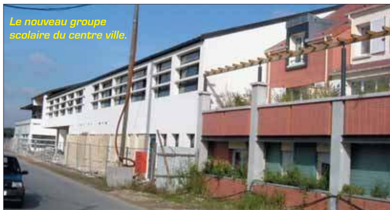
Le nouveau groupe scolaire du centre ville.

Grigny a mis en chantier un vaste programme de rénovation, de reconstruction et de créaion d'équipements scolaires, pour répondre aux besoins actuels, prenant en compte les nouveaux arrivés dans les logements du centre ville.