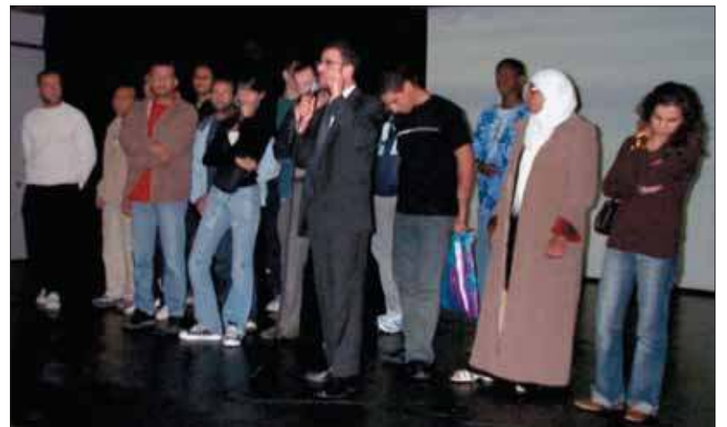
Les encadrants de l'été en compagnie du président de l'AFG.

L'ASSOCIATION familiale de Grigny (AFG) organisait une soirée festive au Centre culturel Sidney-Bechet, le jeudi 28 septembre dernier, au cours de laquelle ses responsables projetaient un film DVD, retraçant toutes les initiatives organisées cet été avec les jeunes et les familles.