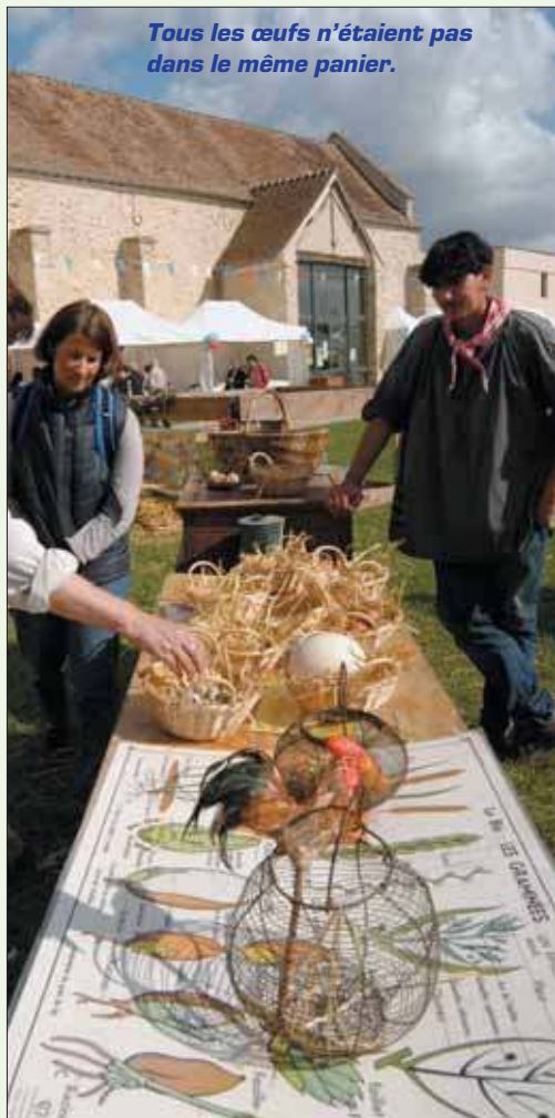
Tous les œufs n'étaient pas dans le même panier.