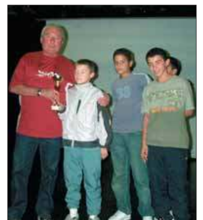
Les jeunes et leur gardien.

Le président de l'AFG remerciait la municipalité pour son aide en matière de transport. Tout s'est parfaitement bien déroulé, sans incident ; les grands encadraient les plus petits, avec un sens élevé des responsabilités.