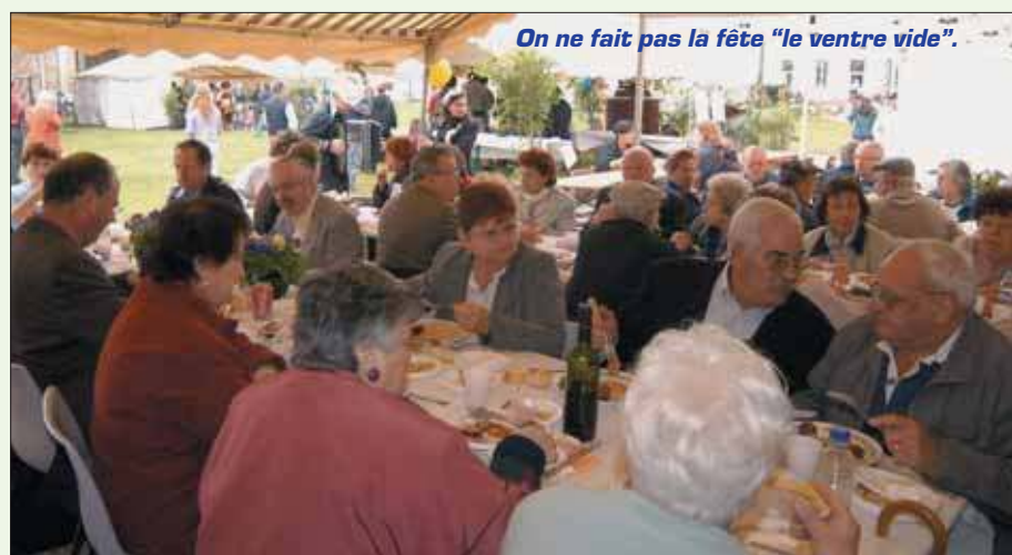
On ne fait pas la fête "le ventre vide".

La 3 e édition de Mon village en ville s'est terminée sur une note joyeuse et dynamique avec la fanfare La belle image.