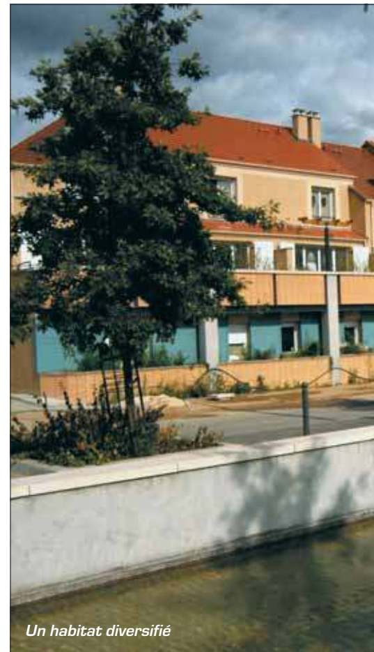
Un habitat diversifié