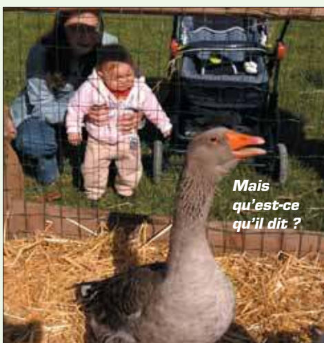
Mais qu'est-ce qu'il dit ?

Retrouvez les photos de «Mon village en Ville» sur le site de la ville de Grigny www.grigny91.fr à la rubrique : «Grigny hier»