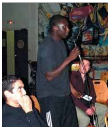
Le président de l'association.

pour permettre aux jeunes de ne pas se laisser gagner par l'oisiveté, avec les effets négatifs qui peuvent s'en suivre. Actuellement nous travaillons à la réalisation d'un projet humanitaire