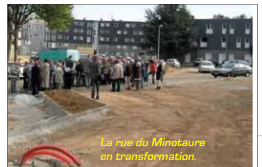
La rue du Minotaure en transformation.

Le petit espace forestier qui surplombe l'équipement est en voie de rénovation et de sécurisation. Ces travaux permettront une ouverture sans risque aux enfants. Le cimetière communal gagnera 15 000 m 2 vers le haut du coteau. L'objectif est d'en faire un cimetière paysager avec jardin du souvenir, une diversification des formes de sépultures (caveaux, stèles...). Une 2 e entrée côté chemin des Rois, avec un parking, figure sur les plans.