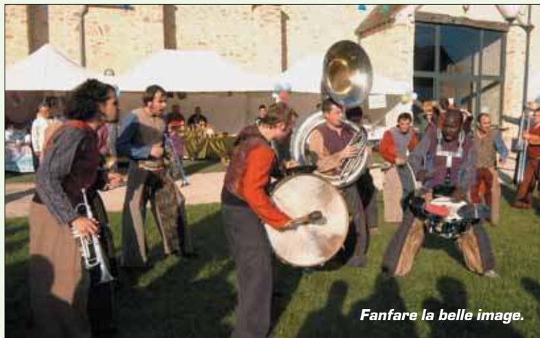
Fanfare la belle image.