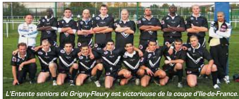
L'Entente seniors de Grigny-Fleury est victorieuse de la coupe d'Ile-de-France.

Les jeunes ont repris les entraînements, mais vous pouvez renforcer encore les équipes. Rendez-vous au Parc des Sports à Grigny. Mercredi à 15h pour les petits (débutants poussins benjamins), à