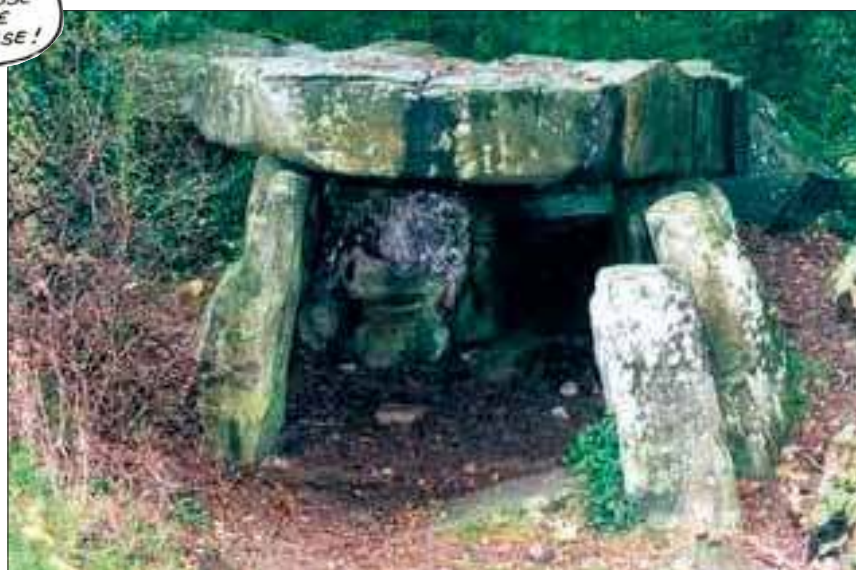
Découvrez les dolmens de l'Essonne.

place de nouvelles techniques artisanales...»