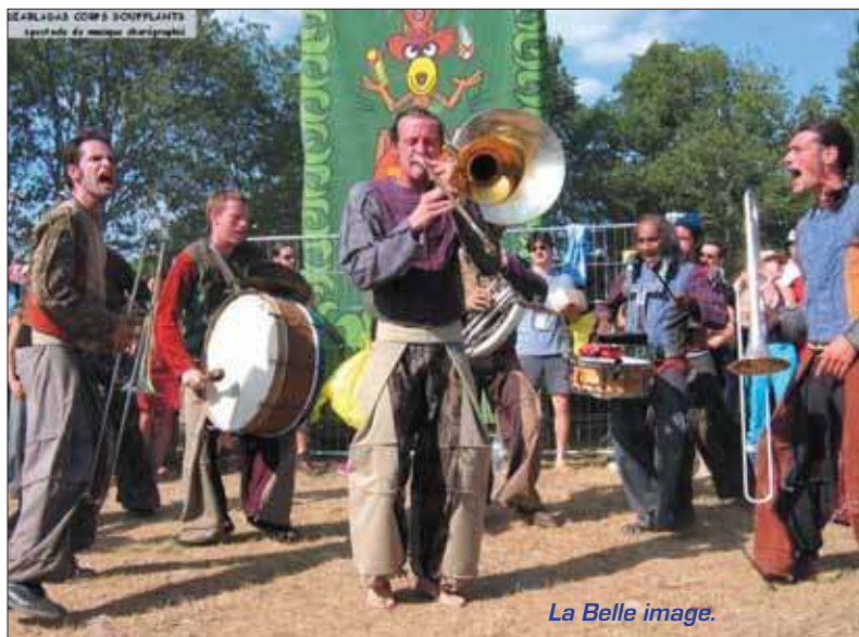
La Belle image.

Les partenaires financiers : Conseil général de l'Essonne – Conseil Régional d'Ile-de-France Renseignements au 01 69 02 53 61 (Direction Education & Culture)