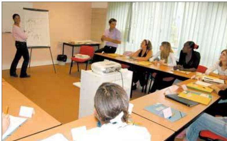
Un stage pour une enseigne nationale a débuté en septembre.

De démarche en démarche, le pro- jet se structure, les contacts se multiplient, l'édifice gagne en cohérence. En décembre 2003 le couple reçoit une proposition de local à Grigny, digne d'intérêt. Le