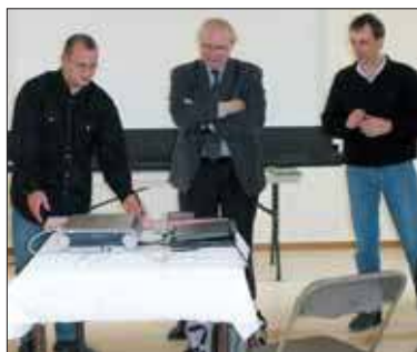
La signature de la convention entre la LPO et la ville de Grigny.

En période estivale, des hirondelles sont présentes à Grigny : hirondelles de fenêtres et quelques hirondelles rustiques. Elles font leur nid au printemps sur les vieux bâtiments de la ville ou pour d'autres dans les grands immeubles au coin des fenêtres. Certaines reprennent leurs nids de l'an passé. Elles se nourrissent d'insectes qu'elles vont rechercher au-dessus de l'eau libre des lacs de