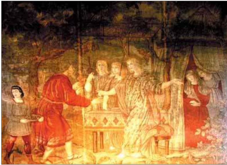
Une des sept tapisseries de Madame Canapville, représentant Abraham et sa femme Sarah dont l'histoire est rapportée dans l'Ancien Testament.

> Ferme neuve et Village : de 10h à 12h, projection d'un diaporama à