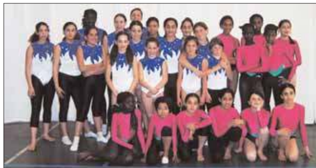
Les jeunes filles de la gymnastique aux agrès se produiront en gala le 24 juin, dans la salle des sports.

Pour rejoindre le club gymnastique, tél. 01 69 45 23 21