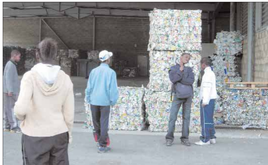
Les jeunes Grignois en visite au Siredom.