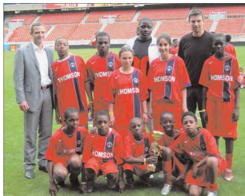
L'équipe grignoise gagnante.

Tout a débuté durant les congés scolaires d'hiver, pour se poursuivre en avril et deux mercredis en mai. Quatre tournois de football ont mobilisé une centaine de jeunes de 10 à 15 ans, dans la Salle des sports Jean-Louis-Henry, sur le coteau Vlaminck, sur le stade des Tuileries et celui de la Grande Borne. Garçons et filles ont bénéficié d'une partie de l'équipement sportif fourni par la fondation du PSG. Ainsi, au cours des quatre mois de rencontres sportives, des sélections ont été réalisées pour envoyer les 10 meilleurs au Parc des Princes. La coupe qu'ils ont ramené est une victoire pour tous ceux qui ont participé aux éliminatoires. Bravo à tous.