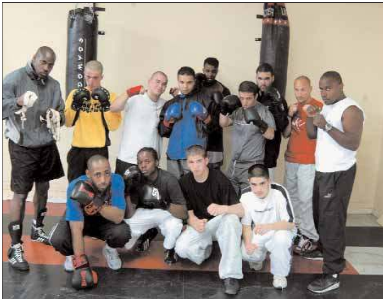
Les membres de l'association Grigny Impact.