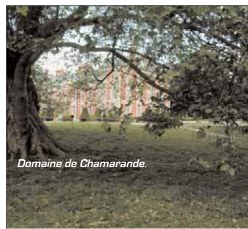
Domaine de Chamarande.

Escoudé Big Band, dignes héritiers de Django Reinhardt. Renseignement au 01 60 82 57 73