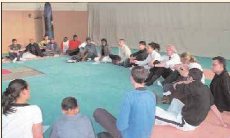
Les participants dialoguent sur le tatamis.

Les dirigeants du club de Kick boxing avaient convié des représentants d'entreprises de transport, d'associations et de la municipalité, le 23 mai dans le Dojo, pour débattre autour du respect des autres, du bien commun et de la violence.