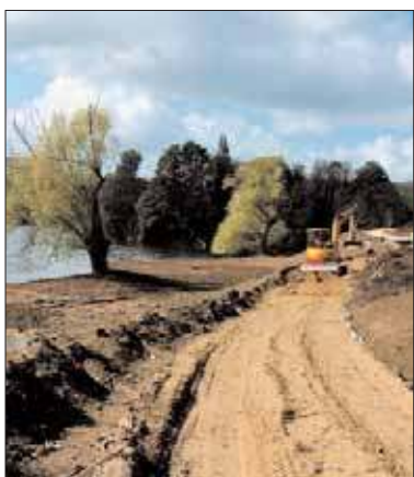
Travaux engagés par "Les Lacs de l'Essonne".

Le conseil municipal réuni le mardi 24 mai, a adopté un ensemble de délibérations, dont voici les plus significatives.