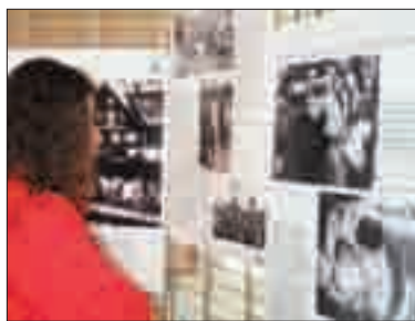
Une jeune fille devant l'exposition sur la déportation dans les camps nazis, réalisée par la Fondation pour la mémoire de la déportation.

Les participants se retrouvaient ensuite à la Ferme neuve, pour une présentation par l'association d'histoire locale l'Orme du bout, de l'exposition La déportation dans les camps nazis , réalisée par la Fondation pour la mémoire de la déportation. Dans le même espace, est installée l'exposition d'arts plastiques Le chemin de papier , réalisée par José François Moyano, fille de déporté. Les choristes gratifiaient les Grignois du magnifique Ave Verum de Mozart.