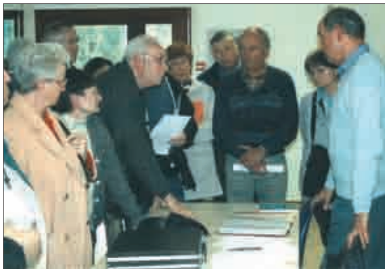
Un débat autour du décret du 27 juillet 2004.