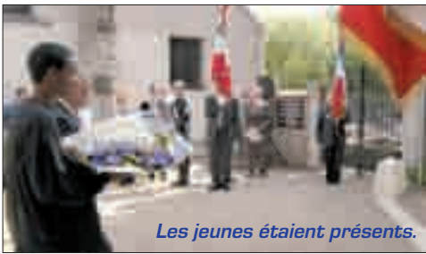
Les jeunes étaient présents.

Chacun ensuite visitait l'exposition sur les camps nazis, mesurant une fois de plus l'insoutenable cruauté dont certains hommes sont capables.