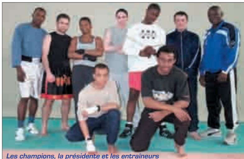
Les champions, la présidente et les entraîneurs

Pour rejoindre la section boxe anglaise, appeler JM Bassi au 06 68 82 93 87