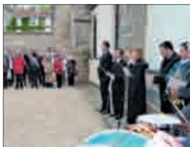
Le chant des Marais interprété par 4 choristes, au monument aux morts.