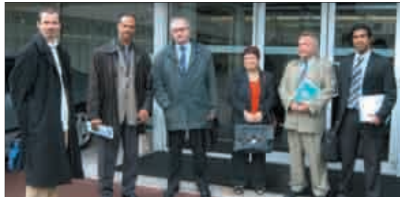
La délégation municipale en préfecture.

En conclusion de la rencontre, le Maire a renouvelé la demande de renforcement des effectifs de police de proximité au commissariat de Grigny, et d'actions d'investigation. Une démarche similaire sera instaurée avec le Procureur de la République, afin d'aborder l'impact des réponses apportées par la Justice en terme de réparation des actes de délinquance sur la ville de Grigny.