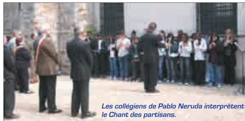
Les collégiens de Pablo Neruda interprètent le Chant des partisans.