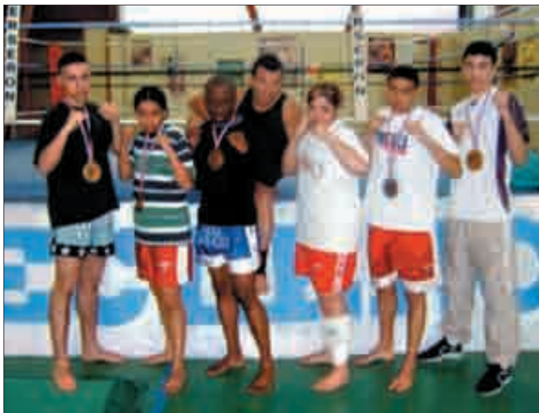
Les jeunes champions et leur entraîneur.