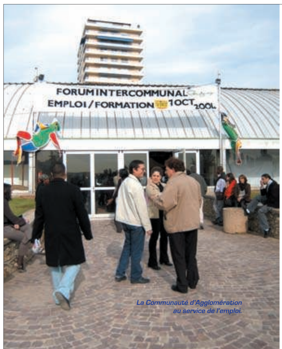
La Communauté d'Agglomération au service de l'emploi.

Depuis sa création le Conseil communautaire s'est réuni à 11 reprises et son Bureau se tient tous les 15 jours en moyenne.