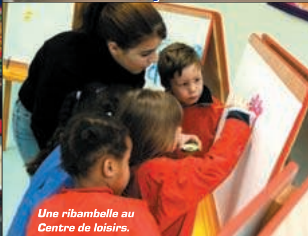
Une ribambelle au Centre de loisirs.