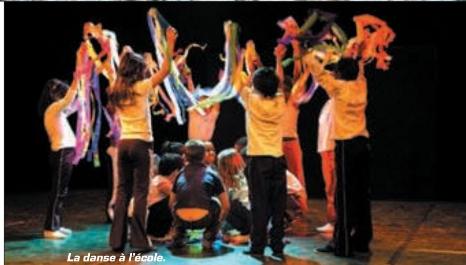
La danse à l'école.