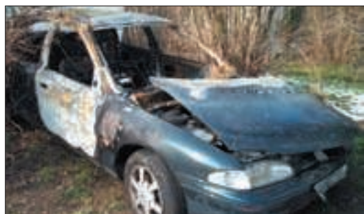
En 2004, 611 «voitures ventouses et épaves» ont été enlevées de l'espace public, grâce à une coopération entre la ville et la police nationale.

Rendez-vous : Samedi 19 mars 2005, de 9 h à 18 h au Collège Sonia-Delaunay - Chemin du Plessis à Grigny Renseignements au 01 69 02 45 70