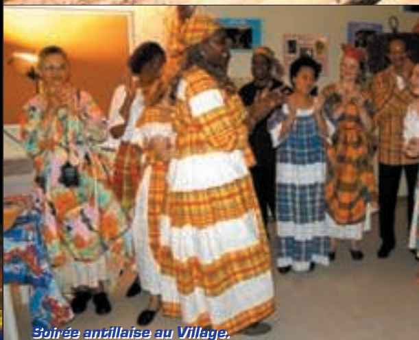
Soirée antillaise au Village.