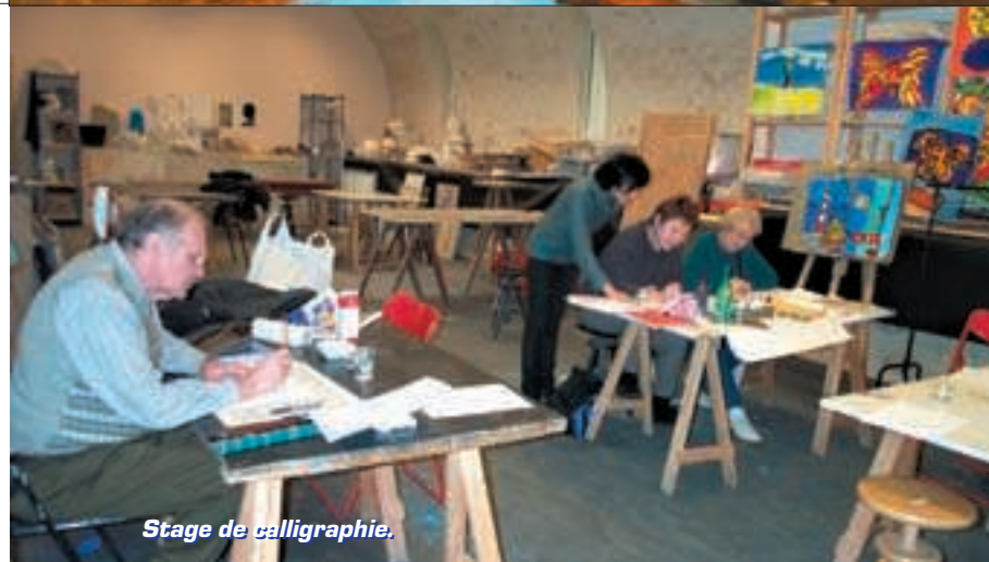
Stage de calligraphie.