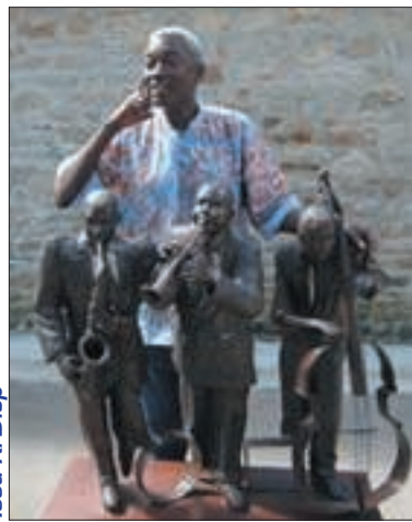
Issa K. Diop

P OUR la 2 e édition du Salon des arts plastiques afro-caribéens, qui ouvrira le samedi 2 avril 2005, l'Association pour le développement des arts plastiques à Grigny (Adapg) invite deux artistes sénégalais. Les invités d'honneur, Issa K. Diop, sculpteur-fondeur et le peintre Tita, présenteront leurs œuvres du samedi 2 avril au samedi 16 avril 2005 au Centre culturel Sidney-Bechet, parmi celles des autres artistes. Le vernissage se déroulera le 2 avril à 17h, il sera suivi d'une soirée jazz à 20h30, avec Tangora métiss'jazz.