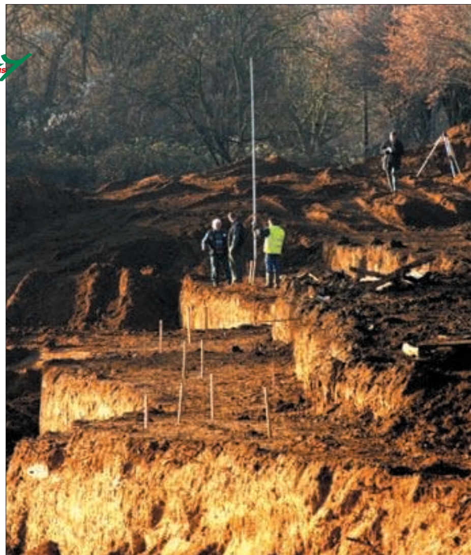
Les premiers travaux d'aménagement des berges des Lacs.