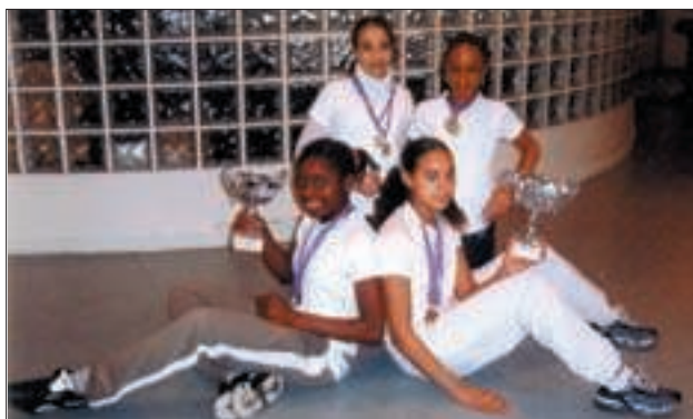
Les jeunes athlètes de Sonia-Delaunay.

Les jeunes filles du collège Sonia-Delaunay, après avoir occupé la plus haute marche du championnat départemental, ont été «sacrées» championnes académiques au début du mois de février.