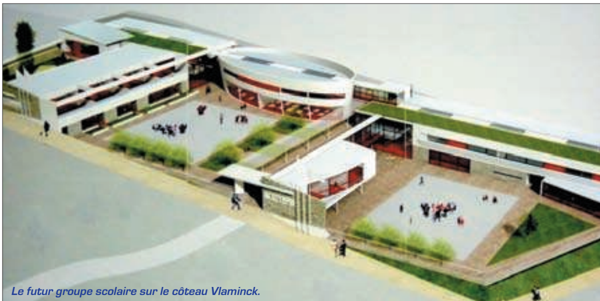
Le futur groupe scolaire sur le coteau Vlamincq.