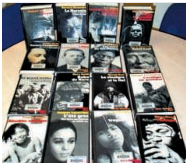
La collection Terre Humaine à la Bibliothèque Victor-Hugo, à Grigny. Et une exposition à la Bibliothèque de France à Paris.

Renseignements : tél. 01 53 79 59 59. Entrée libre.