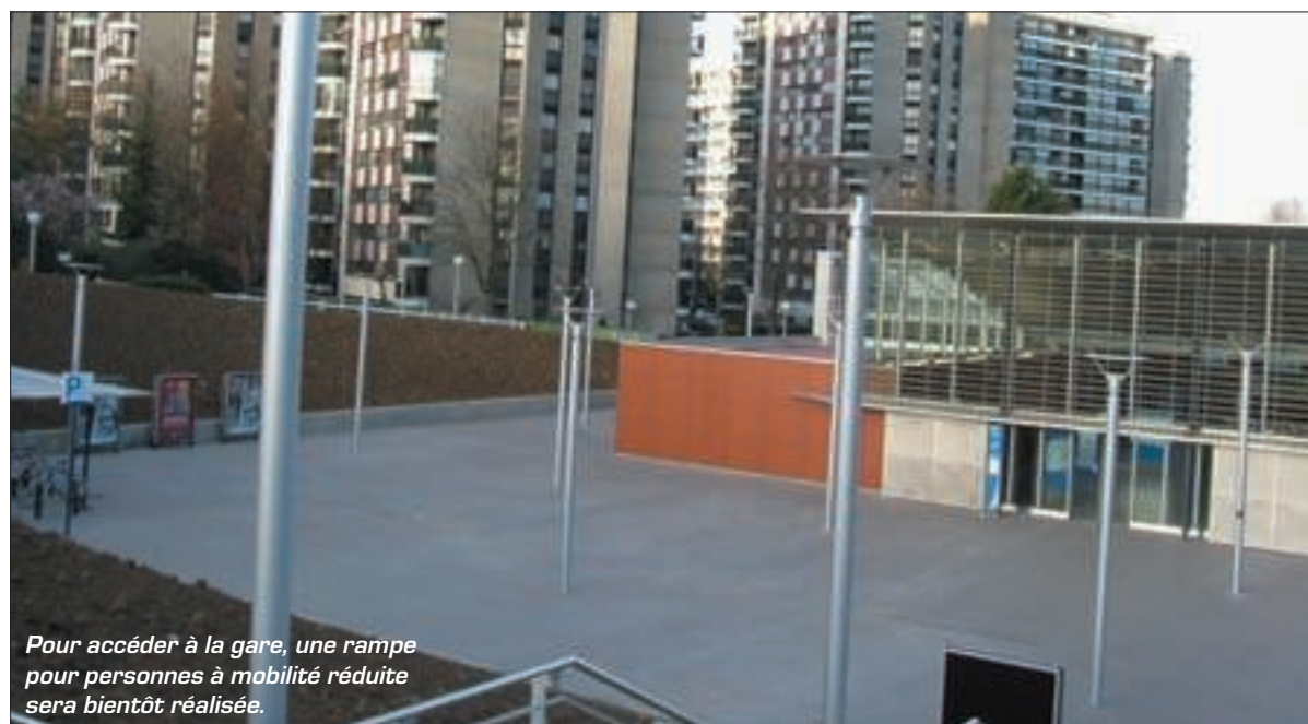
Pour accéder à la gare, une rampe pour personnes à mobilité réduite sera bientôt réalisée.

tionnement matériel et humain de l'agglomération.