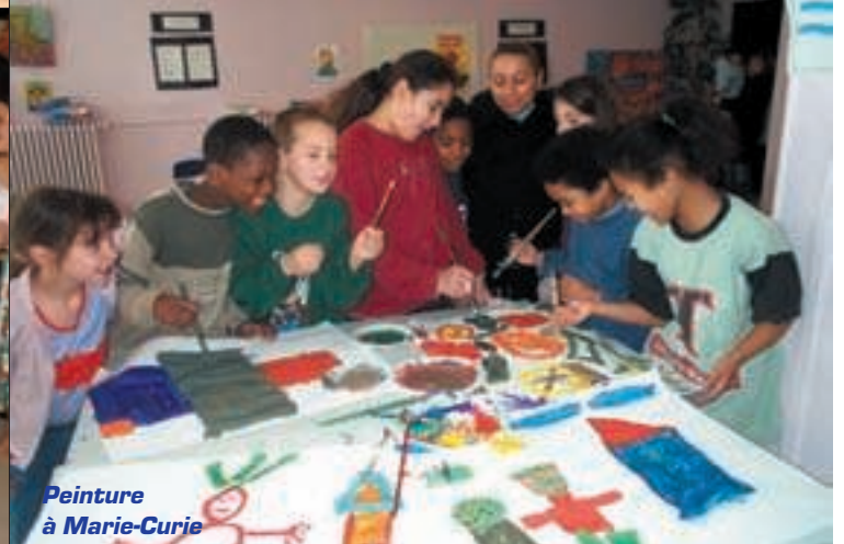
Peinture à Marie-Curie