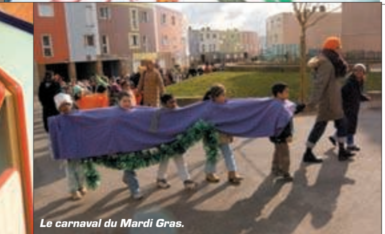
Le carnaval du Mardi Gras.