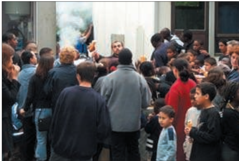
Les conseils de voisinage, des lieux de dialogue et de projets pour tous.

Une telle réunion a pour objectif de faire le point de la situation à Grigny, en réfléchissant aux perspectives pour cette année et les suivantes. Entre autres, s'impose la mise en place prochaine d'un Conseil Local de Sécurité et de Prévention de la Délinquance (CLSPD) présidé par le Maire, et dont seront membres le Préfet, le Procureur de la République et des habitants de Grigny. Cet organisme offrira un point d'appui positif pour progresser. De même, l'élaboration collective d'une «charte» pour bien vivre ensemble