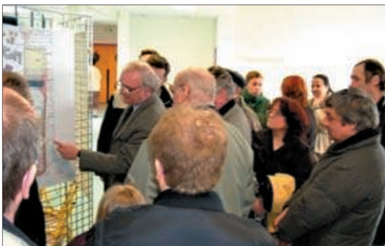
Les habitants de Grigny2 prennent connaissance des réalisations et des projets.

Le Maire conclut la visite en précisant que le nouveau groupe scolaire «nous permettra également de supprimer les préfabriqués qui existent ici et là dans nos écoles. Le dossier pour la construction de ce groupe scolaire, fait partie de ceux déposés à l'agence Nationale du Renouvellement Urbain, afin d'obtenir des subventions au taux maximal.»