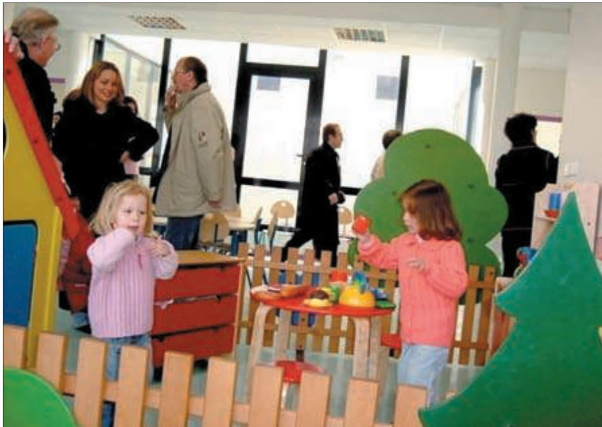
Un Centre de loisirs flambant neuf à Grigny 2.

Naturellement, cette démarche s'est traduite par la mise aux normes progressive de toutes les écoles de la ville : sécurisation des établissements, mobilier changé, étanchéité et électricité rénovées, système de chauffage normalisé et réalisation d'une salle informatique pour toutes les écoles, y compris maternelles.