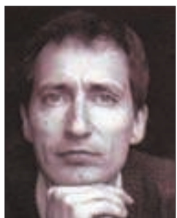
Rencontre avec l'écrivain Pierre Garçonnat.

L e samedi 12 mars à 14h30, la bibliothèque Victor-Hugo (place de la Carpe) accueillera un écrivain essonnien Pierre Garçonnat.