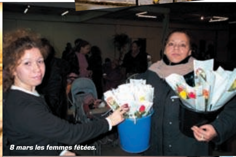
8 mars les femmes fêtées.