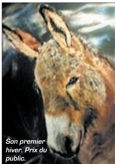
Son premier hiver. Prix du public.