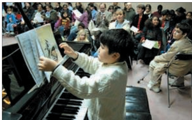
Des heures de travail transmises en quelques minutes.

Ouverture du secrétariat : mardi de 14h à 18h, mercredi de 9h à 12h et de 14h à 19h, vendredi de 14h à 17h30, samedi de 9h à 12h. Fermé pendant les vacances scolaires.