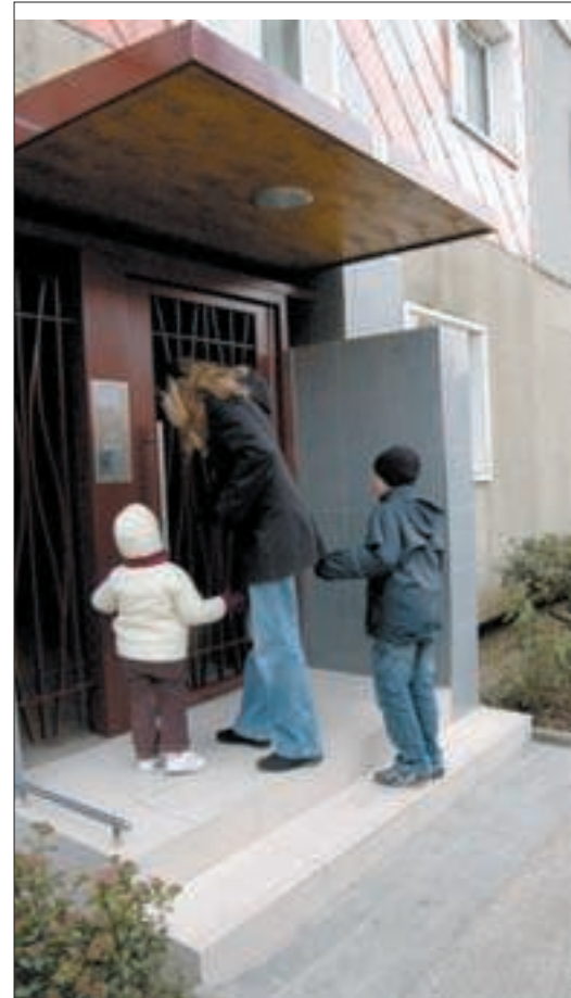
Des entrées modernisées, sécurisées et accueillantes.

Le souhait de la municipalité de voir la Grande Borne sortir de sa seule vocation d'habitat, semble avoir été entendu par le bailleur. Ainsi, l'immeuble situé au 20, rue des Petits Pas, a été totalement