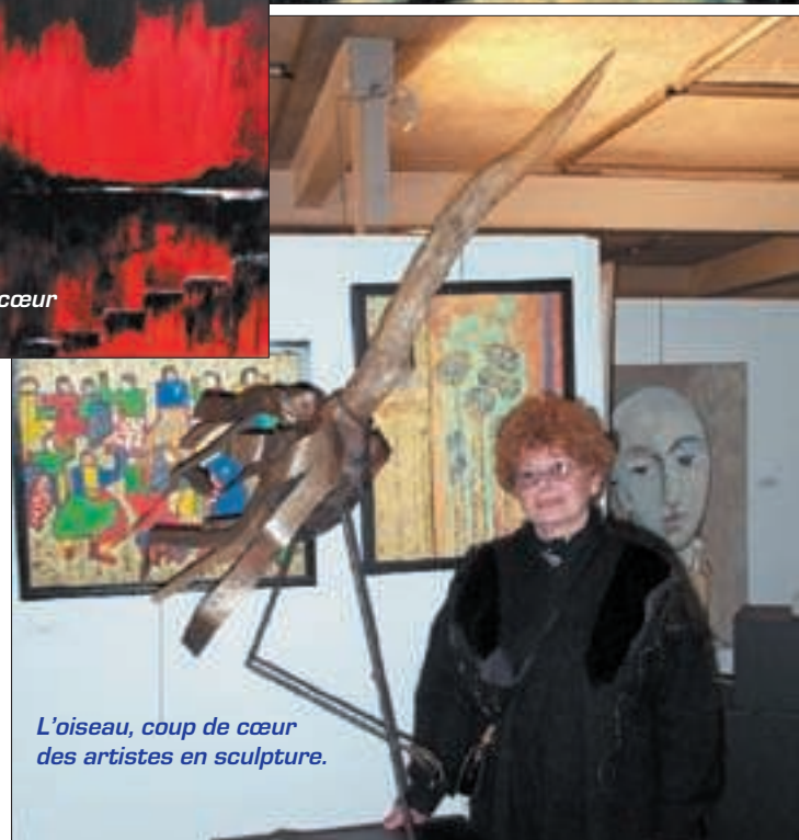
L'oiseau, coup de cœur des artistes en sculpture.