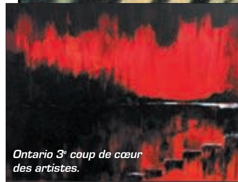
Ontario 3 e coup de cœur des artistes.