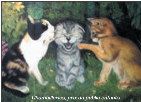
Chamailleries, prix du public enfants.