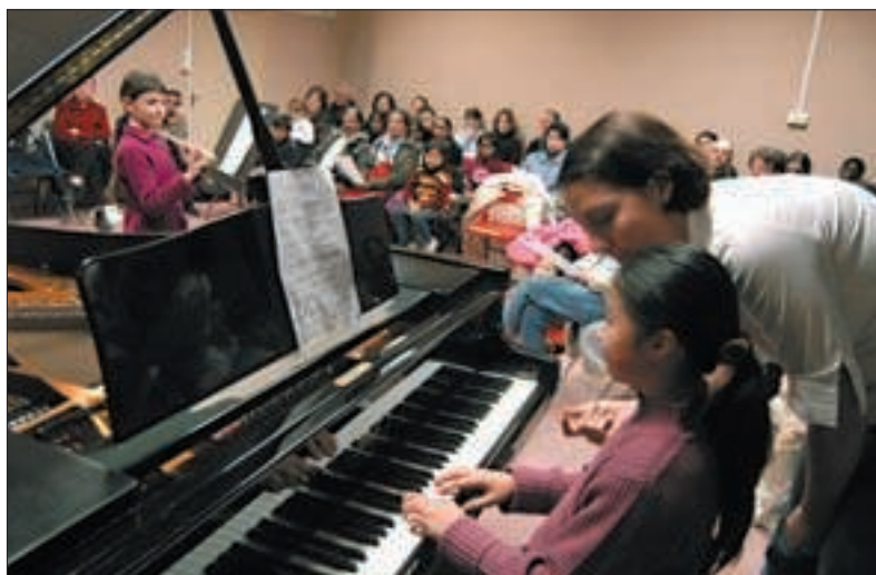
Des élèves à l'écoute des professeurs...

Ces soirées permettent aux musiciens de tout niveau de mettre en valeur leur progression, de s'habituer à jouer devant un public et de se rencontrer pour former des ensembles.