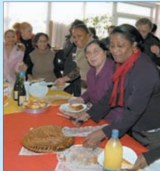
La galette, un moment pour faire connaître le programme de l'année.