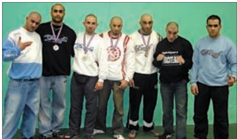
Les champions de France et le staff technique.

et la municipalité qui soutiennent activement les activités de l'association qui est sponsorisée par la marque Dezed et le magazine Fightsport. Une fois de plus, des jeunes grignois occupent positivement le devant de la scène sportive, à force de travail et de ténacité.