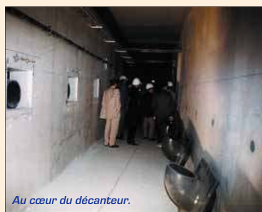
Au cœur du décanteur.

Depuis sa mise en route, cette petite usine située en amont du lac de l'Arbalète, le long du chemin des Glaises à Ris-Orangis, a permis de récupérer plus de 50m 3 de boues chargées d'hydrocarbures et de métaux lourds. Près de 4 m 3 de sachets plastiques, bouteilles et autres objets flottants ont également été recueillis.