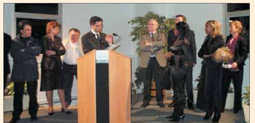
La récompense de la Communauté d'agglomération les Lacs de l'Essonne.

Agence de Grigny : Editions Keiz, 6, rue des bâtisseurs, Grigny. Courriel : editionskeiz@free.fr