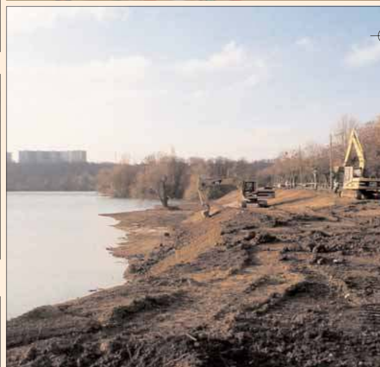
Les berges des Lacs.