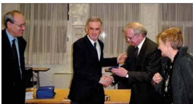
Le maire de Schio reçoit la médaille de la ville de Grigny.

donner à deux nouvelles rues de Grigny les noms de « rue des Carriers italiens » et « rue de Schio ». (...) Engagés dans une nouvelle étape de son développement, nous voulons conserver en mémoire l'histoire de notre commune.»