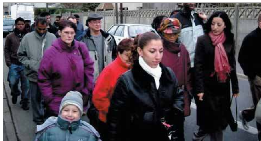
Le samedi 15 janvier, marche silencieuse en hommage aux victimes du Tsunami.

Les services municipaux et les associations Franco-Indienne, Association des chômeurs, Agence 91, Ailes Bridées, Amicale antillaise, A Nou La, Arac, AMG2, Association des Comoriens, Association paroissiale de Grigny, Association des Sénégalais, Casc communaux de Grigny, Décider, Dicr, Fnaca, Grigny solidarité Palestine, Karib'K, Méli Mémé, l'Orme du bout, Palabre, Visage du Maghreb, Union sportive de Grigny, l'UNRPA, Secours Populaire, Secours catholique, la Croix-rouge, l'école Gérard-Philippe et le collège Pablo-Neruda.