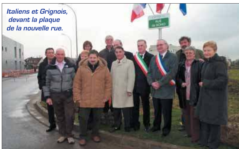
Italiens et Grignois, devant la plaque de la nouvelle rue.

«En 1926, notre commune comprenait un peu plus de 1000 habitants, dont près de la moitié étaient italiens. A cette époque, on appelait Grigny «la petite Italie». Bon nombre de ces ouvriers ont fondé une famille et sont restés vivre ici. (...) C'est pour en conserver la mémoire que le Conseil municipal a décidé de