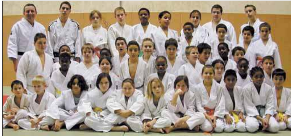
Les jeunes judokas (section des moyens) du club de l'USG et leur entraîneur.

Les Judokas de l'US Grigny se sont distingués lors des coupes Minimes et Benjamins des 15 et 16 janvier 2005 à Montgeron.