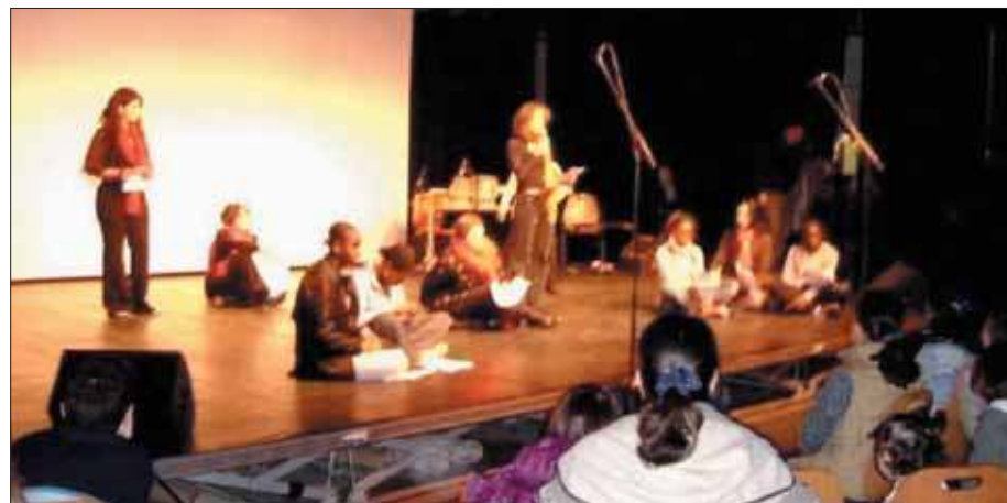
Un moment de poésie émouvant.