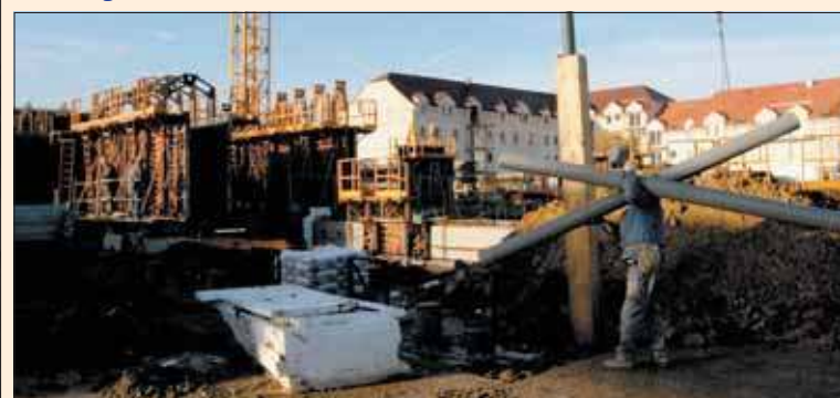
Nouveaux logements face à la Ferme Neuve.