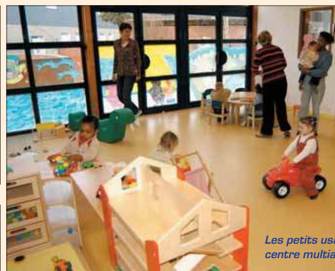
Les petits usagers du centre multiaccueil.