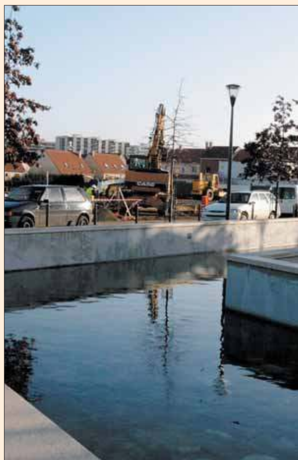
Les engins de travaux sur le chantier de la nouvelle école du centre ville.