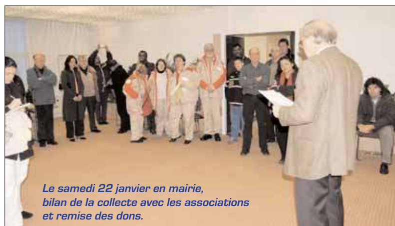
Le samedi 22 janvier en mairie, bilan de la collecte avec les associations et remise des dons.