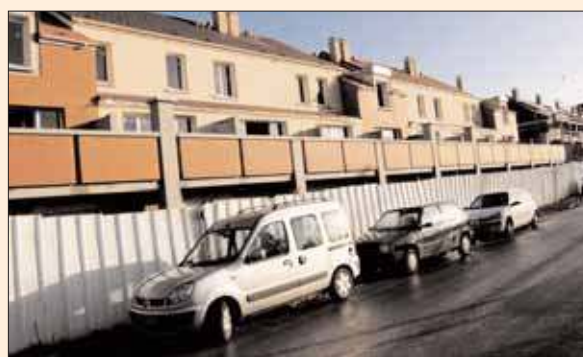
Les nouvelles habitations devant le canal.

La Maison des enfants et de la nature se métamorphose. Un équipement de 1 000m 2 , dont la structure en bois sera chauffée par une chaudière utilisant également le bois, sera construit cette année. Il répond à la norme Haute qualité environnementale.