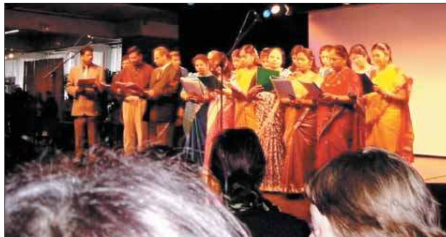
La chorale Tamoule.