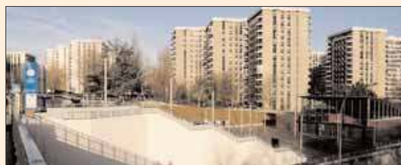
La gare toute neuve Grigny centre.