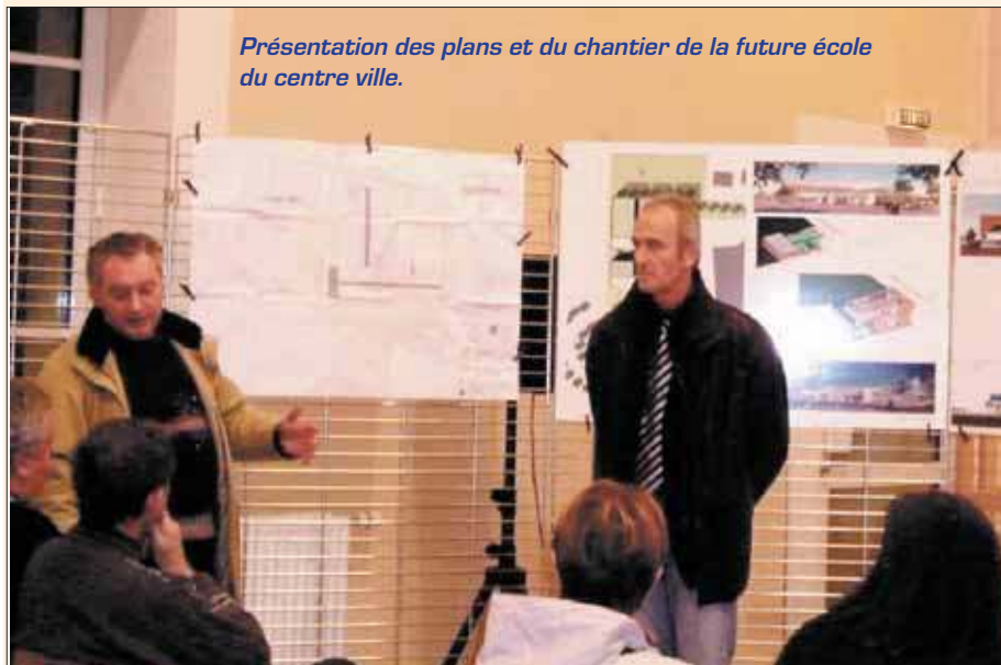
Présentation des plans et du chantier de la future école du centre ville.