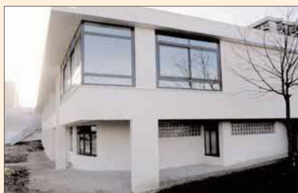
Centre de loisirs et Ecoles Belle au bois Dormant, Petite Sirène.