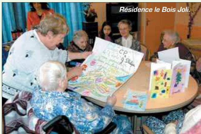
Résidence le Bois Joli.