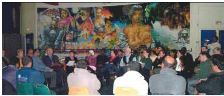
Un comité composé d'associations avec la municipalité, organise cinq heures de solidarité.

Dans la province de Banda Aceh 900 000 enfants âgés de 6 mois à 15 ans sont très vulnérables pour des raisons de santé, de manque de