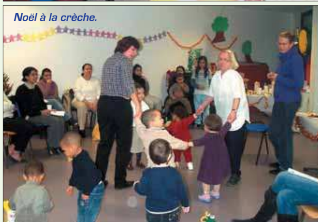
Noël à la crèche.