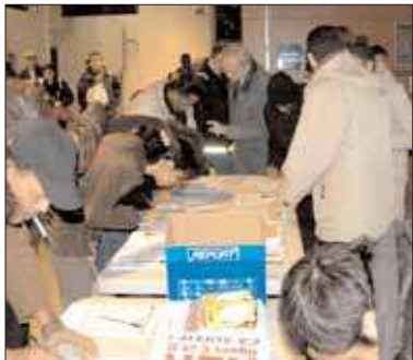
Les usagers témoignent leur colère.

«Quand je sors le matin pour aller bosser, je ne sais jamais si je vais avoir un train ou si celui-ci va être supprimé et ce, quelque soit l'heure. Mon record pour rentrer chez moi, 4h30 environ. On nous dit tout et n'importe quoi ...»