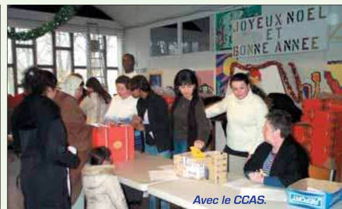
Avec le CCAS.