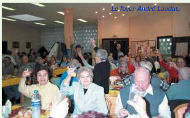
Le foyer André Laudat.