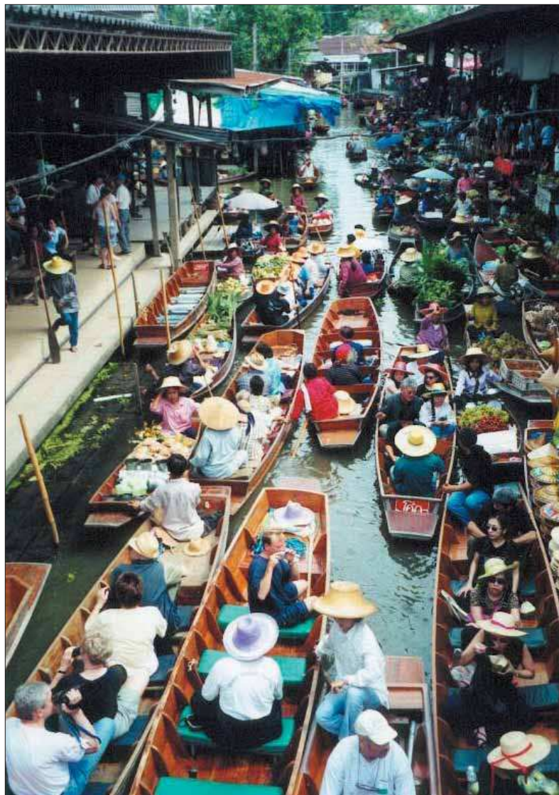
Photo de l'exposition Artist'expo.

Hall d'informations locales tenu par les associations présentant un