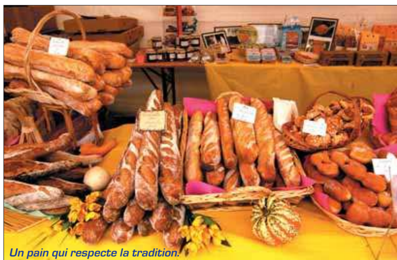
Un pain qui respecte la tradition.

Le domaine départemental de Chamarande accueillera les 27 et 28 novembre, le cinquième marché artisanal, organisé par le Conseil général et la Chambre des métiers de l'Essonne.