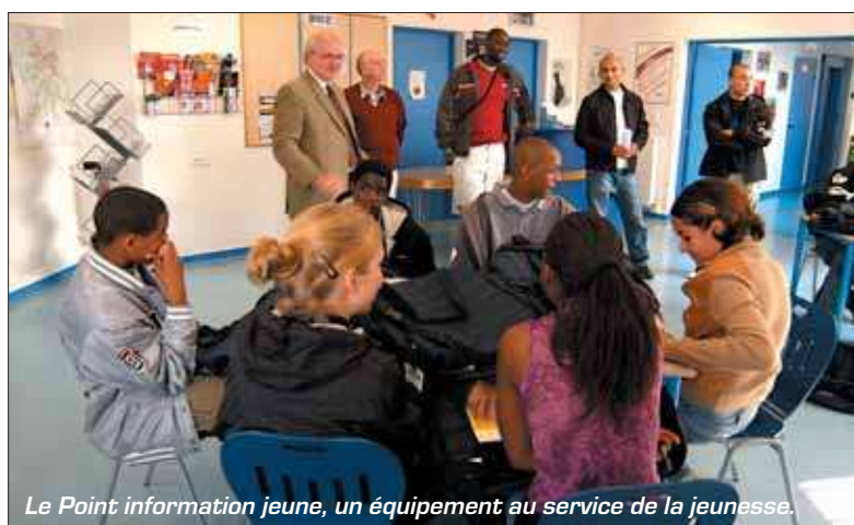
Le Point information jeune, un équipement au service de la jeunesse.

Une motion adoptée à l'unanimité des présents, rappelait que la convention constitutive du GPV de 2000, signée par l'Etat, prévoyait une convention financière, garantissant le soutien pluriannuel du budget grignois pour la mise en œuvre du projet de ville. Celle-ci n'ayant pas été signée, le déséquilibre structurel de Grigny s'est maintenu.