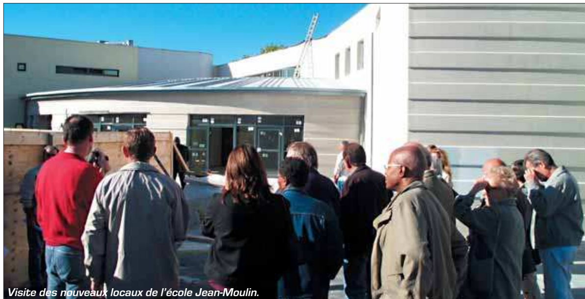
Visite des nouveaux locaux de l'école Jean-Moulin.

Grigny et toutes les communes à ressources fiscales insuffisantes pour répondre aux besoins de leur population, seront-elles enfin entendues ? Les sénateurs et les députés débattent actuellement de la réforme de la Dotation de solidarité urbaine à travers l'article 59 du projet de loi de Cohésion Sociale.