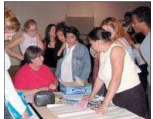
Une journée productive en réflexion.

L'organisation du temps périscolaire figure depuis plusieurs années parmi les priorités municipales et du service communal de l'enfance. Les animateurs de la ville lui ont consacré, le 31 août au centre culturel Sidney-Bechet, une journée de réflexions et d'échanges.