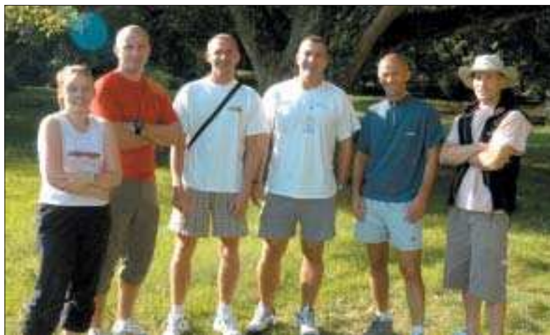
Des éducateurs qualifiés, pour des activités sportives encadrées.

Soucieux du maintien en activité des retraités, mais aussi de la nécessité de rompre l'isolement de certains, le Service des sports propose diverses activités physiques adaptées. Ainsi les « plus de 55 ans » ont la possibilité, suivant leurs disponibilités, leurs capacités et leurs envies, de pratiquer une ou plusieurs activités dans la semaine.