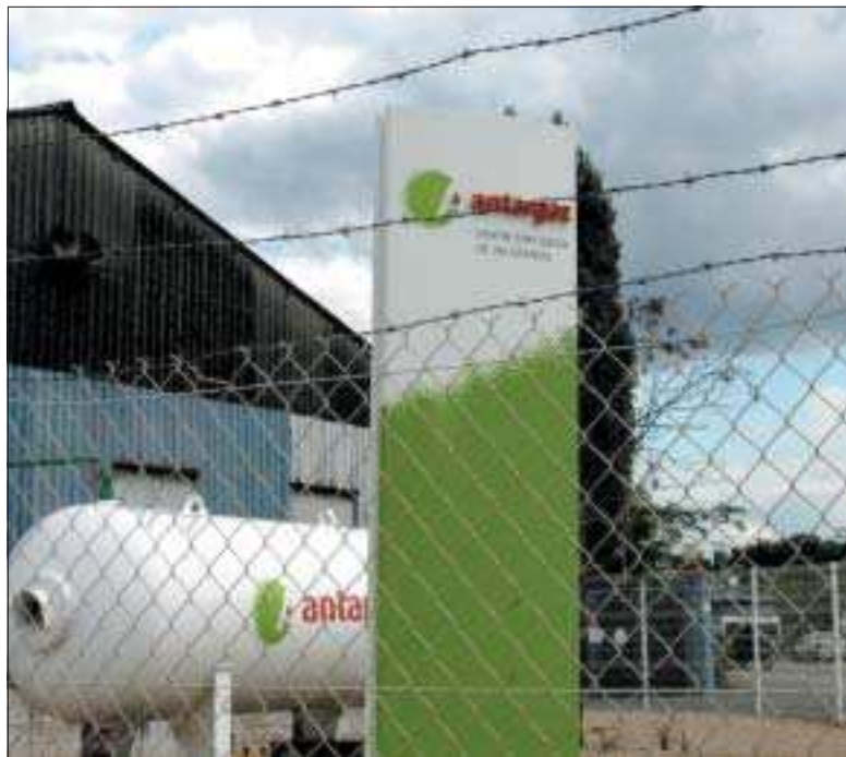
Sécurité renforcée, nouvelles activités possibles.