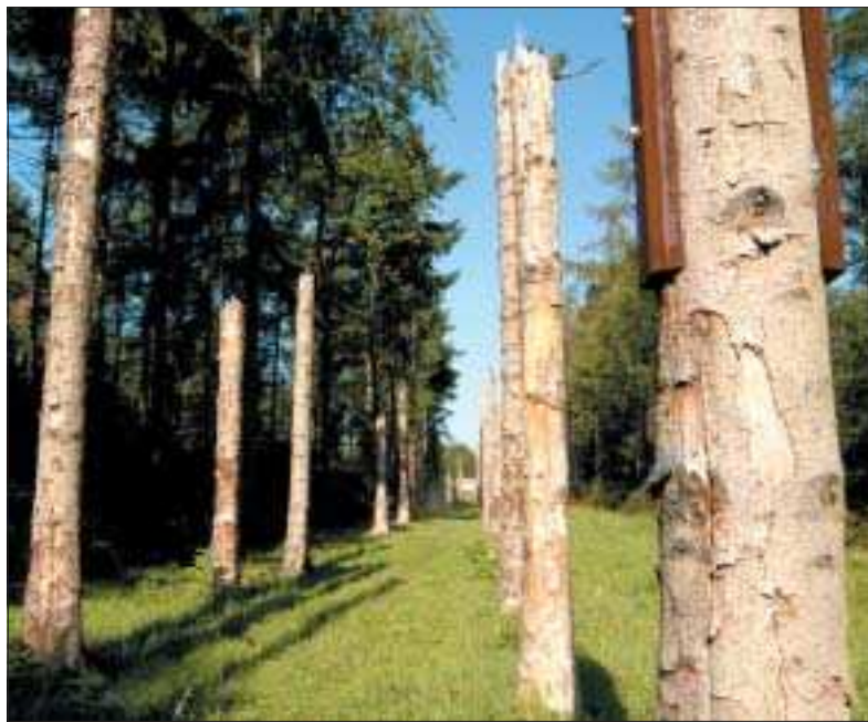
L'Onde créée en mémoire de la tempête de l'hiver 1999/2000.

LA SAPINIÈRE d'une superficie d'environ 13 hectares, est la propriété de la ville de Grigny. Cet espace boisé « naturel », ancienne sapinière a fait l'objet d'un nettoyage important en 1999 suite à la forte tempête de cette année là, qui a créé des espaces, où faune et flore se développent naturellement. Une convention avec la