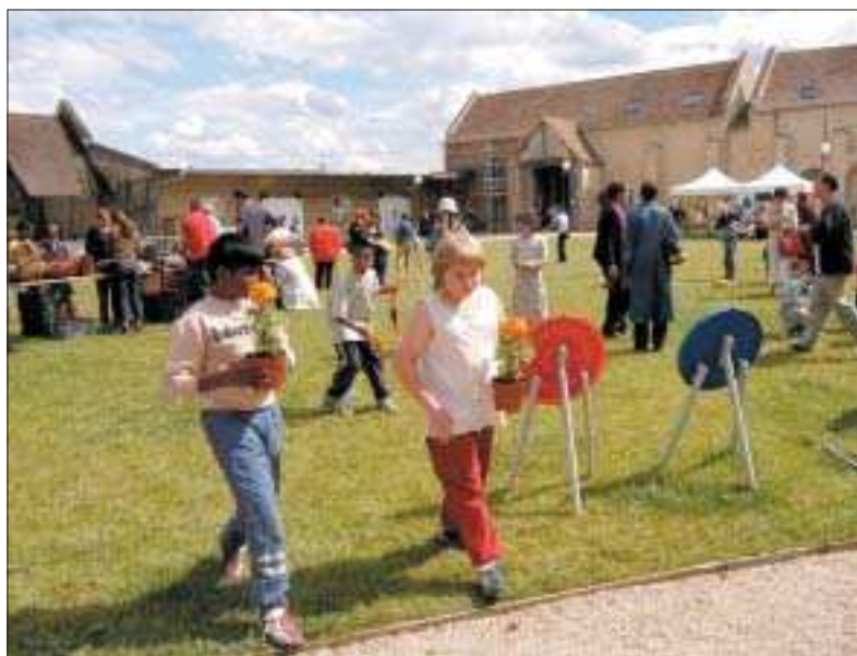
La cour de la Ferme neuve qui accueillera les stands d'artistes.