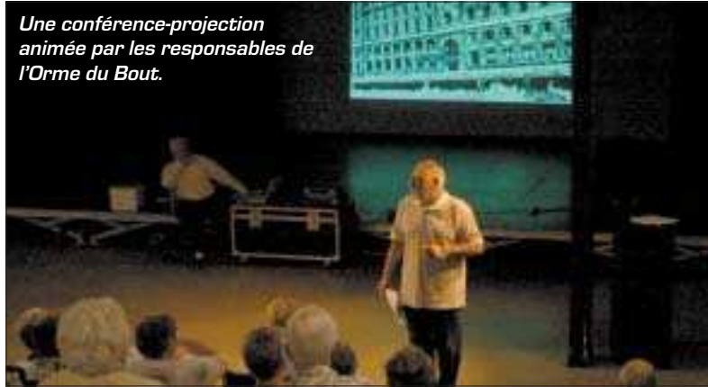
Une conférence-projection animée par les responsables de l'Orme du Bout.