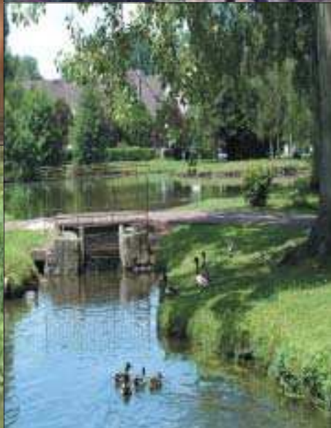
Photos : Office départemental de l'Essonne, de même qu'à la 1ère page souffleur de verre.