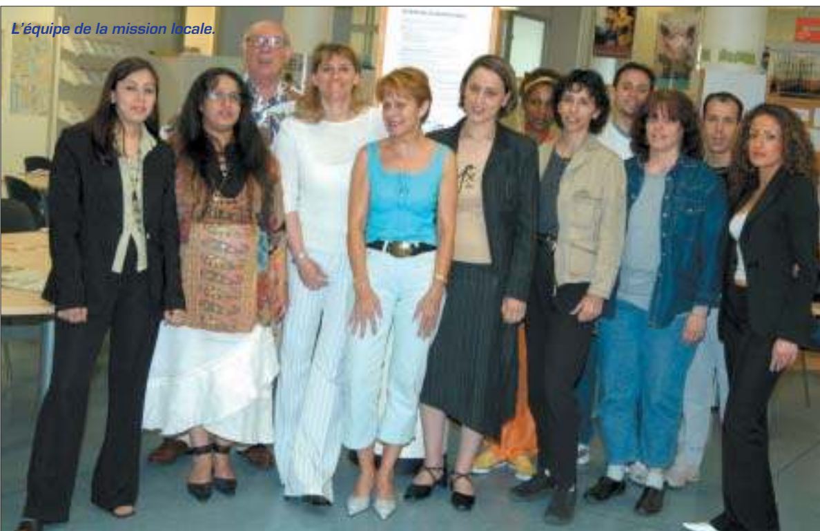
L'équipe de la mission locale.

Les justificatifs à présenter : une pièce d'identité ; une facture EDF ou une quittance de loyer de moins de trois mois, justifiant d'un domicile à Grigny et un certificat d'hébergement s'il y a lieu ; l'attestation vitale de la sécurité sociale, et facultativement un curriculum vitae.