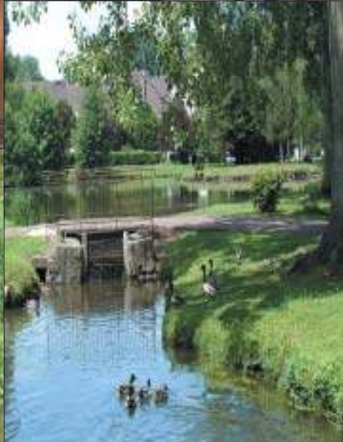
Photos : Office départemental de l'Essonne, de même qu'à la 1ère page souffleur de verre.