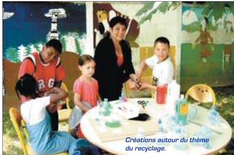
Créations autour du thème du recyclage.