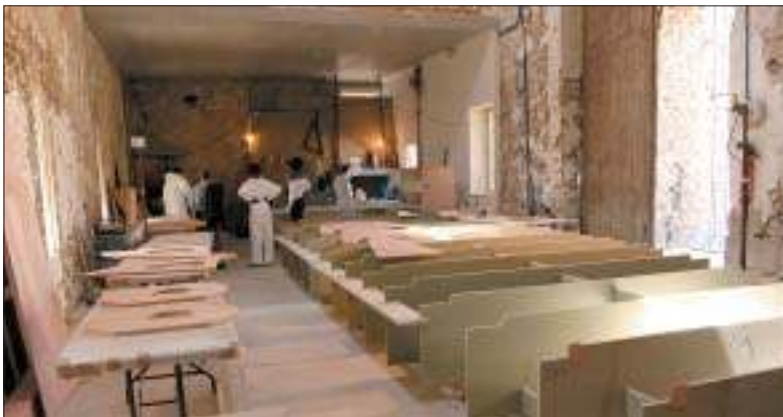
Le chantier, dans une grange de la Ferme Neuve.

Des entreprises seront associées financièrement à la municipalité, ce qui les implique sur une période de cinq ans. Ces sociétés bénéficieront d'un marquage sur la coque, d'un droit d'utilisation du bateau et de son image. Il s'agit de permettre à la ville de rassembler autour d'elle des acteurs significatifs dans le cadre de l'opération "La grande bleue" au coeur de la ville.