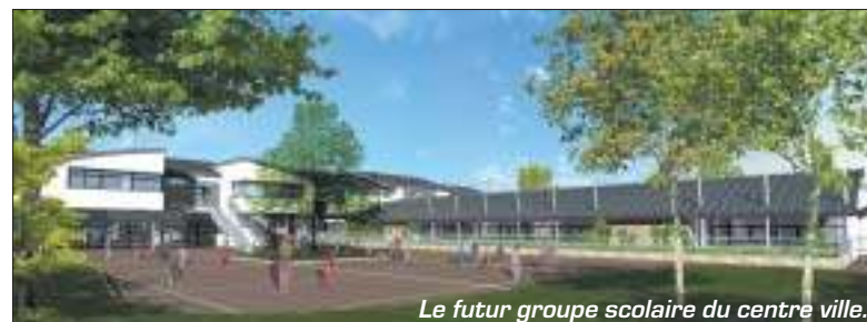
Le futur groupe scolaire du centre ville.

Le nouvel équipement comprendra une salle omnisport, un dojo, des salles de réunion et des parkings en sous sol.