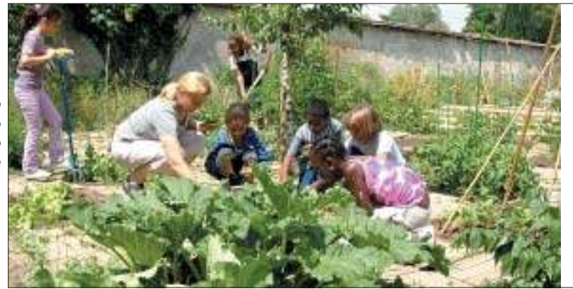
L'apprentissage de la nature se cultive au quotidien.

L'équipement bénéficie d'un subventionnement sur la base d'un contrat triennal. La chaudière, elle sera financée à 40% de son coût par la Région et l'ADEME (Agence de l'environnement et de la maîtrise de l'énergie).