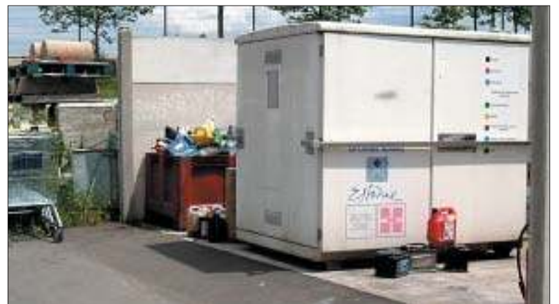
Une armoire pour vos déchets spéciaux vous attend aux ateliers municipaux.

Renseignements : Ateliers municipaux ; 43, Chemin du Plessis. Tél. 01 69 05 14 41