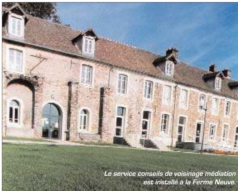
Le service conseils de voisinage médiation est installé à la Ferme Neuve.

Tous les appels sont enregistrés sur un répondeur et traités quotidiennement par l'équipe de médiation de la ville qui le gère avec constance depuis 1998. Tous les matins, ils prennent connaissance des messages de doléances ou suggestions enregistrées par les habitants. Lorsque la plainte soulevée est du domaine des compétences du Service Conseils de voisinage et