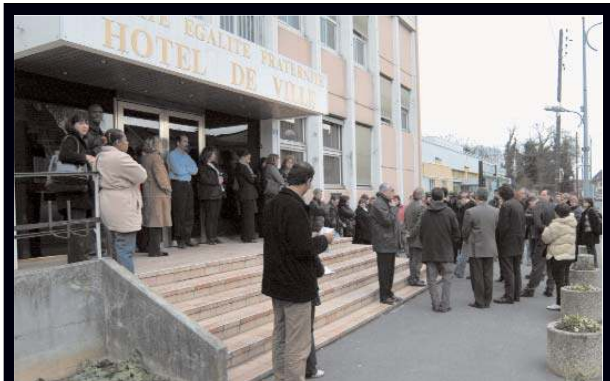
A Grigny, trois minutes de silence en mémoire des victimes des attentats terroristes en Espagne, ont été observées devant la mairie.

Service Conseils de voisinage et médiation, Ferme neuve, Chemin du Plessis 91350 Grigny Tél. 01 69 02 45 72