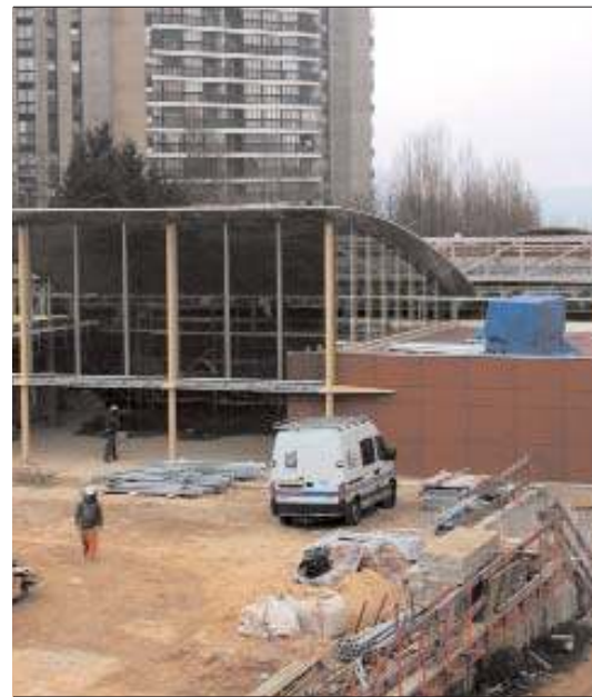
de-France, le Conseil général de l'Essonne, la commune de Grigny, l'Etat, le Réseau Ferré de France et la SNCF.