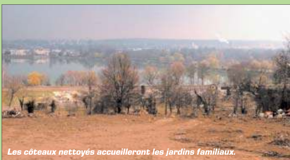
Les côteaux nettoyés accueilleront les jardins familiaux.