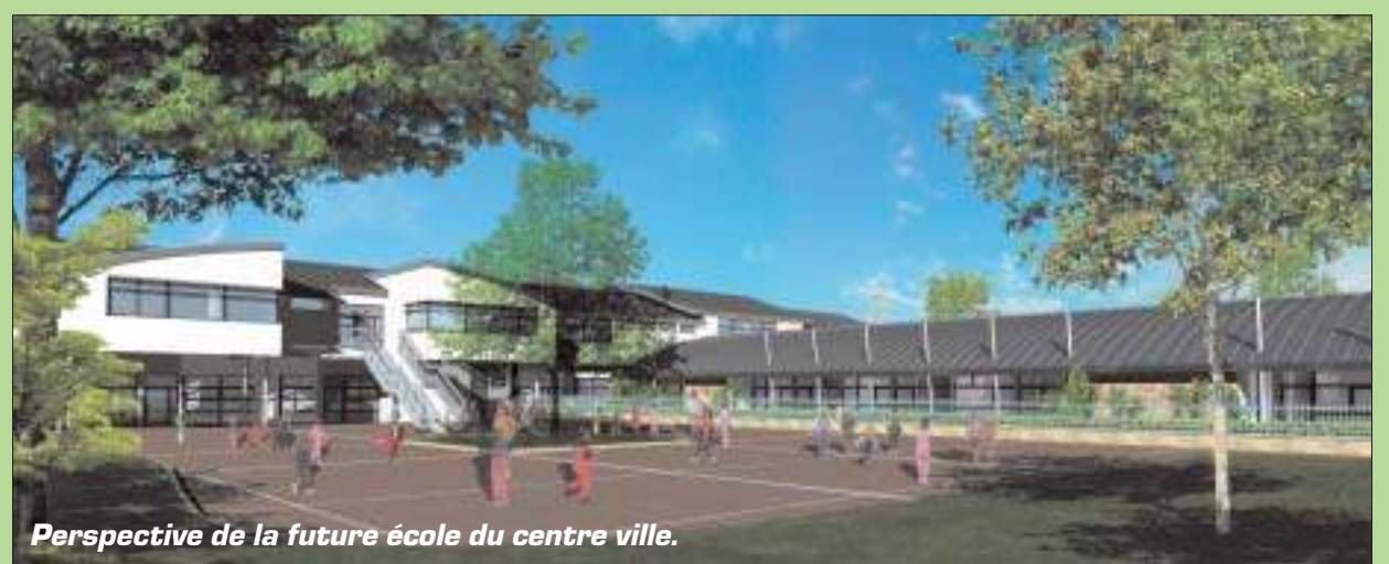
Perspective de la future école du centre ville.