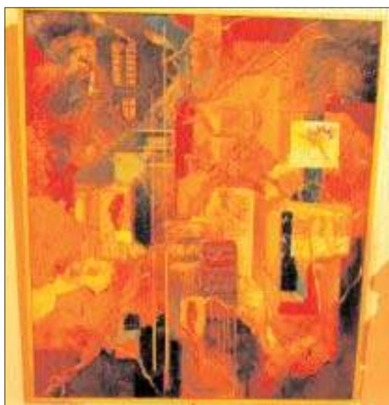
La toile de Michel Jaffredo, 1 er prix de la municipalité.