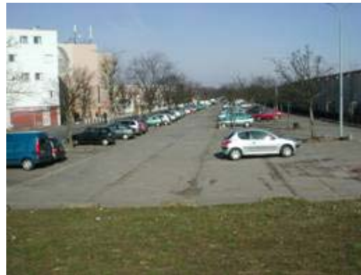
Vue du Pont Le Plessis