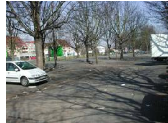
Parkings périphériques RN 445