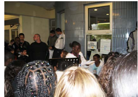
Collège Olivier de Serres