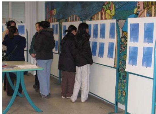
Collège Pablo Neruda

Ici et là sur le territoire, la jeunesse réserva une Fête citoyenne à l'Europe ! « Unie dans la diversité ».